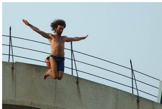
Hopp! Foto: Dragan Nikolić 2007

Från kaféerna vid torget kan de lokala männen iaktta hur den ena turistgruppen avlöser den andra. Luften genomkorsas av guider som leder sina grupper på italienska, engelska, svenska eller tjeckiska på väg mot bron och till souvenirshopen. Väl framme vid ingången, ”den gamla broporten”, möts de av en enorm Arméns BiH och det självständiga BiH:s flagga. Efter porten är de uppe på huvudattraktionen som uppfräschad och elegant med sin vitglänsande halvmåne förbinder två stränder. På krönet står unga män i badbyxor färdiga att utföra sitt konststycke: hoppet ner i Neretva. Det föregås av en insamling, 25 euro kostar ett hopp. Kamerorna rullar och ett sus av förväntningar går genom folkmassan när brohopparen försvinner ner i den blå floden, det avslutas med applåder när huvudet dyker upp bland vattenvirvlarna.