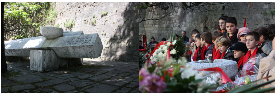
Minnesfontänen dagen före och på minnesdagen av den 29 november.

”Minnesmärket över de fallna kämparna i staden Jajce”, var den första destinationen i dagens minnesceremonier. Det lever annars ett undanskymt liv. Turister som under årens lopp besöker Jajce, stannar inte; inte ens guiderna uppmärksammar det.