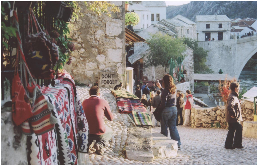
Don't forget.

Från hantverkarnas kvarter, kujundžiluks , på den norra sidan, är bilden av bron som vackrast, härifrån tas helst bilder i skymningen. Här finns också skyltar som vill berätta att detta är world heritage site . De sattes upp 2005, små plaketter med texten CHwB (Cultural Heritage without Borders/Kulturarv utan Gränser) erinrar också om den internationella hjälpsatsen.