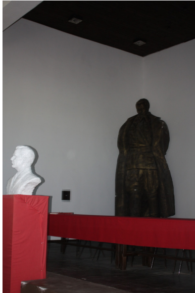
Samo vas gledam, majku vam božju! Foto: Dragan Nikolić 2007

Talaren utgick från den egna erfarenheten. Det han förkroppsligar är en livserfarenhet där nostalgi och hoppet om ett bättre samhälle, ”socialism enligt människans mått” som det en gång hette, fortfarande lever.