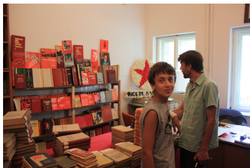
Tito och jag.

Mest kommer folk ur de äldre generationerna, som fått uppleva den tiden, ”redan frälsta”; men nästan ingen ungdom alls. Nu är det andra tider, andra värderingar. Jugoslavien var en stor idé men vi var små människor [...] Jag menar, för mig handlar patriotism om att vi måste kunna leva tillsammans och respektera varandra. Broderskap och enighet. Lyssna, i kriget var det serber och kroater som förstörde moskéer; muslimer förstörde kyrkor, och det gick i cirklar. Men detta, detta museum förstördes av dem alla. Alla nationalisterna är lika.