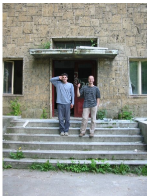
Framför det förstörda AVNOJ Museet. Sent 1990-tal.