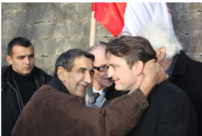
Beundraren och Presidenten.

”Minnesmärket över de fallna kämparna i staden Jajce”, var den första destinationen i dagens minnesceremonier. Det lever annars ett undanskymt liv. Turister som under årens lopp besöker Jajce, stannar inte; inte ens guiderna uppmärksammar det.