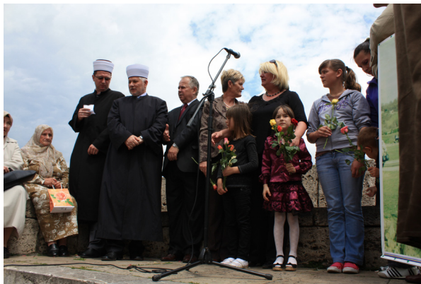
Talare. Foto: Dragan Nikolić 2010

Det var trångt när flera hundra människor samlades på bron mitt. Intrycket förstärktes ytterligare av en jättelik vit banderoll med namn på de försvunna och saknade višegradborna skrivna med rött. Sofa dominerade rummet. Här var också högtalarna och mikrofonen. Det var en space of appearance i dess rätta bemärkelse. Vilka var aktörerna och vad var det för synpunkter som framfördes vid mikrofonen?