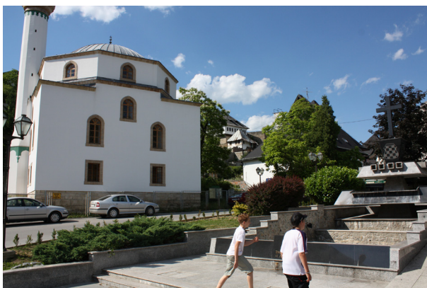
Hopplöshet. 2009

Att vandra i Jajce denna junikväll 2009, var ingen höjdare, det var tråkigt, gatorna var övergivna. Inte ens ljuset som kom från enstaka gatlyktor, förmådde kasta skuggor på den medeltida stadens spillror. Jag kände mig ensam. Det är en fem minuters promenad mellan huvudgatans två portar, Travniks- och Banja Lukas portar, öst och väst.