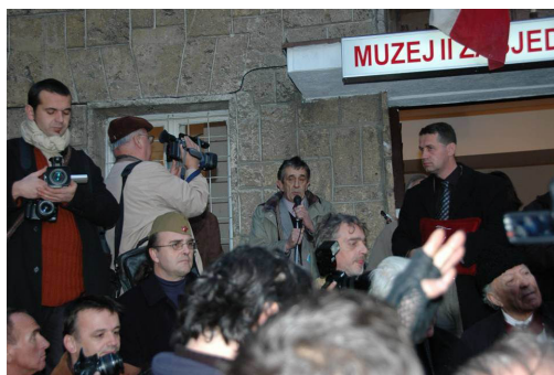
Inför återinvigningen av AVNOJ Museet.