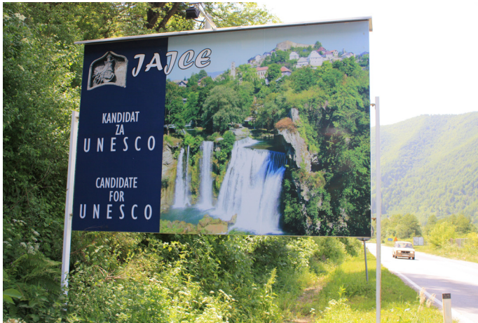
Candidate for UNESCO. Foto: Dragan Nikolić 2010

Vid mitt sista fältbesök i Jajce, i augusti 2010, förundrades jag över de enorma billboards vid sidan av vägen. Det var en pretentiös marknadsföring: 'Candidate' for UNESCO . Som en "metacultural production" med "'the list' as the most visible material outcome", med Kirshenblatt-Gimblett's ord (2004) talar skylten om för förbipasserande hur staden vill se sig själv. Det påminner inte så lite om den önskepolitik som ligger i staten BiH:s strävan att få status som kandidatland till EU. Men i juli 2009 blev Jajces kandidatur till UNESCO:s världsarvslista indragen. Hur gick det till?