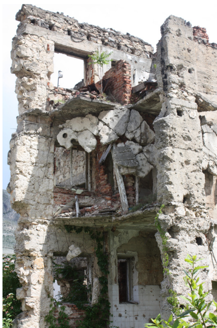
Dinosaurie. Krigsruinerna i Aleksa Šantićsgatan.

Mostars berömda skald Aleksa Šantić (1868–1924) har givit namn åt Šantićsgatan med dess alléer av grönskande träd. Han var en serbisk poet som bland annat skrev Emina , kanske den mest kända och vackraste bosniska sev-dalinka folksången. Den handlar om en omöjlig kärlek mellan den muslimska flickan Emina och den ortodoxe ynglingen – Aleksas alter ego.