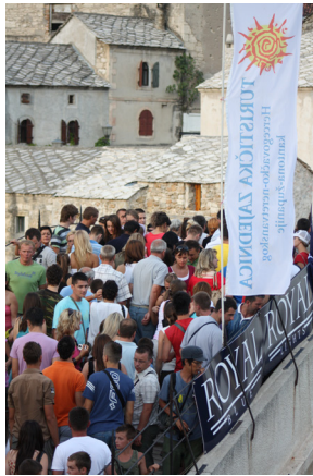
På bron.

Från kaféerna vid torget kan de lokala männen iaktta hur den ena turistgruppen avlöser den andra. Luften genomkorsas av guider som leder sina grupper på italienska, engelska, svenska eller tjeckiska på väg mot bron och till souvenirshopen. Väl framme vid ingången, ”den gamla broporten”, möts de av en enorm Arméns BiH och det självständiga BiH:s flagga. Efter porten är de uppe på huvudattraktionen som uppfräschad och elegant med sin vitglänsande halvmåne förbinder två stränder. På krönet står unga män i badbyxor färdiga att utföra sitt konststycke: hoppet ner i Neretva. Det föregås av en insamling, 25 euro kostar ett hopp. Kamerorna rullar och ett sus av förväntningar går genom folkmassan när brohopparen försvinner ner i den blå floden, det avslutas med applåder när huvudet dyker upp bland vattenvirvlarna.