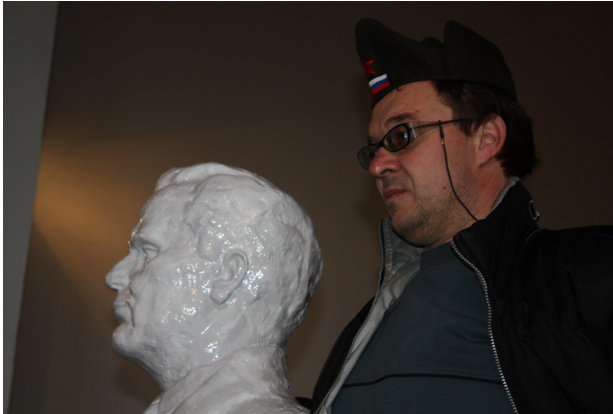
Bakom Titos byst. Foto: Dragan Nikolić 2008

Dagen efter 65-årsjubileumsfirandet, var den slovenska delegationen återigen på besök i museet, pilgrimsfärdens sista programpunkt. En efter en, fotograferades de på talarstolen bakom Titos byst. En öppen bok innehållande AVNOJ-sessionens beslut, tidningsartiklar och autentiska fotografier, stod där till förfogande. Med ryggen mot scenen och blicken mot auditoriet och artefakterna i hallen, testade var och en av besökarna hur det kändes att stå i rampljuset. Många stannade längre bakom Titos byst. Vad tänkte de? Kanske liknande saker som de lade fram för statyn i födelsebyn Kumrovec: