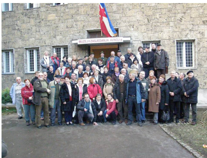
En sista bild.

AVNOJ Museet framstod i det ljuset som ett antifascistisk space of appearance där människor gick ut ur det privata och blev samhället. Men det som verkligen saknades i detta fall var just ett samhälle som fungerade enligt de idéer som kom i dagen under de många ceremonierna. I stället för att bli den process som gjorde människor till medborgare blev de till kritiker av det existerande politiska systemet. AVNOJ Museet blev på det viset en plats där minnet och den stora berättelsen om Titos Jugoslavien aktualiseras som fiktion. Men hade det också potentialer för en repolitisering?