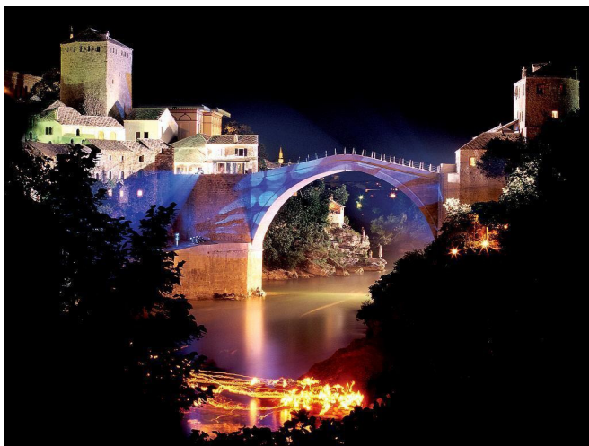
Invigningen.

Det rådde stor uppståndelse när bron stod färdig för högtidlig öppning i juli 2004. Tusentals poliser fanns på plats, fullt säkerhetspådtag. Poliser patrullerade både uppströms och nedströms floden Neretva för att förhindra eventuella incidenter. Men det var inte kvällens huvudperson, bron, som man i första hand ville beskydda utan de hundratals högt uppsatta utländska gäster och kungligheter, däribland brittiska prins Charles. Det verkade som att världens antikvariska och samhällselit hade samlats för att ersätta krigsminnen med goda intentioner. Med sin närvaro skulle de gjuta liv i detta som kulturarv och underverk.