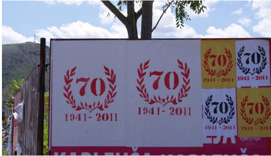
70-år av upproret mot fascismen i BiH. Foto: Dragan Nikolić 2011

Anledningen till att de sydde egna banderoller, målade och för hand gjorde affischerna, sublimerades till en enkel hyllning till alla de människor i landet som 1941 stod upp emot fascistiskt förtryck. Idag är de medvetna om att ”varje revolution bär på fröet av egen förstörelse”, som den erfarna Antifa-aktivisten Boro, en skarp och mycket kritisk man i 35-årsåldern uttryckte det, genom att dra paralleller till den historiska antifascismen i BiH och Jugoslavien.