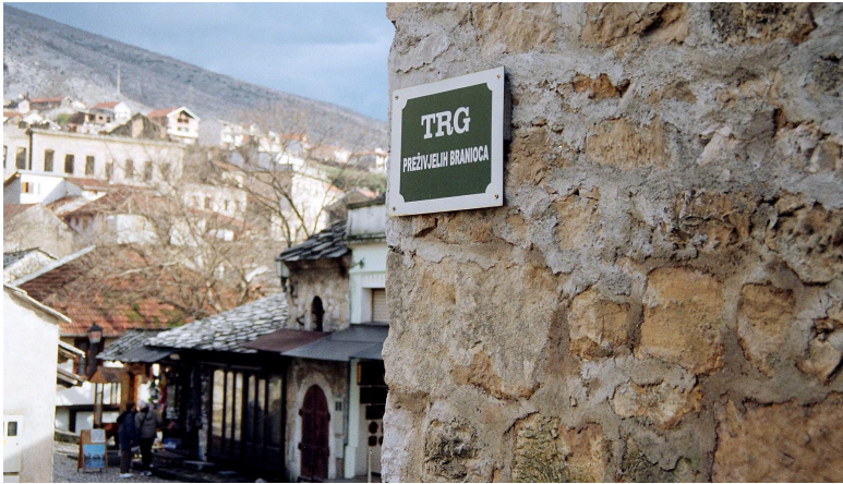
Trg preživjelih branioca/ De överlevda försvararnas torg.

Det är en tidig vårdag 2008 i den gamla staden i Mostar. Morgonsorl sprider sig från kaféerna. I stadskärnan lägger jag märke till en skylt där det står Trg preživjelih branioca/ De överlevda försvararnas torg .