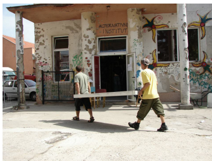
Aktivitetter.