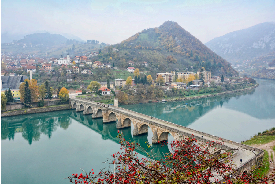
Bron över Drina.

Immaterialitetens källa och materialitetens höjdpunkt i detta rika landskap är Bron över Drina i Višegrad: