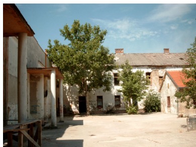
Abrašević – bron över det torra. Foto: Dragan Nikolić 2007

reläsningar och workshops, vilket har lockat unga människor från hela Europa och världen. Abrašević är ett upplevelserum: å ena sida en ruinvärld fylld med krigsmardrömmar, å andra sidan ett utrymme under uppbyggnad, öppet för internationalisering och utbyte av sociala erfarenheter och kulturella uttryck.