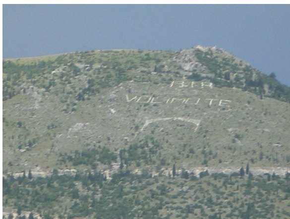
BiH – volimo te/ BiH – vi älskar dig. Foto: Dragan Nikolić 2008

Året var 1994 när okända aktörer ”över en natt” omvandlade ursprungliga ”TITO”-inskriftioner till dem nuvarande. Appropriering av bron som symbol för den nya självständiga staten BiH.