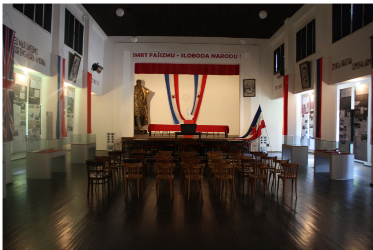
AVNOJ Museet två år efter invigningen.

Vi har sett hur människor hanterar mångfalden och vad de rent praktiskt använder kulturarv och historia till, men att söka samförstånd för ett kulturarv, som AVNOJ Museet, när staten inte längre finns och har ersatts av sex nya nationer, är betydligt mer problematiskt. Enligt Tihomir Cipek, är det egentligen den ”politiska eliten som ansvarar för symbolernas politik och för den offentliga diskursen om platser för kollektivt minnande. Därför är det en nödvändig uppgift för varje demokratisk historiepolicitet att nå enighet om de viktiga historiska händelser som möjliggör de grundläggande värderingar som ligger bakom varje demokratiskt politiskt system” (Cipek 2009b:164).