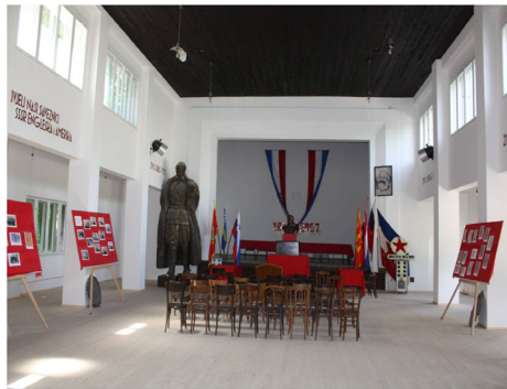
Museet som ett sjukhus.

I Visby kunde man njuta av en mer avspänd relation till de personliga minnena. Ingen som kom ihåg sin barndoms värld och det politiska system som rådde då, riskerade att ställas utanför gemenskapen. Man hade heller inga grupper som i raseri gav sig på att förstöra byggnader för att därmed utplåna ovälkomna minnen. Ibland kan de lieux de mémoire som Pierre Nora skriver om vara stående provokationer, och så förhöll det sig med AVNOJ Museet.