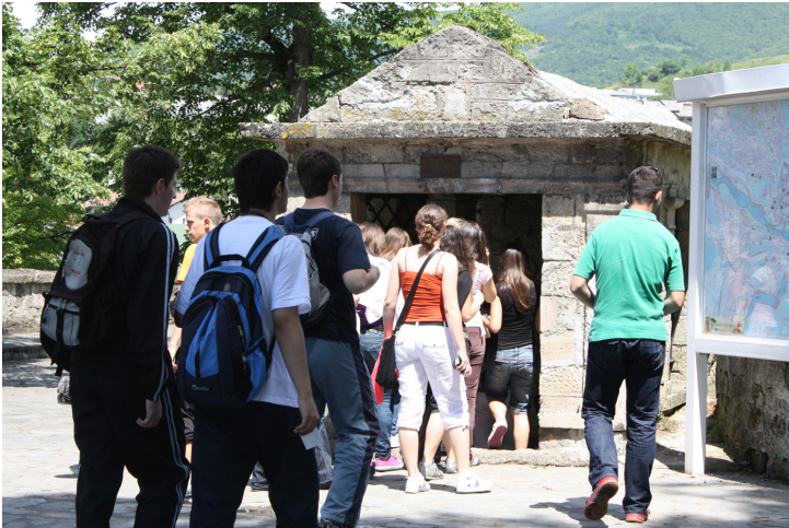
Skolexkursion vid katakomben. Foto: Dragan Nikolić 2008

Katakomben är idag ett ”nationellt monument”.