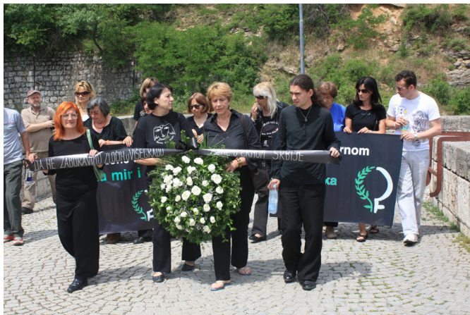
Kvinnor i Svart. Foto: Dragan Nikolić 2009

”Kvinnor i Svart” var de första som tågade in på bron. De ställde sig mot stenmuren. Stillastående höll de i en blomkrans och en banderoll där det gick att läsa följande: ”Att aldrig glömma de brott som begåtts i Višegrad, Kvinnor i Svart, Serbien” samt ”Kvinnor i Svart för fred och mänskliga rättigheter”. Inga gester, inga rörelser eller röster – slutet tystnad.