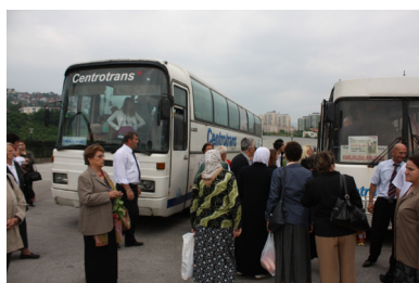
Samling. Foto: Dragan Nikolić 2010

”Var är Bećirević, Fadila Bećirević?” – ropade en av organisatörerna högt. Det var kaotiskt på platån framför Istikal Moské i stadsdelen Otoka. Moskén var en av många överväldigande sakrala byggnader som uppfördes efter kriget med hjälp av utländska donationer. Till sin storlek och sin robusta karaktär med två raketlika minareter såg den felplacerad ut i det bergiga bosniska landskapet med traditionellt små bosniska moskéer med en minaret. Fördelen var dock tillgången till en stor och allmän parkeringsplats.