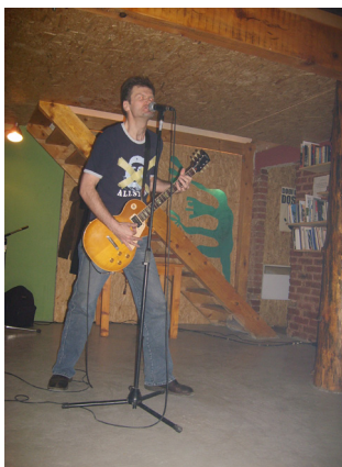
Diplomat . Foto: Elma Zekić 2010

Maj månad 2010. Konsert i OKC Abrašević. Diplomat är genialisk. Varje gång han beträder scenen, förvånas publiken på nytt av förvandlingen från en känslig själ till djävul. Han är iklädd en vanlig t-shirt med Che Guevaras bild på. T-shirten är i själva verket ett rekvisit som han i en teatralisk iscensättning överstryker med tejp. Che Guevara förvandlas till en icke önskvärd hjälte. Diplomat flirtar inte med publiken utan rör sig i och med den. Allt han tar med sig är elgitarr och sång. Trots det känns mosaiken inte som målad med brutet penseldrag, utan försedd med dunig pappersteknik. Han viskar: