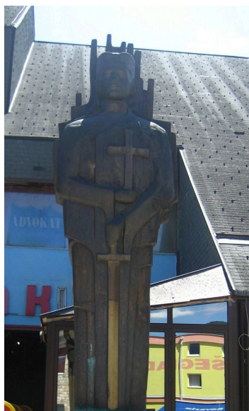
Monument till minnet över fallna serbiska soldater i fosterlandskriget 1992–1995.