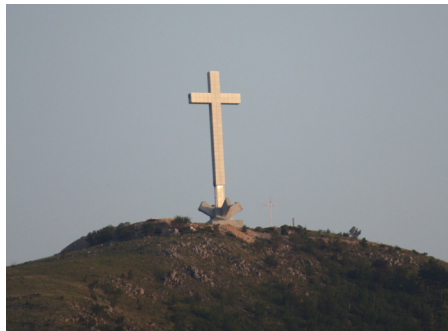
Millenniekors ovanför Mostar.

Närmar man sig Mostar från landets norra delar, häpnar man över skönheten i Neretvas kanjon liksom man förbryllas över det enorma korset på berget Hum ovanför staden.