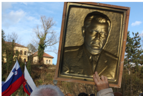
Efter Tito Tito.

Jugoslavien finns inte kvar som politisk realitet. Inte heller finns några jugoslaver, åtminstone officiellt. Men drömmarna finns kvar, nu i form av en utopisk samhällsidé och ett känslomässigt förhållande till en tröstande myt.