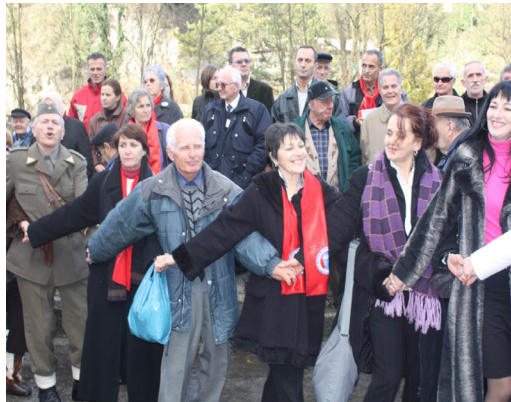
Kozaračko kolo .

När det väl var dags för ringdansen Kozaračko kolo , minglade ”Marskalken” med folkmassan. Han såg ut av att vara väl till mods, samtidigt som hedersbevisningsutrop: Leve kamrat Tito – Leve! ekade. Ung som gammal hängde med och dansade till mässingsorkestern.