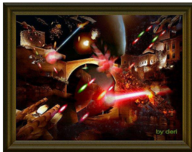
Aliens attack!

Har du sett videoarkivet? Den 8 november var dagen när Bron förintades, 50–60 tankgranater träffade bron denna dag. Dagen efter avslutades jobbet monstruöst. Jag har sett det hela med egna ögon. Denna dag kunde hela världen bevittna fördelsen och man fördömde det som en anti-civilisatorisk akt. Då, 1993, fanns denna del av Mostar inte på jordklotets karta. Vem som helst kunde komma hit, knivhugga, våldta, fängsla och stoppa folk i koncentrationsläger. Försök bara förstå mig, jag är en man från ett blandat äktenskap, som växte upp vid Neretva, där jag spelade gitarr och skådespelade. Två dagar innan min 19-årsdag blev jag sårad. Historien kom till efter det att man kommit ut med snacket om att vi själva minerade bron [...] Det var då som vi kom på att det var utomjordningar som måste ha gjort detta. Vi skapade en berättelse om utomjordningar – som gjorde att hela landet höll på att skratta ihjäl sig. Alltså: utomjordningar landade i Sahara, sen har de med kamelernas hjälp transporterat sprängmedel till ubåtarna. Därefter har de via Medelhavet uppnått Neretvafloden och till slut Mostar där de också minerade bron (Lase).