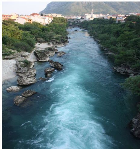
Carinski buk . Floden Neretva i Mostar. Foto: Dragan Nikolić 2007

Men jag var inte beredd på styrkan i de sinnliga intrycken när jag en het dag i april månad 2007 grävde fram min ryggsäck ur den dammiga och överbelastade bussens innanmäte. Resan hade gått genom Bosniens otämjda bergslandskap till det soliga och steniga Hercegovina. Och väl här fascinerades jag av stadens larm, de många ruinerna och flodens reflexer. Här fick man hela tiden intrycket av att befinna sig över – över floden Neretva, över flodbäddarna. Inte mindre än fem broar är spända över dess vatten.