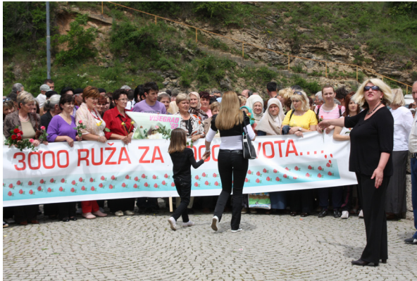
3 000 rosor för 3 000 offer.

Under tiden som deltagarna från konvojen sakta tågade in på bron, trängdes folk från media för att få bästa möjliga utsikt. En känsla av klaustrofobi likt 9 november minnesceremoni på Den gamla bron i Mostar gjorde sig påmind.