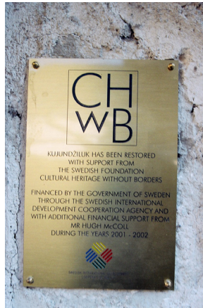
KuG. Foto: Dragan Nikolić 2007

Från hantverkarnas kvarter, kujundžiluks , på den norra sidan, är bilden av bron som vackrast, härifrån tas helst bilder i skymningen. Här finns också skyltar som vill berätta att detta är world heritage site . De sattes upp 2005, små plaketter med texten CHwB (Cultural Heritage without Borders/Kulturarv utan Gränser) erinrar också om den internationella hjälpsatsen.