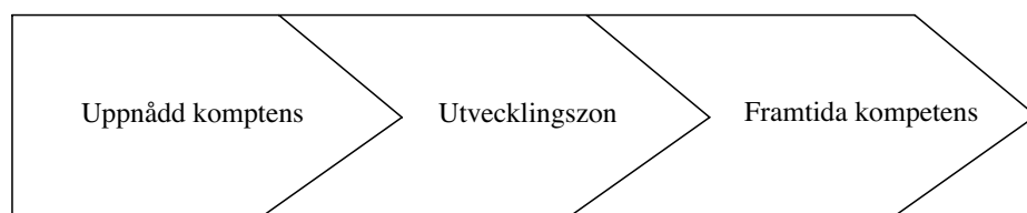
Figur 2: Utvecklingszon (Säljö, 2000, s. 122)

Idén med den närmaste utvecklingszonen är att det finns en potential hos individen som kan utvecklas endast med hjälp av andra. Greenfield (1984) framhåller med stöd av Wood, Wood och Middleton denna "Region of sensitivity" som ett område i gapet mellan förståelse/fattningsförmåga (comprehension) och framförande. Nya färdigheter måste således förstås även om de ännu inte framställts eller visats upp. Denna idé applicerad på scaffolding betyder att läraren utgör ett minimalt stöd till den lärande för att producera nya färdigheter som förstås men som ännu inte prövats i en presentation eller ett framförande. För att ytterligare belysa detta kan parallellt dras till Säljö (2000) modell av zone of proximal development som illustrerar just detta: