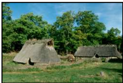
Figur 6. På museets bronsåldersgård finns rekonstruktioner av två långhus från äldre respektive yngre bronsålder. Här utförs både guidade visningar samt lägerskoleverksamhet.

för funktionshindrade med träbryggor över hållarna (Svensson 2000:106). På hemsidan finns dessutom utförlig information om museets tillgänglighet samt exempel på olika satsningar för funktionshindrade. Man erbjuder bland annat specialvisningar för synskadade. På hemsidan finns även information om att all personal genomgår en basutbildning kring tillgänglighet och bemötande av personer med funktionshinder. Om man inte vill delta i en guidad visning finns även en handdator att tillgå (Fig.7). Guiden innehåller ljud, bilder och animationer av hållristningarna och kan således användas av både synskadade och hörselskadade (Vitlycke museums hemsida).