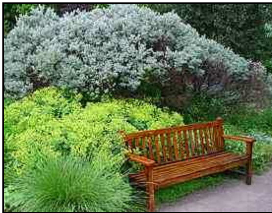
Figur 10. I trädgårdsmiljöer planeras ofta sittplatser som små oaser i omgivningen. I intervjuerna framkom att detta var önskvärt även i arkeologiska miljöer, där man kunde sitta och insupa atmosfären.

grupp ska kunna komma in i och röra sig runt i museet. Exempel på detta är hissar, breda dörrar och ledstänger. När det gäller utställningar är flera faktorer viktiga. Eftersom den som sitter i rullstol har lägre ögonhöjd än andra vuxna måste allt anpassas. Allt som ska nås med händerna måste vara inom räckhåll. Har man datorer eller dylikt i lokalen ska man kunna komma in under bordet med knäna. Alla skyltar och föremål måste placeras i en höjd som är anpassad för rullstolsbundna. En annan viktig aspekt är belysningen som måste placeras där den inte bländar. Möjligheter att sitta och vila på flera platser är viktigt för dem som har svårigheter att gå (Svensson 2000:23f). I intervjuerna poängterades särskilt vikten av viloplats och små oaser. En idé som diskuterades var att anpassa viloplatserna i museimiljön, i exempelvis en återskapad miljö (Fig.10; se avsnitt 5.5).