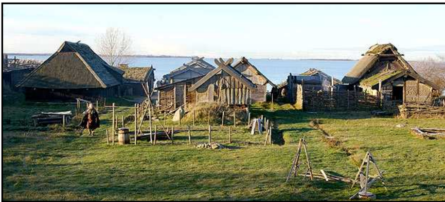
Figur 13. Foteviken i Skåne län är ett rekonstruerat samhälle som det kan ha sett ut under sen vikingatid – tidig medeltid. Flera intervjudeltagare poängterade just vikten av rekonstruktioner för förståelsen av forntiden.

Om man ser på hur arkeologin kommunicerar utanför museernas väggar finns exempelvis fornbyar, lajvspel och besök på utgrävningar. Här är mycket av den arkeologiska informationen inriktad på upplevelser (Petersson Bodil 2003) Kanske skulle man ta lärdom från dessa sätt och inspirera till mer upplevelseinriktade arkeologiska utställningar. I intervjumaterialet framkom att just fornbyar och andra rekonstruerade miljöer uppskattades mycket av besökaren, man ville se miljön framför sig (Fig.13).