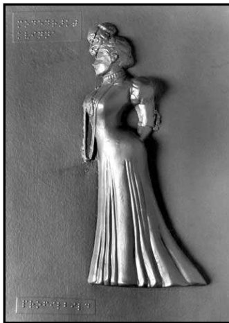
Figur 4. Exempel på en synskaderelief från Nordiska museet, i detta fall placerad i en utställning om dräktskick.

Nordiska museet i Stockholm (Fig.3) är ett nationellt museum för historisk samt nutida kultur och har sedan 1980-talet arbetat med tillgänglighetsfrågor. Deras tillgänglighetsguide vänder sig särskilt till rörelsehindrade och synskadade. I flera av utställningarna används så kallade synskadereliefer (Fig.4) vilket innebär att själva reliefen tillsammans med punktskrift berättar om utställningarnas innehåll. Dessa kan synskadade och även andra besökare känna på för att få en uppfattning om föremålen i utställningarna. Man kan samtidigt även lyssna på en audioguide med mer information om utställningen (Fig.5). Audioguiden har punktskriftsmärkta sifferknappar och beskriver allt från möbler till dräkter. Denna kan även användas av icke synskadade då olika versioner finns att tillgå. För hörselskadade finns en bärbar guideradio som kopplas till hörapparaten (Grip 2002:34ff; Hansson 1992; Nordiska museets hemsida).