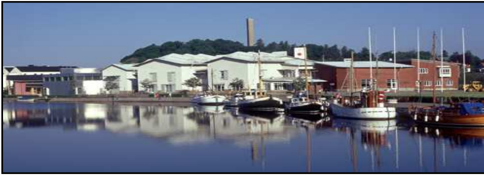
Figur 8. Museibygnaden ligger i den gamla hamnstaden Uddevalla.

precis som på Vitlycke museum utbildning om olika funktionshinder. Museet arbetar, genom Statens kulturråd och Allmänna arvsfonden, även just nu med en förstudie om hur man ökar tillgängligheten på museer. Hur man kan använda olika tekniska lösningar för att förmedla upplevelser för syn- och hörselskadade står i centrum i studien (Bohusläns museums hemsida).