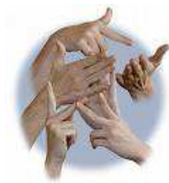
Figur 11. Under intervjuerna framkom att guide visningar hade ett stort värde för förståelsen av arkeologiska utställningar. Om man dessutom använder sig av både tal och teckenspråk under visningar blir kommunikationsvärdet ännu större.

För att man som hörselskadad eller döv ska kunna ta del av en utställning krävs olika åtgärder. När man har nedsatt hörsel har man stora svårigheter att uppfatta ljud i lokaler som är bullriga. Ljudklimatet måste vara bra för att till exempel guidens röst ska urskiljas. Vissa hörselskadade använder hörapparat som hjälpmedel. Dessa hjälper till en viss del men om bakgrundsljuden är för höga kan hörapparaten istället ställa till med besvär. Det är en fördel om hörseltekniska hjälpmedel finns för utlåning på museerna så att hörselskadade kan följa med på guide visningar. Annars är specialvisningar med teckenspråkskunnig guide också ett alternativ (Fig.11). När det gäller utställningar med film och video ska dessa vara textade och det ska gärna finnas hörselslinga tillgänglig (Svensson 2000:25f).