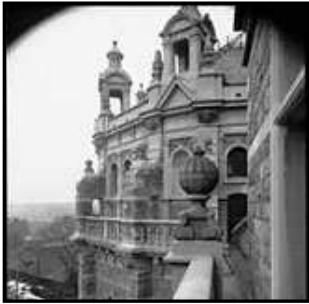
Figur 3. Bild av museets västra sida, bild tagen 1907.

Nordiska museet i Stockholm (Fig.3) är ett nationellt museum för historisk samt nutida kultur och har sedan 1980-talet arbetat med tillgänglighetsfrågor. Deras tillgänglighetsguide vänder sig särskilt till rörelsehindrade och synskadade. I flera av utställningarna används så kallade synskadereliefer (Fig.4) vilket innebär att själva reliefen tillsammans med punktskrift berättar om utställningarnas innehåll. Dessa kan synskadade och även andra besökare känna på för att få en uppfattning om föremålen i utställningarna. Man kan samtidigt även lyssna på en audioguide med mer information om utställningen (Fig.5). Audioguiden har punktskriftsmärkta sifferknappar och beskriver allt från möbler till dräkter. Denna kan även användas av icke synskadade då olika versioner finns att tillgå. För hörselskadade finns en bärbar guideradio som kopplas till hörapparaten (Grip 2002:34ff; Hansson 1992; Nordiska museets hemsida).