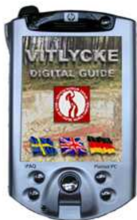
Figur 7. Vitlyckeguiden består av en handdator som ger möjlighet att få en personlig visning av hållristningarna. Man kan även ansluta två hörlurar till guiden så att två personer kan använda den samtidigt. Den finns förutom på svenska även på andra språk.