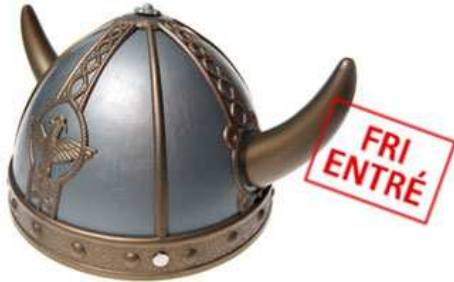
Figur 14. På Historiska museet har man en virtuell utställning om vikingar. Det finns även möjlighet att se filmsnuttar om perioden.

Statens historiska museum där man valt att lägga ut en vikingautställning på hemsidan (Fig.14; Historiska museets hemsida). Detta underlättar för publiken att ta del av arkeologiska utställningar utan att själva befinna sig på museet. För bland annat astmatiker vilka ofta är helt uteslutna ur museigemenskapen kan detta vara ett sätt att ändå fördjupa sitt intresse. Men det är aldrig ensamt en hållbar lösning då det samtidigt kan bidra till isolering.