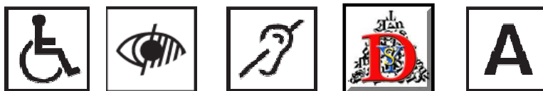
Figur 1. Symboler för rörelsehinder, syn- och hörselskador, läs- och skrivsvårigheter samt allergi och astma.

Människor med funktionshinder möter de flesta av oss dagligen utan att alltid vara medvetna om det. Eftersom ett funktionshinder kan vara stort eller litet syns det nämligen inte alltid utanpå. Skador som medför ett funktionshinder kan vara medfödda, tidigt förvärvade eller orsakade av sjukdom eller olycka. Dessa skador kan innebära vissa begränsningar i det dagliga livet, det vill säga funktionshinder. När funktionshindrade människor möter brister i samhället så uppstår ett handikapp (Gotthard 2002:9f). Det är viktigt att skilja på just begreppen funktionshindrad och handikappad. "Ett handikapp är inte någon egenskap hos den enskilda" (Dammert 2000:6). När samhället anpassas till alla människors behov minskar även handikappen. Enligt Hjälpmedelsinstitutets hemsida finns det drygt 1,3 miljoner människor i åldrarna 16-84 år som har någon form av permanent funktionsnedsättning (Hjälpmedelsinstitutet