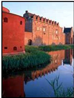
Figur 2. Ett exempel på en byggnad med kulturhistoriska värden är Malmöhus slott där Malmöhus slott är otillgängligt och där det av bevarandeskäl är omöjligt att bygga in hissar i slottet.

Detta beslut gäller även museer. Det finns dock ett undantag för miljöer där ”kulturhistoriska, miljömässiga eller konstnärliga värden måste beaktas” (Prop.1999/2000:79 s.42). Problemet för många museer är just att de är förlagda till äldre byggnader där tillgänglighet inte var en faktor när de byggdes. Dessa byggnader försvårar arbetet för tillgänglighet när man samtidigt måste ta de kulturhistoriska värdena i beaktan (Fig.2).