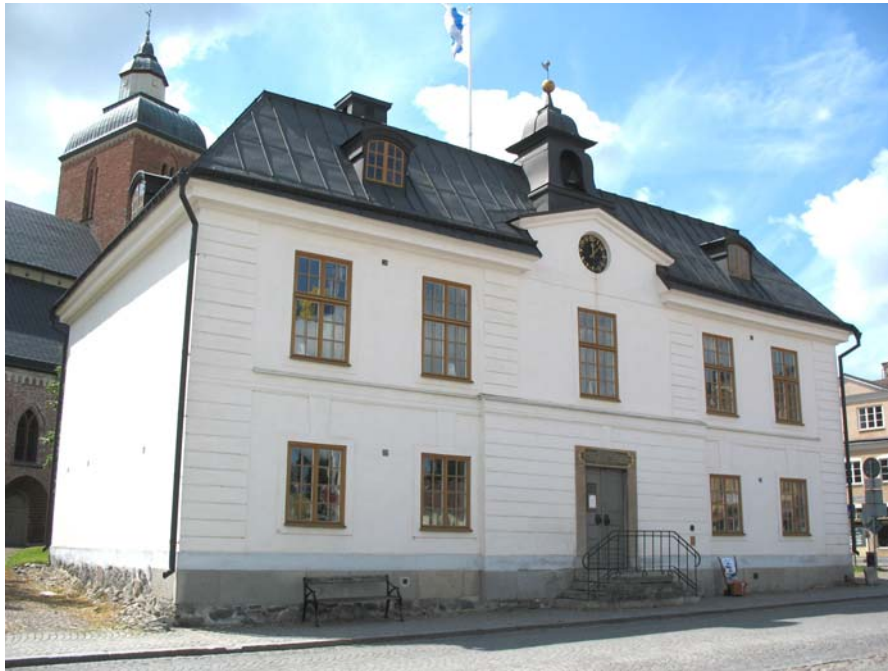
Skänninge rådhus sett från torget, 2006