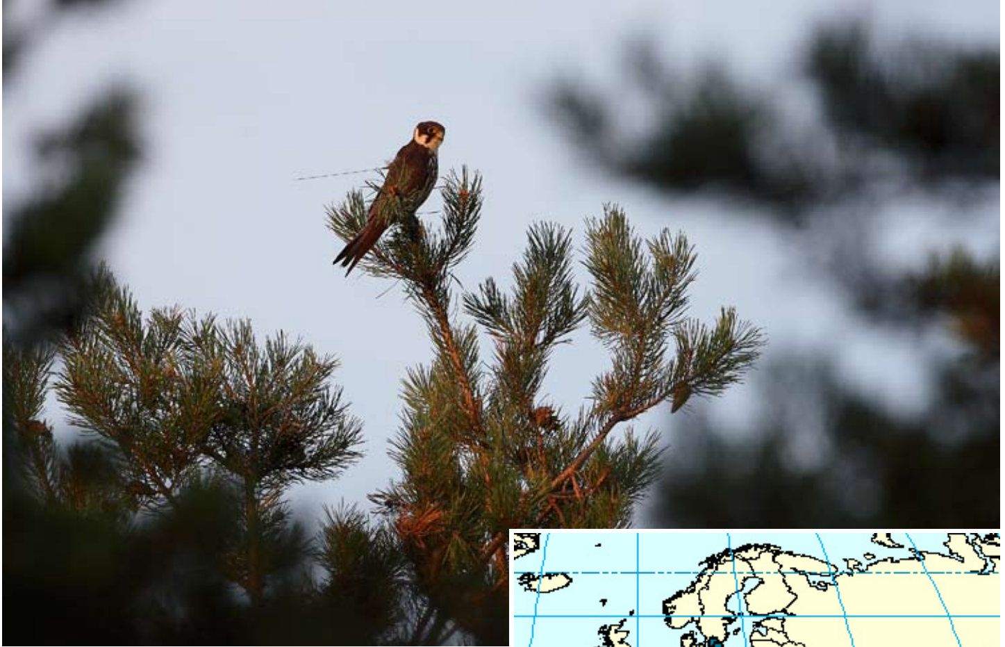
Adult lärkfalk försedd med satellitsändare.

Till höger: Flyttningväg för den adulta lärkfalkhonan som följdes med satellitsändare under hösten 2005. Notera den västliga rutten genom Sahara och kursändringen i norra Elfenbenskusten.