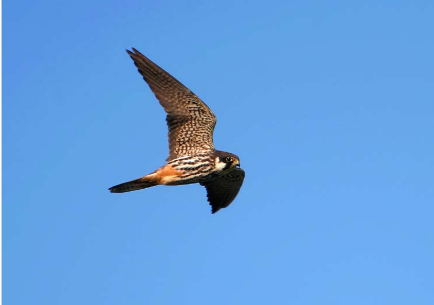
Lärkfalk Falco subbuteo.