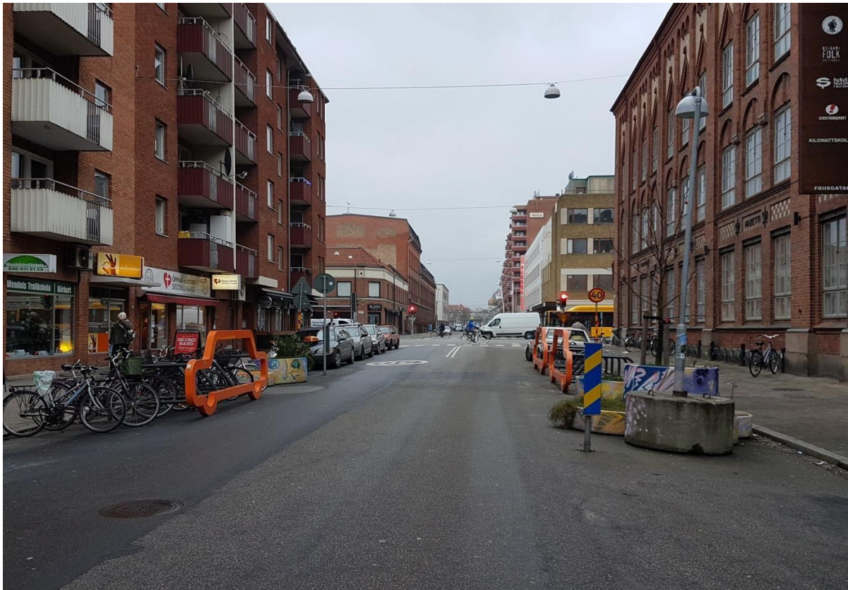
Figur 1. Friisgatan, Malmö (Andersson 2017)

Triangeln man når. Här finns även många bostäder, och på en före detta parkering vid Biografen Panorama byggs det nya sådana. Planteringsanläggningar som även fungerar som bilavgränsare ses, samt cykelställ i vad som tidigare varit väg för bilar och cyklister. Verklighetens Kulturstråk är intetsägande, och inget som kan härledas till planeringen om kommunikation eller visualisering av Kulturstråket går att hitta.