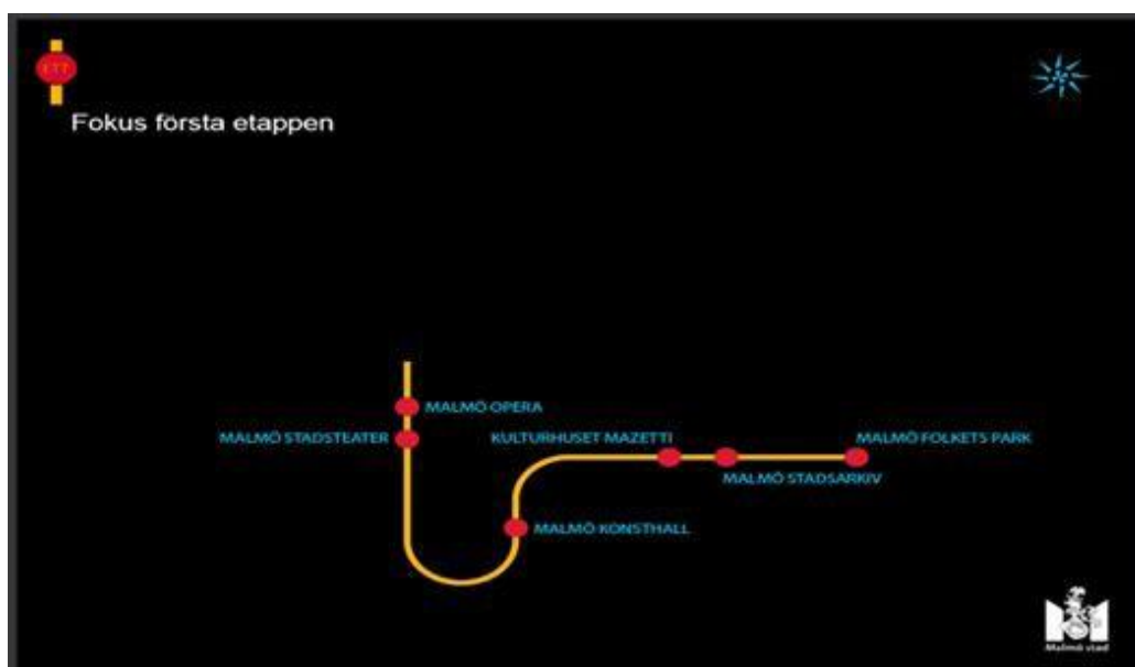
Figur 4, FAS 1 (Malmö stad 2018).

I intervjun med personal som arbetat med Kulturstråket framkom det att Kulturstråket hade haft begränsningar i budget,