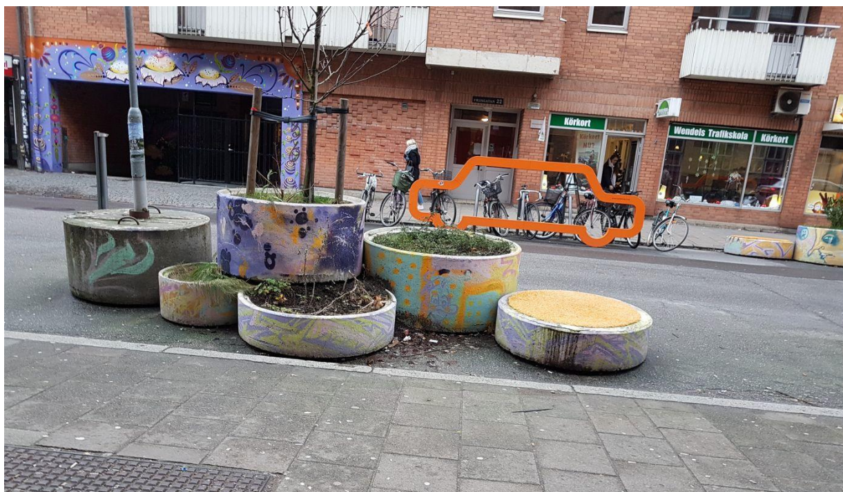
Figur 2. Friisgatan, Malmö (Andersson 2017)