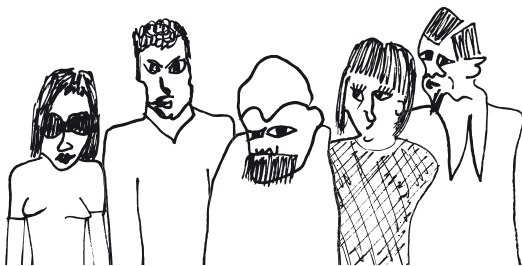
Illustration: Alexander Florencio