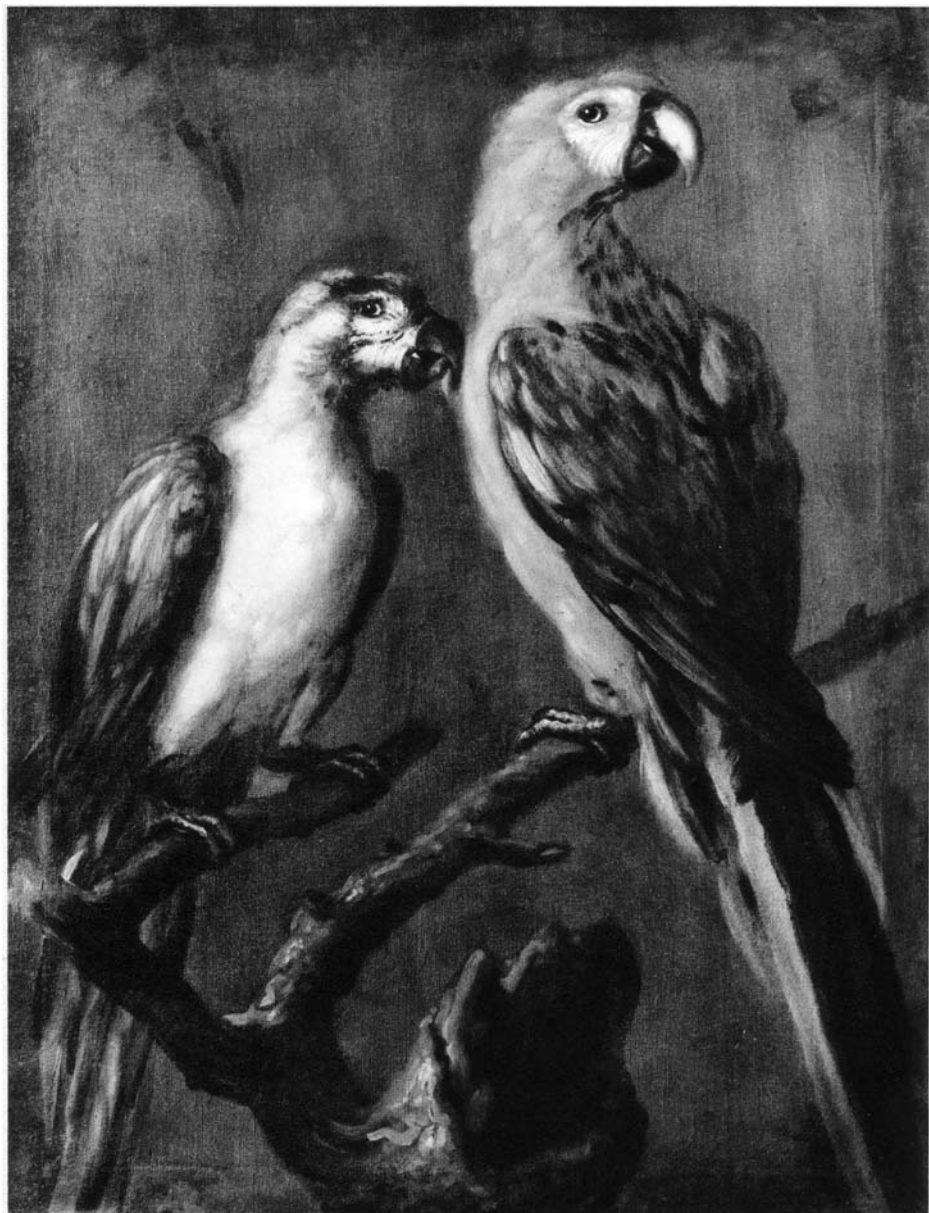
David Klöcker Ebreusstrahl, Två papegojor (ca 1696).