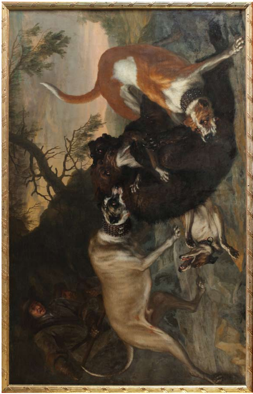
8. David Klöcker Ekenström, Björn i kamp med fyra av Karl XI:s hundar (1674).