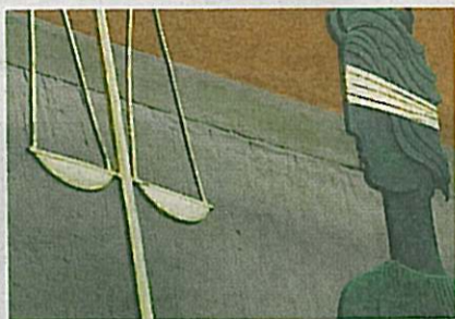
"Rättvisan är blind" är en metafor för rättsväsendets opartiskhet.