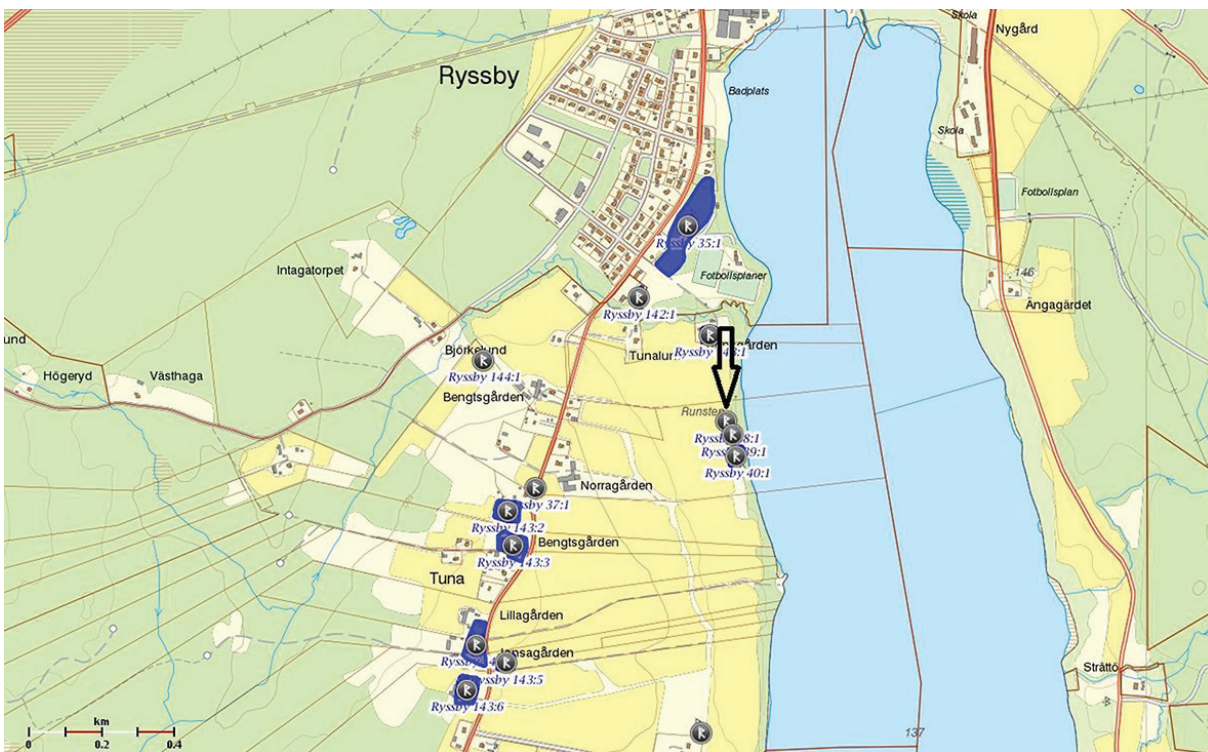
Fig. 1. Fornlämningssmiljön kring Tuna by, Ryssby socken. Pilen markerar läget för runstenen Sm 42, som är registrerad som RAÄ 38:1 i fornminnesregistret.

Runstenen i Tuna by (Sm 42) står i en öppen hagmark i anslutning till åkermark cirka femtiofem meter från Ryssbysjöns strand på dess västra sida (fig 1). Texten omtalar att den är rest över Assur som var kung Haralds skeppsman. Inskriften lyder ”tumi x risit : stin : thansi : iftir x asur : bruthur x sin x than : ar : uar : skibari :hrhls : ku I nuks : ”, i nusvensk översättning: ” Tumme reste denna sten efter Assur, sin broder, som var skeppsman åt kung Harald ”. (Gustavsson 2008, s. 203). Vilken kung Harald som avses är oklart även om flera alternativ diskuterats (se nedan).