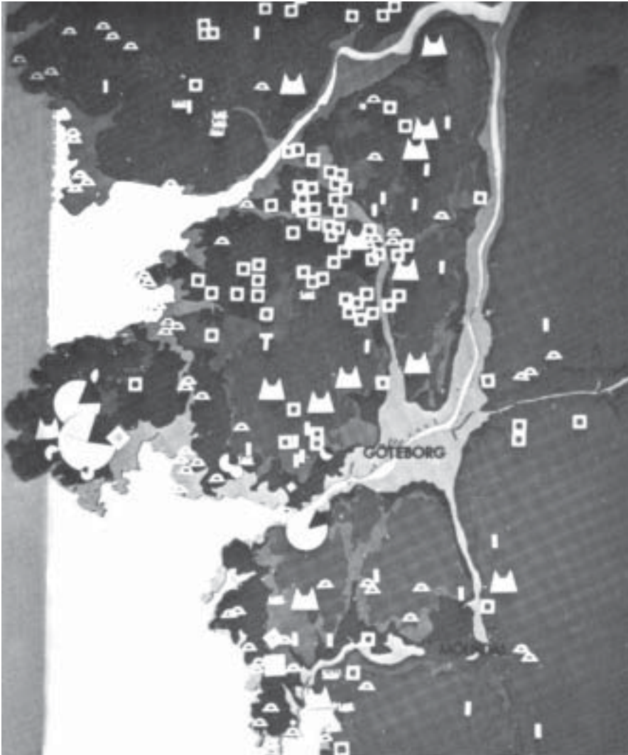
Fig.3. Fornlämningar i Göteborgstrakten, Karta i dåvarande Göteborgs arkeologiska museum, sammanställd efter de arkeologistuderandens grupparbeten 1960.

sin, förteckna material och kartera, åka ut och hitta öarna och forn­lämningarna i terrängen och fundera över vilka slutsatser vi kunde dra av vad vi såg. Allt förenades sedan på en jättetekarta som sattes upp på Arkeologiska museet (fig.3). Det var egentligen inte någon exceptionell övning