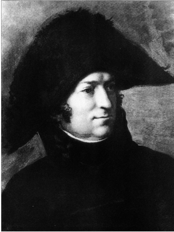
Carl-Johan Adlecreutz. Utkast till oljeporträtt av P. Kraft d.y.

som skydd mot eventuella brittiska sjöanfall. Kommunikationen med regeringen i Danmark var även kraftigt försvårad genom den brittiska sjödominansen. Den dansk-norska handlingsförlamning som det brittiska hotet orsakade gjorde att initiativet gled över till Sverige som i början av maj inledde en offensiv in i södra Norge. Kriget fördes med väldigt låg intensitet och redan den 19 maj 1808 fick Armfelt order om att endast försvara de norska gränsposteringar man dittills tagit. 141