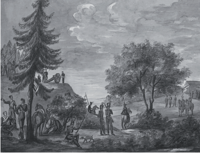
Lägerscen med officerare och soldater. Akvarell av Oscar I.