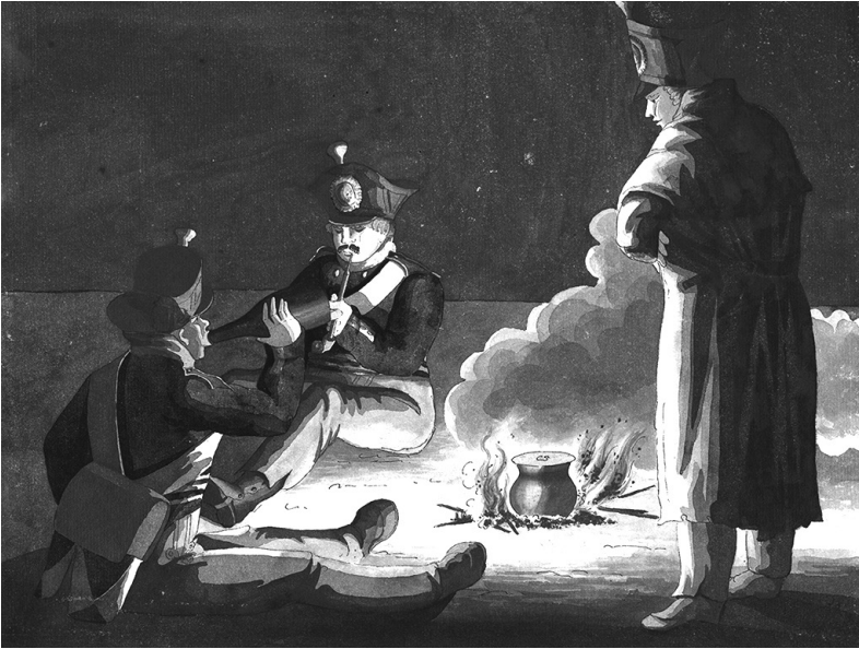
Svenska soldater kring en lägereld. Akvarellerad pennteckning av Carl Johan Ljunggren.

De långa perioderna av sysslolöshet gav gott om tid för personliga relationer att göra sig gällande för såväl soldater som officerare. Bland officerarna florerade ett umgängesliv som till formen försökte efterlikna det som präglade den fredstida tillvaron i Sverige. Sällskapslivet bland eliter i Sverige under 1700-talet har beskrivits som tämligen segregerat. Mot slutet av århundradet ledde emellertid den ökade sensibiliteten, den personliga vänskapskulten och uppvärderingen av individen till att den traditionella åtskillnaden mellan stånd hamnade något mer i bakgrunden. Sedermera skulle emellertid begreppet klass inta en viktig position i identifikationen av vad som utgjorde ett gott sällskap. 271 Erika Nylander, som detaljstuderat umgängeskulturen på Sveaborgs fästning under framför allt 1780-talet, bekräftar bilden av segregerade umgängesmonster och framhåller den livliga ordensverksamhetens betydelse. Under det sena 1700-talet blev det allt mer populärt att organisera umgänge i