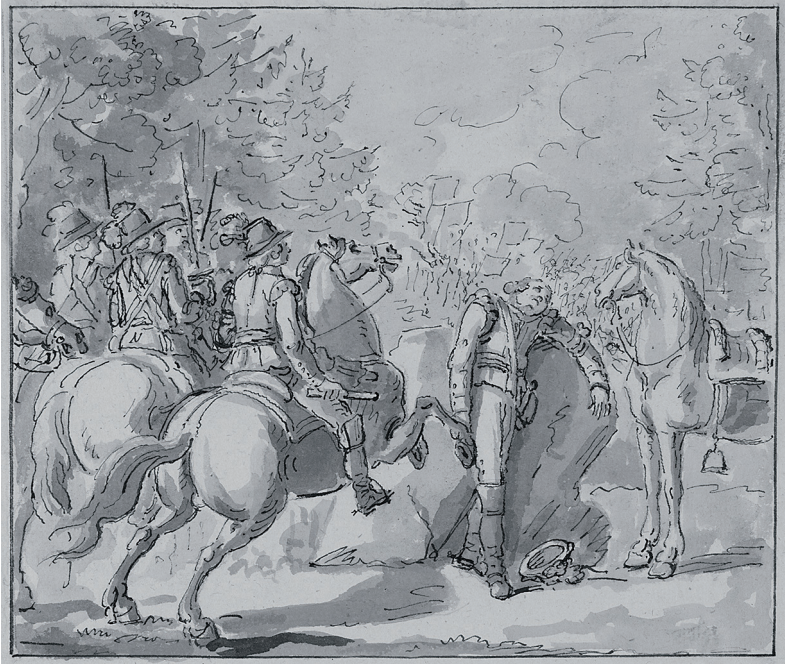
"Walkiala den 29 april 1790". Tuschlaverad pennteckning av Pehr Hilleström.