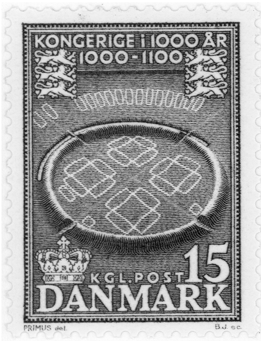
Figur 3. Dansk frimärke som avbildar trelleborgen Trelleborg vid danska Slagelse och som framhäver Danmarks långa kontinuitet som kungarike.