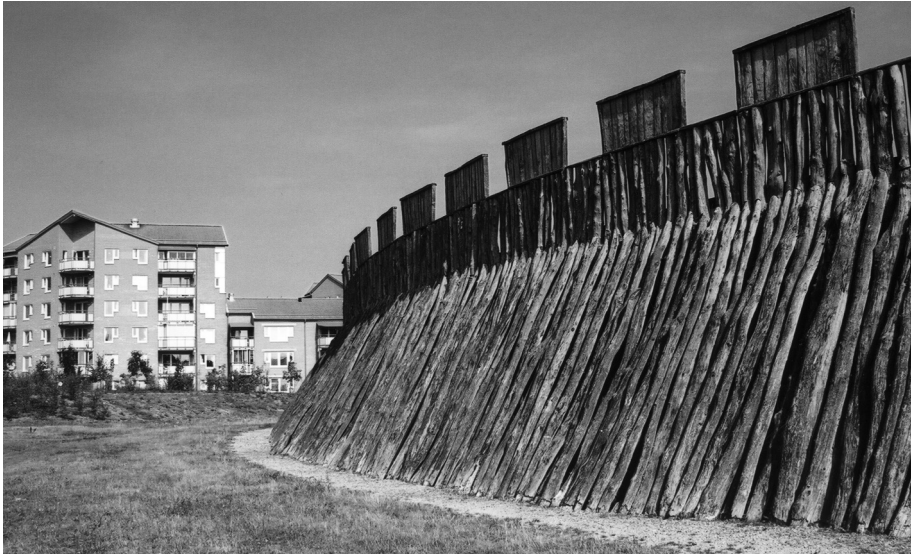
Figur 1. Den rekonstruerade trelleborgen i skånska Trelleborg.

Borgen i Trelleborg är inte en trivial fornlämning, den är ett monument över Skånes historia, och därmed också över dansk och svensk historia. De utgrävda resterna bör liksom de orörda och bevarade resterna, som ännu finns kvar, behandlas därefter.