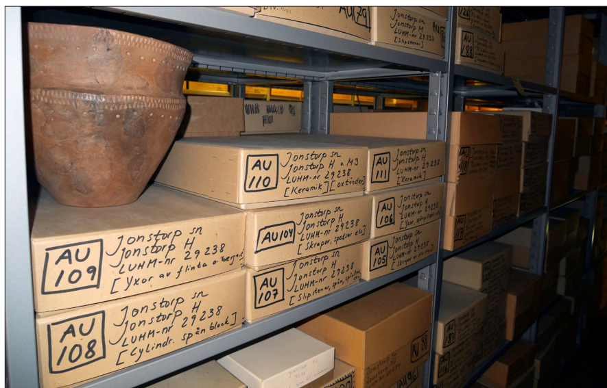
Jonstorksmaterial inför framtida forskningsfrågor. Historiska museets magasin, Lund.