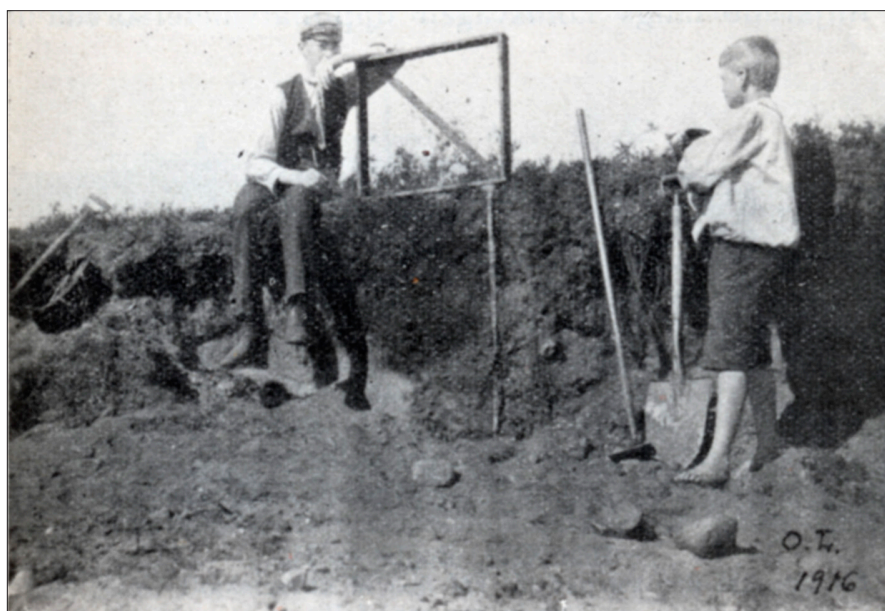
Ur Kullabygd , 1930.