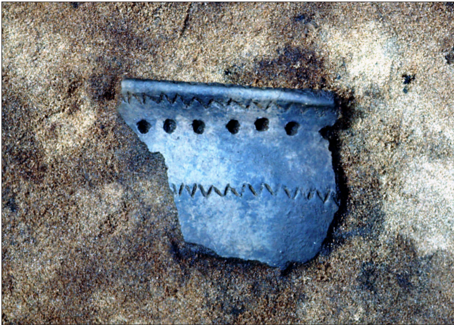
Exempel på gropkeramik.