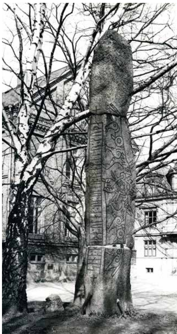
Figur 7. Lundagårdsstenen med sidorna B–C upptecknade. Foto: Erik Moltke, Nationalmuseet 1932.

När inte turister eller familjer till gäststudenter låter sig fotograferas vid runstenarna, fungerar högen i dag som övningsområde för arkeologisk digital dokumentation, som lunchställe, som lekplats vid ”nollning” av nya studenter och som del av Karnevalsområdet vart fjärde år. Ingen inskrift eller skyltning berättar om den ursprungliga tanken med minnesmärket, inget upplyser om den borttagna Lundagårdssten. Många tror, att det reducerade nationalromantiska minnesmärket är en gammal gravhög; illusionen har omsider blivit verklighet.