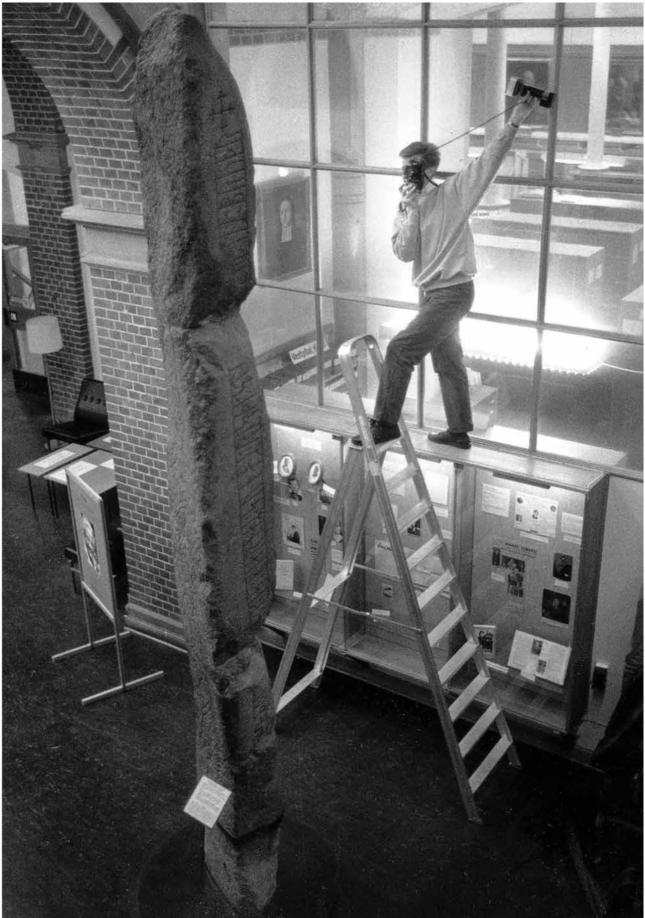
Figur 8. Fotografering av Lundagårdsstenen på Universitetsbiblioteket.