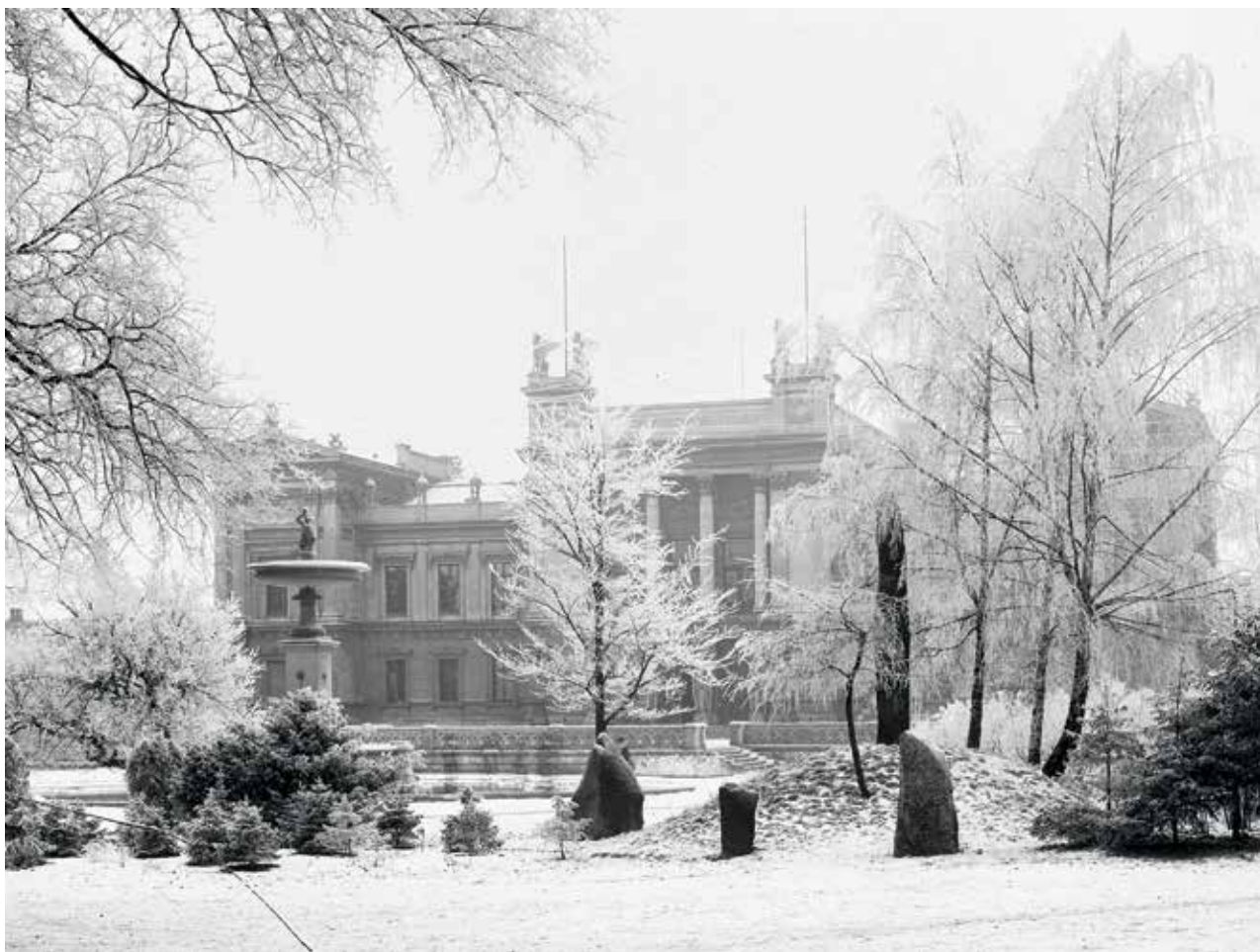
Figur 6. Runstenskullen med Lundagårdsstenen vid Universitetsplatsen.

Runstenshögen uppfördes i en del av Lund, som var i snabb förvandling. 1862 flyttade den Botaniska Trädgården till ett nytt område öster om staden, där den fortfarande ligger, och den gamla trädgården blev park. Samma år som Runstenshögen anlades, inrättades det gamla orangeriet som skulptursal, och en sommarrestaurant tillkom. Och under de följande årtiondena bröts murarna ned norr om Kungshuset; muren i öster längs Sandgatan revs 1878 (den ska inte förväxlas med muren öster om Lundagård, som revs 1842). En ny universitetsplats planerades av arkitekten Helgo Zettervall. Platsen inramades i söder av Kungshuset (åter ombyggt 1877–79), i väster av Universitetshuset (1878–82), i norr av Palaestra et Odeum (1883) som ersatte