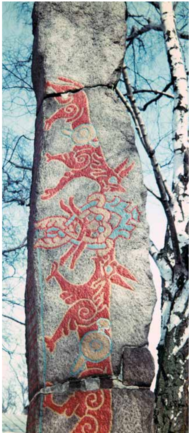
Figur 3. Lundagårdsstenen med uppmålad motiv med mask omgiven av djur. Foto: Ivar Lindquist, Lunds universitetsbibliotek, odatat före flyttningen 1957.

Lundagårdsstenens bilder med två beväpnade vargar på var sida om en mask, två ulfhedningar kring Odin, har flera analogier i den yngre järnåldern. På en bronspatris från