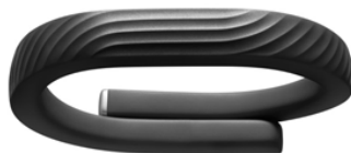
Bild 2. Aktivitetsarmbandet som användes i projektet var Jawbone UP 24.

I pilotprojektet användes en motivationsapp och aktivitetsarmband som heter Jawbone UP24 (se bild 1). Aktivitetsarmbandet bärs av deltagarna och synkroniseras med en applikation (app) som har laddats ner på användarens egen smartphone eller surfplatta. I appen registreras deltagarnas dagliga fysiska aktivitet och sömnmönster, vilket också går att följa över tid 3 . Den fysiska aktiviteten mäts genom antal steg och sömnen mäts genom antal sömntimmar samt antal timmars REM- respektive djupsömn. I appen finns olika funktioner och användaren kan exempelvis ställa in påminnelser, individuella mål, väckning m.m. I appen kan användarna också bilda team och följa varandras resultat samt kommunicera i ett chattforum. I appen finns också även en kostfunktion där användaren kan registrera sitt dagliga matintag. Kostfunktionen valdes i detta projekt bort pga att projektet saknade expertis inom området kostvanor, samt deltagarnas unga ålder och risken för ätstörningar. Notera att de mätningar som aktivitetsarmbandet gör och som sedan visas på den sociala applikationen inte i sig kan göra anspråk på att vara vetenskapliga mätningar om sömn och fysisk aktivitet. Apparna med sammankopplade aktivitetsarmband kommer i det följande benämnas motivationsappar .