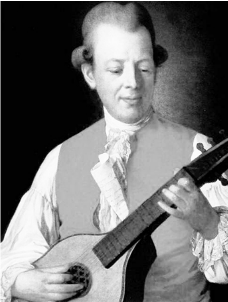
Porträtt av poeten Carl Mikael Bellman 1740-95. Oljemålning av konstnären Per Krafft (den äldre) (1724-1793).