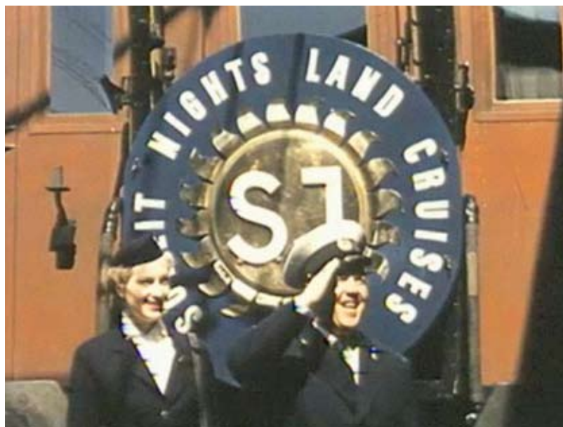
Personalen välkomnar amerikanerna till tågfärden The Sunlit Nights Land Cruises .

tyckta Sverigefilmerna just hette Sweden. The Land with the Sunlit Nights , att den visades upprepade gånger under flera år och att förmodligen även en hel del amerikaner såg filmen, är säkerligen en av förklaringarna till att den tågkryssning med SJ som startade 1950 (och höll på till slutet av 1960-talet) just kom att kallas Sunlit Nights Land Cruises. Ovanstående citat ur Seattletidningen Svenska Pacific Tribunen kunde lika gärna vara en beskrivning av filmen Dollartåget . Att resa i film – och med hjälp av film – var en av de allra första attraktionerna i den tidiga filmen. Bland andra har Pelle Snickars utförligt diskuterat förbindelserna mellan bild, film och resa i sin avhandling Svensk film och visuell masskultur 1900 , och den tidiga filmhistorien överflödar av exempel på olika typer av resefilmer. 13 Tågresa är dock den vanligaste och fantomåkningarna på tåg, kyssar i mörka tågtunnlar och, förstås, tåg som ankommer till stationen hör till de allra vanligaste upptagningarna från filmens födelse och lång tid framöver. 14