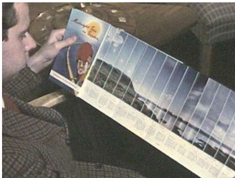
Film som resa. Broschyrerna lockar.

dast till bilderna från Stockholm; därefter spelas antingen svensk folk-musik eller symfonisk musik i det glada och käcka allegrotempo som utmärker ett antal decenniers resefilmer och som i en filmmusikkatalog potentiellt skulle kunna kallas ”resmusik”. Den mer internationella framtoning som ges Sverige och Stockholm genom den smek-samma valsen återkommer inte mer i filmen; efter denna inledning är det så gott som enbart allmoge, natur, förgången tid och föreställd svenskhet som gäller, både bildligt och musikaliskt.