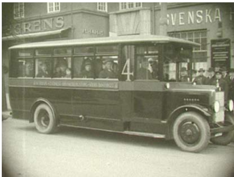
Bild på den nya busslinjen mellan S:t Eriksplan och Södra Bantorget i Stockholm ur Paramountjournalen 1927. Journal 104 (april), en av de 29 Paramountjournaler som lagts ut på filmarkivet.se det första året.

DCP-format från Europe's finest är Ingmar Bergmans Gycklarnas afton (1953). Filmarkivet ställde sin master – vårt inter-positiv – till förfogande, och digitaliseringen skedde vid ett laboratorium i Belgien. I början av filmen finns en scen som är kraftigt överexponerad, en drömsekvens, när Anders Ek går ner till havet för att hämta sin hustru medan en mängd badande militärer hånskrattar åt honom. Vid digitaliseringen ”rättade” man till denna sekvens i ljussättningen, så att den fick samma utseende som resten av filmen. Eller ta dvd-utgåvan av en annan Bergmanfilm, Fängelse från 1949. Filmen börjar med en serie övertoningar. Tittar man på originalmaterialet ser man att dessa övertoningar är skapade via duplikat, som klippts in i originalnegativet. Vid de kopior som togs fram från negativet blev det då ett hopp vid varje skarv; det vill säga bilden skakar till lite grann. På de nya dvd-utgåvorna är det perfekt bildstillestånd i dessa sekvenser. Utan kunskap om ursprungsmaterialet kan man som användare få för sig att filmen ska se ut som den gör på dvd:n.