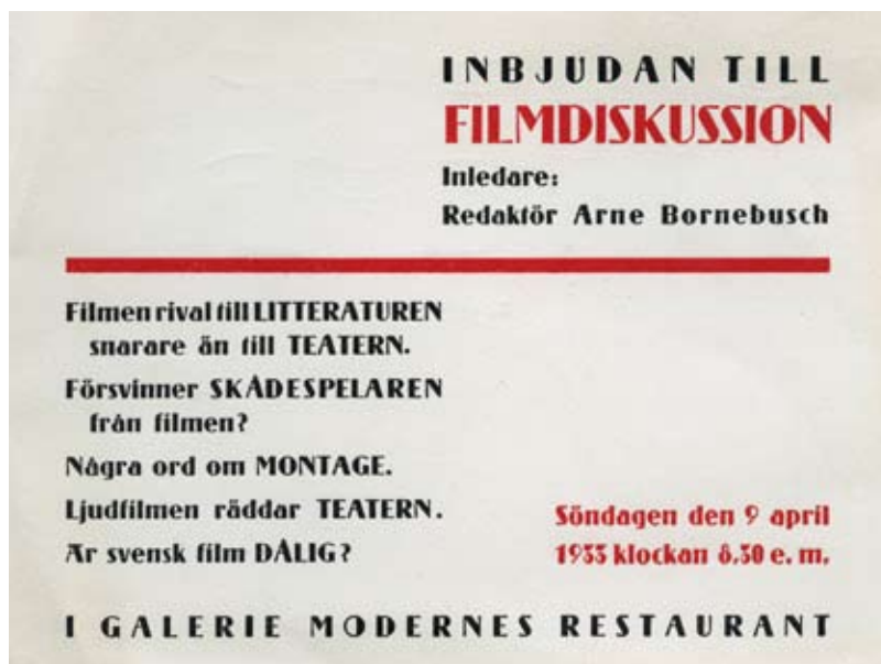
Inbjudan till mötet vid vilket Svenska Filmsamfundet bildades.

veckling: kartor, diagram, filmfotos, affischer, annonser, dräktskisser och dräkter, manuskript, filmmusik, olika typer av kameror, projek-tionsapparater och belysningsattiralj.” 15