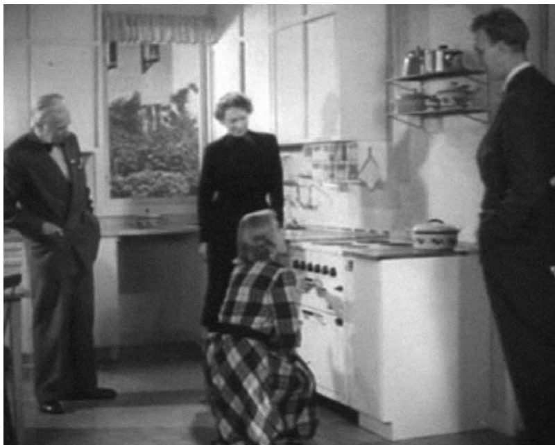
Två generationer, två klasser, ett kök.