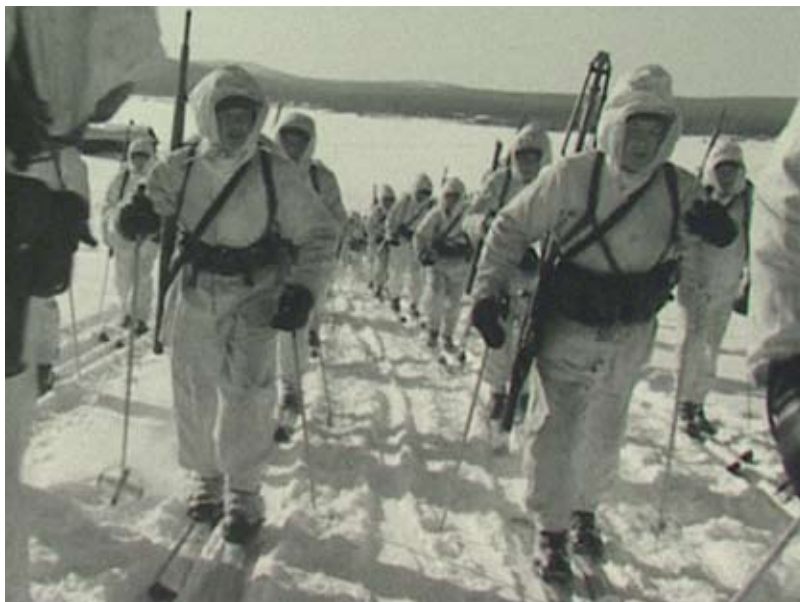
Norska motståndsmän i Sverige under andra världskriget i beställningsfilmen Vi 46,000 (1945), gjord på uppdrag av den norska legationen i Stockholm.

ramen för ordinarie visningsverksamhet, till exempel på Cinemateket, och medvetenheten om att Filmarkivet överhuvudtaget har den här typen av filmer i sina samlingar har därför varit låg. Det har heller inte funnits något intresse från KB, eller tidigare Statens ljud- och bildarkiv, att per automatik överföra dessa filmer till påseendekopior för forskning; detta har endast skett vid de tillfällen då specifika forskarfrågningar om enskilda titlar har inkommit. Man skulle kunna hävda att dessa filmer har väntat på att en ny teknik, en ny plattform, skulle utvecklas och att ett forum som filmarkivet.se skulle ta form. Det är filmer som har ett stort intresse, både för allmänhet och forskare (såväl inom de filmvetenskapliga institutionerna som inom andra discipliner), då filmerna vittnar om Sveriges utveckling från bondesamhälle till modern industristat. Filmer som ger möjlighet att ta del av fler, och annorlunda berättelser om oss själva, vår samtid och vår historia.