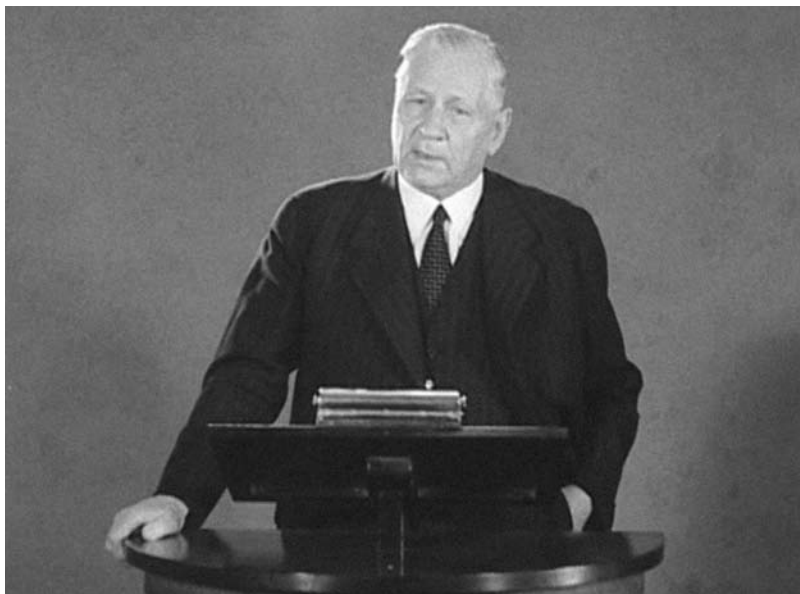
Talarfilm Sigfrid Edström (1940).

land "is very active in the line of sport" och att de tyska militära myndigheterna "favour the sport movement in all the occupied countries". Därefter konstaterar Edström följande: "The war has proven the importance of a strong physical culture in a nation. Only such a nation can be victorious in a modern war. The best means to get a nation with healthy and strong individuals, is through gymnastics and sports. Such a training must begin already in the school age and be kept up into the age of forty." 16