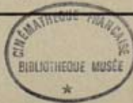
Filmens historia på nätet – digitaliserat häfte av Charles Urban, 1907. Bibliothèque numérique du cinéma (Cinémathèque Française).