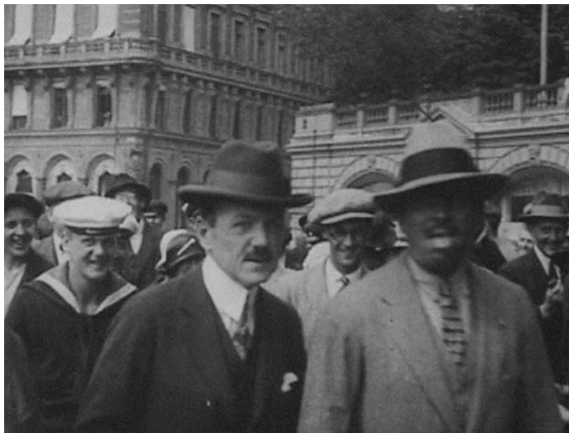
En solbränd Fairbanks.

kets jubel från en balkong på Grand Hôtel, dock utan att filmen visar den jublande folkmassan i ett bild-/motbildsförfarande. Efter dessa inledande bilder flyttas det visuella fokuset till Fairbanks, som antingen han är tillsammans med Pickford eller är ensam, tillåts dominera bildkompositionerna. Nästa bild visar också hur Fairbanks kommer ut från entrén på Grand Hôtel, en vanlig bildkomposition även när det gäller kungligheter. Den bildkompositionen medverkar till att enbart visa den officiella sidan, eftersom det mer ”privata” bokstavligen befinner sig och stannar kvar inuti hotellet (eller slottet) dit kameran och åskådarna oftast inte har tillträde. Förfarandet kan exempelvis vid upprepade tillfällen observeras i journalfilmen Trekungamötet i Malmö (1914). I Mary och Doug besöker Stockholm följer dock kameran, och en del nyfikna betraktare utanför, efter Fairbanks. Därefter följer ett kollage av bilder från bilutflykten till landsbygden utanför Stockholm och från avfärden med Kreugers båt till Kanholmen där det ”privata” tillåts lysa igenom. Ett exempel på det är sekvensen då Fairbanks står på en brygga och pratar och röker tillsammans med en man medan kameran registrerar detta på behörigt avstånd. Filmen avslutas med en återgång till det officiella konceptet med bilder där paret anländer i feststass med bil och går uppför en trappa till SF-banketten, samt avslut-