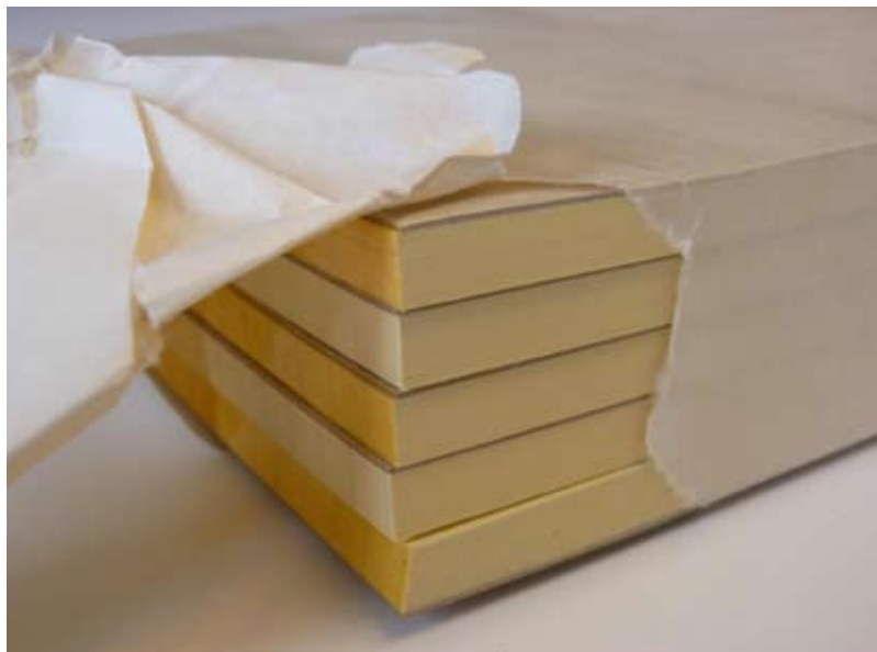
Anteckningsböcker i Ingmar Bergmans Arkiv.

I ett längre perspektiv kommer inte filmen att kunna finnas kvar. Också under bästa tänkbara villkor (inklusive att aldrig visas), kommer en filmkopia att ha en förväntad livstid på hundra, eller kanske några hundra år. Livslängden för nitrat är sannolikt kortare, för acetat ännu kortare, och för polyester – förhoppningsvis, men vem vet? – lite längre. Tar vi också den organiska sammansättningen av emulsionen med i beräkningen är prognosen ännu sämre. Det skall jämföras med en lerkruka eller en papperslapp, som kan hålla i årtusenden.