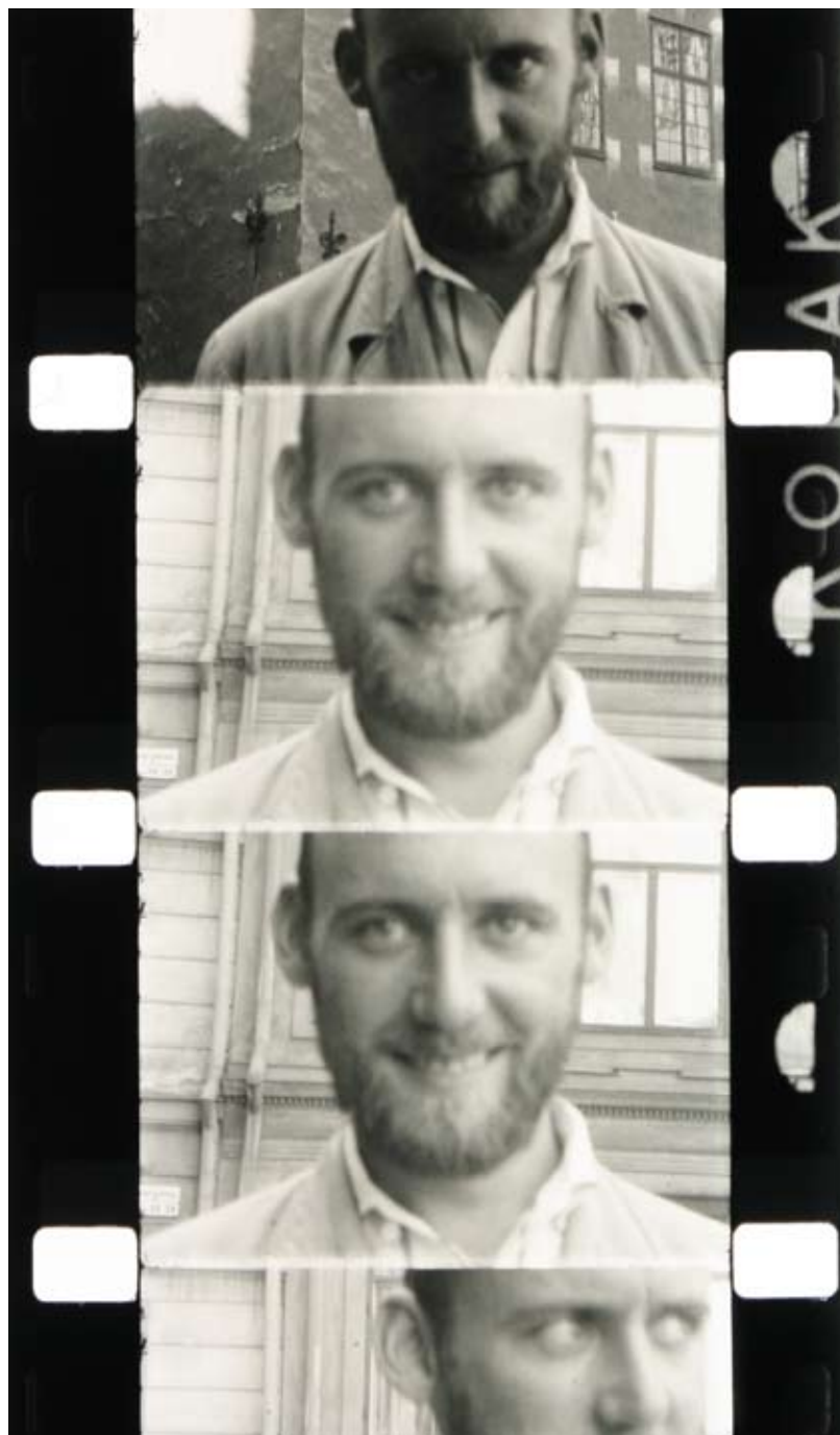
Hans Nordenström, 1927–2004, filmfragment utan titel (odat.)