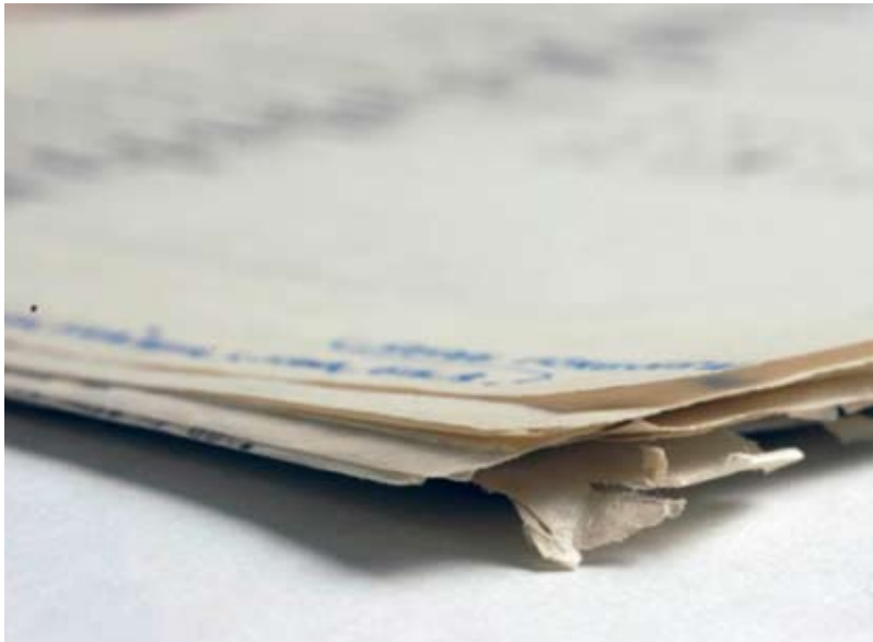
Manuskript till pjäsen "Kaspers död" (1941). Ingmar Bergmans Arkiv.

Den institution där jag själv arbetar, Ingmar Bergmans Arkiv, bevarar bland annat handskrivna manuskript, maskinskrivna regimanus, anteckningsblock, brev, med mera. Med andra ord: nästan uteslutande papper. Är då Ingmar Bergmans Arkiv ett filmarkiv? Papperslappar är uppenbarligen inte film. Men vad är det då?