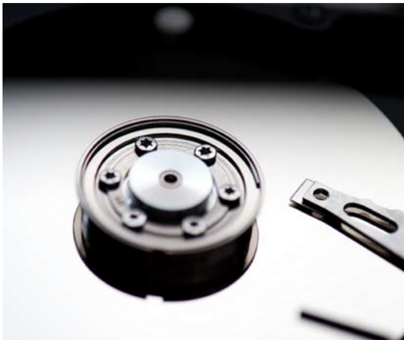
Härddisken – det digitala filmarkivets materiella bas.

omvandlas till maskinkod. Utan att behöva förstå kodens mening kan den kopieras hit och dit, och återställer man sedan fil-suffixet till .jpg ser bilden ut därefter. Samma sak gäller en mp3-fil eller en .mov-fil, och i princip kan kod förändra all slags media. Omvänt är alla digitala medier uppbyggda av kod. Den konceptuella förståelsen av digitala filmarkiv bör därför ta sin utgångspunkt i det medialt specifika; film och kod är inte samma sak – filmen är platt och koden är djup, för att parafrasera N. Kathryn Hayles. 11