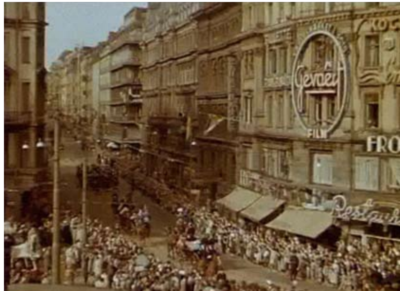
Gevaertskylten i neon på Bångska Palatset tronar över den kungliga kortegen.

Detta var alls inte någon ovanlig strategi för SF eller filmbranschen överlag. Tvärtom kan man till stor del likna journalfilmngenren vid ett veckovis återkommande reklamfönster mot omvärlden, vars sannfärdigt ambitiösa reportage kompletterade filmbolagens gängse spelfilms-