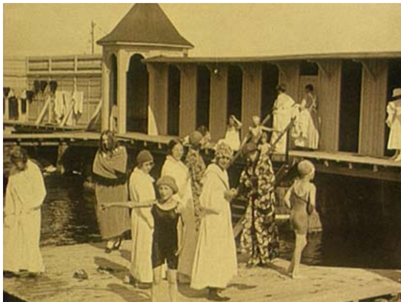
Bilder från Lysekil (1923) – en av de många stadsfilmer som nu funnit en publik via filmarkivet.se

Bilden av att kort- och dokumentärfilm utgör en väsentlig del av Filmarkivets verksamhet blir än mer tydlig om man studerar statistiken för den aktiva omkopieringen och restaureringen som bedrivs. Sedan början av 1980-talet har det varit ett särskilt fokus på omkopiering och restaurering av denna typ av film, framför allt från nitratfilmsperioden, det vill säga under 1900-talets första hälft. Bara under den senaste femårsperioden, 2006 till 2010, har 86 kort- och dokumentärfilmer omkopierats och restaurerats så att de är långsiktigt bevarade och kan tillgängliggöras på bästa sätt. Denna siffra utgör 65 procent av det totala antalet restaureringar/omkopieringar som gjorts under denna tid. Under samma period har 47 spelfilmer varit föremål för omkopieringar; oftast har det i dessa fall inte varit fråga om restaurering utan framställandet av nya kopior från befintligt original- eller bevarandematerial i samband med att visningskopior slitits ut.