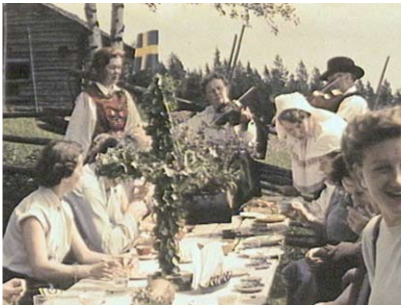
Svenskhetssymboler i överflöd.