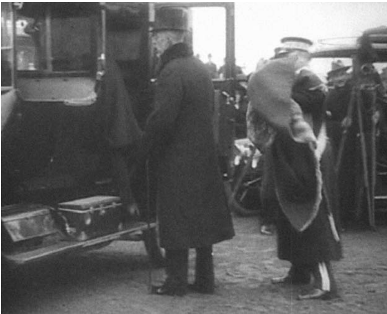
Fairbanks på väg ut ur en bil – och Gustaf V på väg in i en bil.