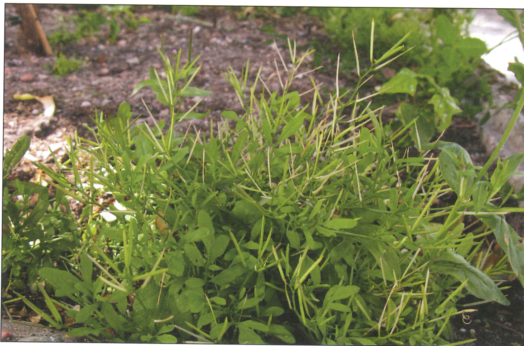
Risbräsma Cardamine occulta i planteringskärl i Luthagen, Uppsala 6 juli 2017.