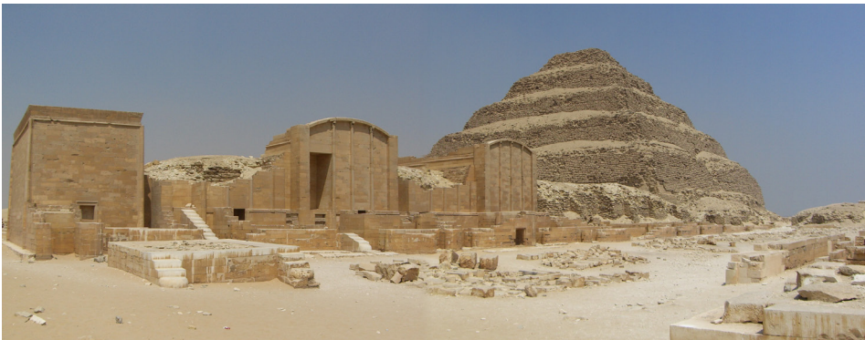
Bild 1. Heb-Sed-gården i anslutning till Djosers pyramid. Lägg märke till podiet och till paviljongerna menade för de tillresta gudarna. Saqqara ca. 2700 f.Kr.

Efter färdigställandet av den arkitektoniska ramen följde reningsriter, fem dagars fackel-illuminering av det nybyggda. Sedan följde de båtburna gudarnas ankomst med sina följen av höga dignitärer. Jubilarerna och hans uppvaktning mötte de mest betydelsefulla av dem vid flodhamnen. Troligen hade enklare undersåtar möjlighet att vara med under den här delen av ceremonin och se processionen innan den gjorde sitt intåg på det egentliga jubileumsområdet. Där inne var sällskapet säkert mycket mer exklusivt. Ålderdomliga äretitlar delades ut. Gåvor gavs till gudarna som hade förts till sina provisoriska jubileumspaviljonger där det var kungens uppgift att besöka dem. Sådana besök och processioner fortsatte sedan under ytterligare tre dagar. Jubileumsriten, kungens kraftprov, bestod i att i snabbt tempo (språngmarsch eller ”dans”) röra sig över jubileumsgården och mellan de olika helgedomarna i en rit som symboliserade faraos herravälde över hela Egypten, samtidigt som det gav prov på hans fysiska styrka. Kungen, klädd i en kort kilt med en oxsvans baktill (Svansens fest var ett annat namn på Heb-Sed-jubileet), upprepade rörelsen två gånger, en gång med Övre och Nedre Egyptens regalier i form av olika kronor. Till sist utropades kungens makt av två sångare som stod på var sin sida om