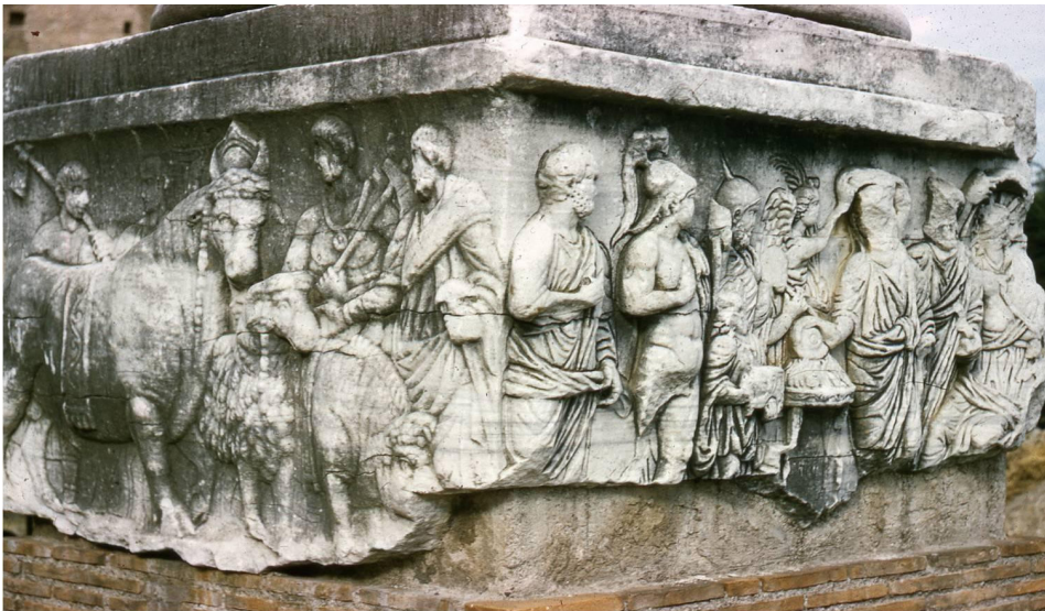
Bild 2. Decennalia-basen på Forum Romanum. Snedperspektivet tillåter att vi ser både offerprocessonen och offerritualen med kejsaren i centrum. Rom 303 e.Kr.

Detaljerad kunskap om rit och utförande nämns däremot inte i Dios text. En annan samtida, Herodianus, ägnar två rader i sin Historia åt Septimius Severus fest (Herodianus 3.10.1–2). Trots den kortfattade behandlingen är hans omnämnande mer balanserat än Dios. Penningutdelningen och spelen omtalas förvisso, men här nämns också religiösa ceremonier och offer. Decennaliet måste ha innehållit både tacksägelse och nya högtidliga löften, vota , inför den kommande 10-årsperioden. Något närmare den delen av jubileumsceremonin kan vi komma med hjälp av den så kallade Decennalia-basen, en fyrsidig, monumental kolonnbas med inskrift på en sida och bildframställningar på de övriga