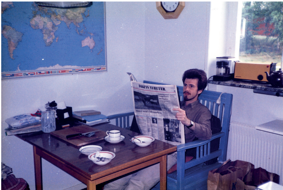
Stockholm, juli 1985.