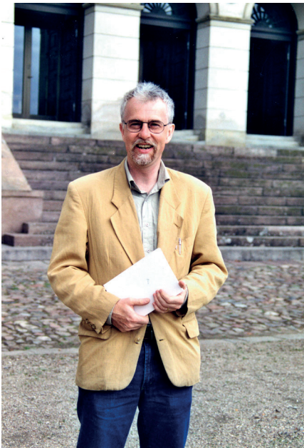
Danmark, sommaren 2000. Foto: privat.

Vi redaktörer har valt att ordna bidragen i fyra sektioner som på var sitt sätt åskådliggör det fruktbara i att använda sig av nordiska perspektiv. I det första, Vad är det nordiska? , samlas fördjupande resonemang om värdet av en nordisk blick samt de skiftande föreställningar som har funnits kring Norden och det nordiska. I det andra, Nordiska komparationer , förs metodologiska diskussioner kring hur nordiska jämförelser är särskilt väl lämpade för att belysa specifika fält och forskningsfrågor. I det tredje, Möten och identiteter , återfinns texter som analyserar nordiska sammankomster och hur olika identiteter har samspelat med varandra. I det fjärde, Norden i Europa , lyfts den geografiska blicken för att visa på hur Norden kan förstås som en europeisk region. Samtliga teman har utgjort viktiga spår i Haralds egen forskning och i det följande ska bidragen kortfattat presenteras.