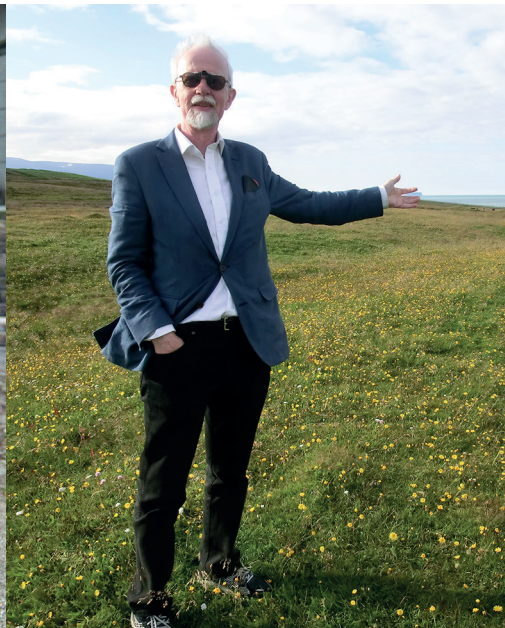
Island, sommaren 2016.