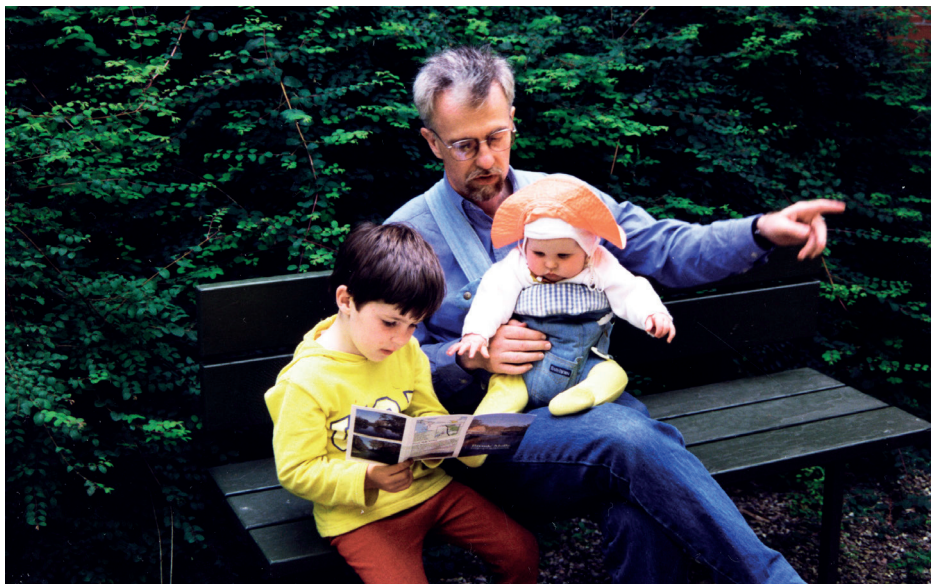
Danmark, sommaren 1998.