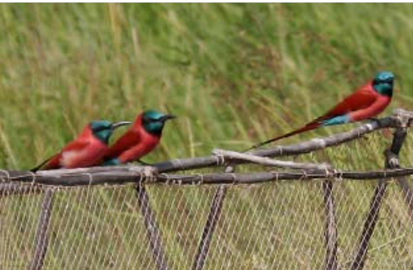
Northern Carmine Bee-eater Merops nubicus.

Floden kröker kraftigt, och när den rätat ut sig ser vi tre unga fulanikillar som försöker få sin boskap över floden. De manar på med rop och sina käppar och till slut går djuren i och börjar simma.