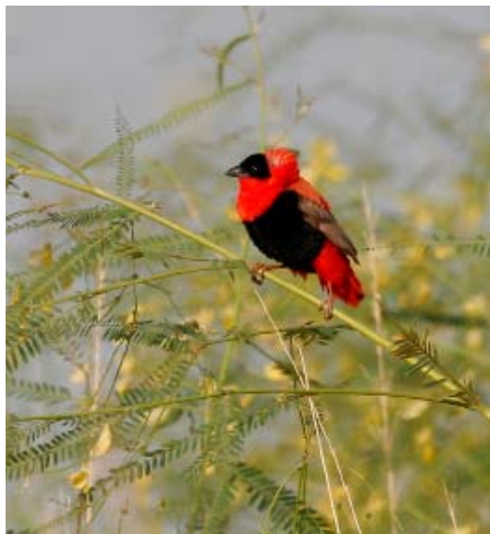
Northern Red Bishop Euplectes franciscanus.

I Nigerdeltat finns även översvämningsskogar. En stor del av dem har idag avverkats eller förstörts på grund av för lågt vattenstånd. Skogarna har stor betydelse för de kolonihäckande hägrarna, och vid en inventering 1987 konstaterades att endast sex av de 25 sedan tidigare kända kolonierna fanns kvar. Totalt noterades här 87 000 häckande fågelpar av 15 olika arter, främst långstjärtade skarvar, ko- och ägretthägrar (Beintema 2005, Skinner 1987). En av dessa översvämningsskogar heter Akkagou och ligger i Lac Debos nord-västra del. Under kvällen glider vår båt ljudlöst fram i trädtoppshöjd genom just denna skog och vi upptäcker gott om övervintran-de sångare, framförallt sävsångare, men även många macciasångare och törnsångare samt några iberiska gransångare. Vi får även syn på en African Pygmy Goose. Ett hundratal gamla hägerbon vittnar om att kolonin sett sina bästa dagar, men den verkar fortfarande fungera som övernattningsplats. Så fort solen försvunnit under ho-risonten, flyger tusentalet hägrar av totalt åtta arter in från alla håll, främst ko-, silkes- och purpurhägrar, men även en grönhäger och tre