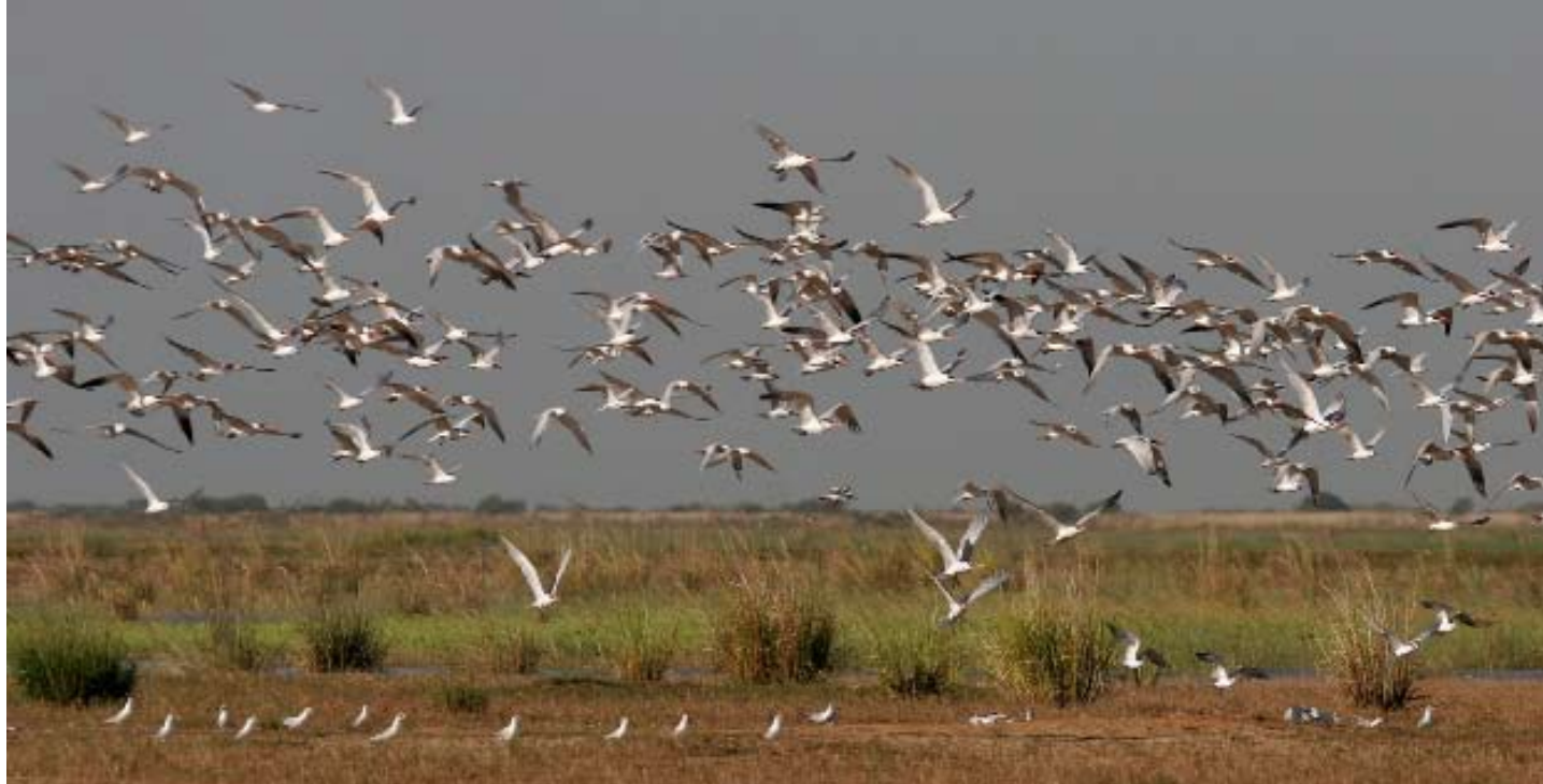
Skräntärnor Hydroprogne caspia och sandtärnor Gelocheilidon nilotica i Nigerflodens inlandsdelta.

resa genom Nigerflodens inre delta. Under vår Afrikatripp, som tidigare innefattat tre veckor i Senegal, försökte vi bland annat kartlägga förekomsten av övervintrande bruna kärrhökar (läs mer i Vår Fågelvärld 66(4):8–13). Även i Nigerdeltat gjorde vi räkningar och totalt noterades nära 1 000 fåglar längs vår transekt på cirka 35 mil (2,9 fåglar/km i snitt), med flera fina nattplatser där hundratals fåglar samlades i skymningen tillsammans med mindre antal ängshökar.