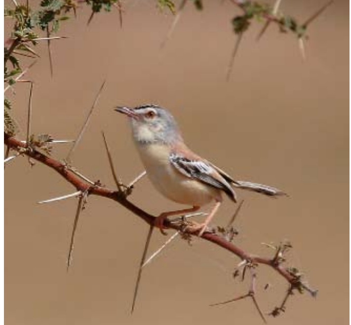
Sahelångare Spiloptila clamans.

Färden fortsätter genom ett par vida flodkrökar och regelbundet passerar vi små byar helt byggda i lera. De låga husen med runda former ligger tätt sammanpackade och i mitten av byn, en stor moské även den helt i lera, likt ett gigantiskt sandslott med torn och tinnar. Vi möter överlastade båtar, deltats morsvarighet till vår kollektivtrafik, som ser ut att kunna kantra bara en passagerare skulle råka hosta. Män i små båtar lägger ut nät och på stranden springer byns barn ut för att vinka. De tillhör Bozofolket som är deltats fiskare. När det är högvatten, vilket det var när vi besökte området i november 2006, bor de flesta i byarna eller på stora båtar i deltats