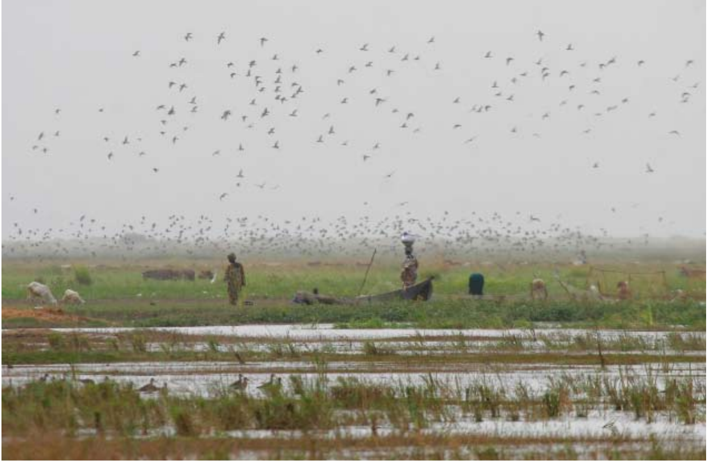
Fåglar och människor trängs allt mera i Nigerflodens inlandsdelta.