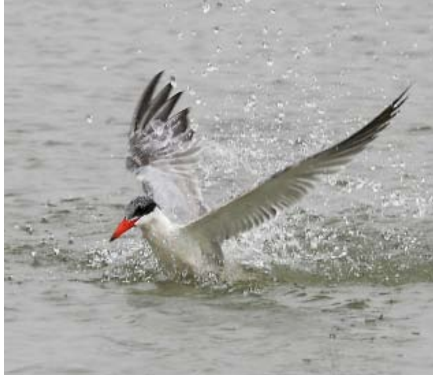
Skrântärna Hydroprogne caspia.

Så länge vattenståndet är högt under hösten och förvintern klarar de utspridda tärnorna sig troligen bra. I takt med att vattnet sjunker längre fram under vintern trängs både fåglarna och deltats befolkning ihop i sjöarna i norr och skrântärnorna blir då ett lättare byte. De flesta av de svenska skrântärnorna har fångats med betad krok eller skjutits, och de är tillsammans med stora vadare och änder ett välkommet tillskott i en annars fiskdominerad diet. Troligen är jakt och fångst i vinterkvarteren ett av de huvudsakliga hoten mot våra skrântärnor, och tendensen med allt lägre vintervattenstånd och en växande befolkning i deltat minskar överlevnadschanserna för fåglarna.