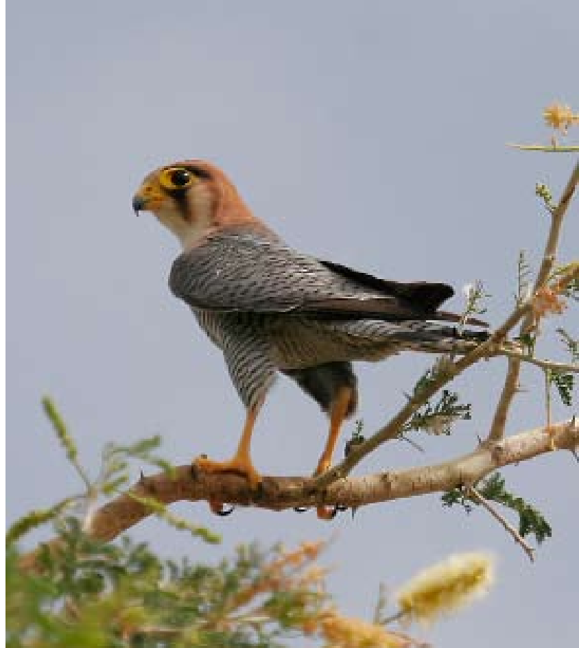
Rödhuvad falk Falco chicquera. Antalet rovfåglar har minskat mycket kraftigt i Västafrika de senaste 30 åren.

Resultatet av studien är nedslående. Värst är situationen för gamarna som minskat med 98% utanför de skyddade områdena. Fyra örnarter (Brown Snake Eagle, Beaudouin's Snake Eagle, African Hawk Eagle och savannörn) har minskat med 86–93% och sju örnarter påträffades överhuvudtaget inte längre utanför de skyddade områdena, bland dem gycklarörn som vid inventeringen 30 år tidigare var vanligt förekommande. Inom reservaten hade bara tre örnarter minskat. Likaså höll glador, duvhökar, små falkar och vråkar ställningarna inom de skyddade områdena medan de hade gått starkt tillbaka utanför. Bland de övervintrande fåglarna hade ängshök och stäpphök gått tillbaka markant (med 73% utanför reservaten och 56% innanför), medan dvärgörn och brun kärrhök skiljde ut sig från de övriga genom att de låg på samma nivå som för 30 år sedan. Även bland de övriga fåglarna i studien är resultatet utanför de skyddade områdena alarmerande. Flera arter verkar i det närmaste vara utrotade. Exempelvis noterades inte en enda struts, Abyssinian Ground-Hornbill eller hjälmpärllhöna. Endast en trapp noterades jämfört med 35 ex. 30 år tidigare. Inom de skyddade områdena noterades en svag tillbakagång för de olika arterna.