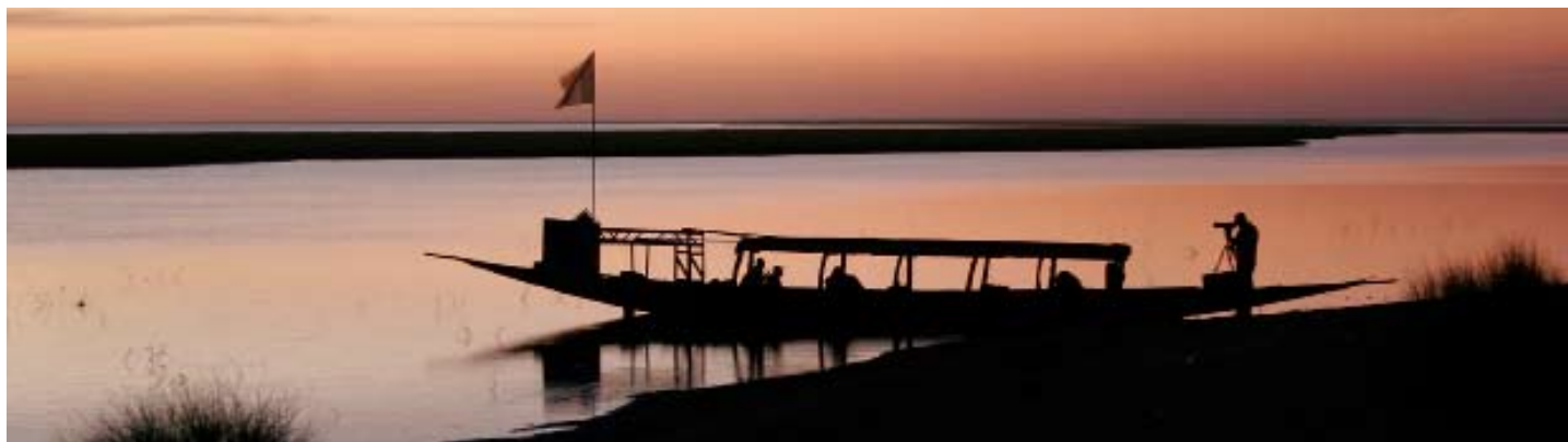
Kvällspan vid Nigerfloden.

Den bruna kärrhökens positiva utveckling visade sig även vid vår