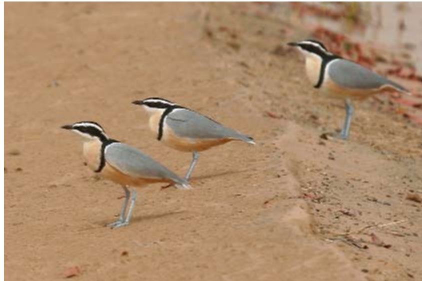
Krokodilväktare Pluvianus aegyptius.