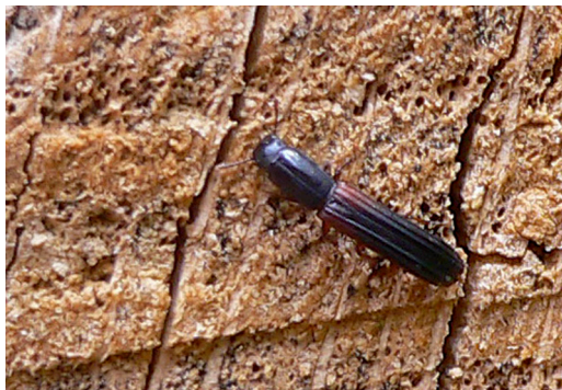
Figur 3. Colydiium filiforme en av de starkt hotade arter som lever kvar på en av sina få svenska lokaler i Strömsrum.

Colydiium filiforme one of the endangered beetles still living at Strömsrum in one of its few remaining sites in Sweden.