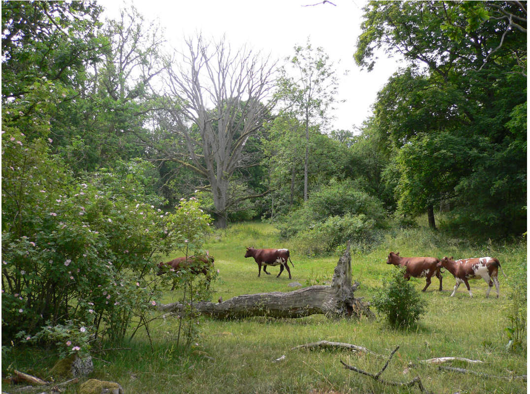
Figur 1. Nötbetad hagmark med gamla ekar, stående döda ekar, eklågor och blommande buskar i Strömsrum, en naturtyp med många hotade arter.

Pasture with old living oaks, standing dead oaks, downed oak logs and flowering shrubs at Strömsrum, a habitat type with many threatened species.