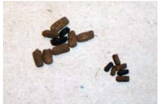
Figur 2. Spillning av läderbagge (vänster) och en guldbagge-art (höger). Läderbaggespillning är större och plattad, till skillnad från guldbaggar som har mindre, mer cylindrisk spillning. Yngre larver av läderbagge lämnar mindre spillning som är svårskild från spillning av Gnorimus -arter, varför man bör leta efter fullväxta larvers spillning som är 6-7 mm lång.

fragment från läderbaggar som förmodligen har legat länge i träden (Oddvar Hansen pers. medd.). Finland hyser en enda population utanför Åbo (Landvik 2000), medan läderbaggen i Danmark förekommer på ett tiotal små lokaler (Martin 1993). På den svenska rödlistan är läderbaggen placerad i hotkategorin VU (Sårbar) (Gärdenfors 2000). Läderbaggen har fått hög prioritet i EU:s habitatdirektiv (Luce 1996) och fungerar bra som indikatorart för skyddsvärda områden, eftersom den främst förekommer i halvöppna miljöer med gamla ädellövträd, som generellt är en mycket artrik miljö. När man jämfört lokaler med ihåliga ekar har det visat sig att det finns flera hålträdslevande skalbaggar där läderbaggen finns än i områden där läderbaggen saknas (Ranius 2002a). Läderbaggen har av dessa anledningar under de senaste åren varit föremål för ett omfattande skyddsarbete inom ett Life-projekt "Bevarandet av läderbaggen ( Osmoderma eremita ) och dess habitat i Sverige" (Antonsson 1999). Inom detta projekt har också ett åtgärdsprogram för arten utarbetats (Antonsson 2001).