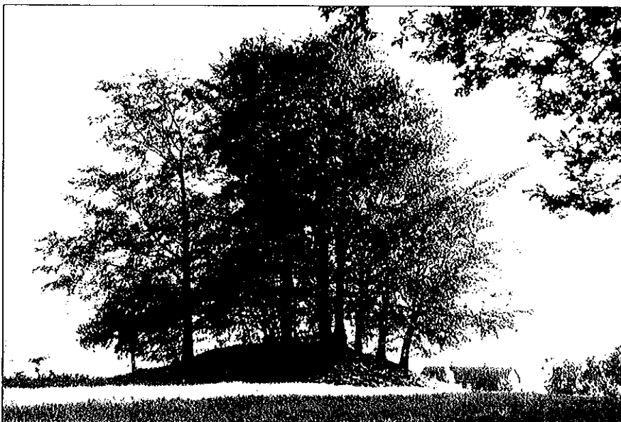
Bronsåldershög nära berget.

Jag önskar lära känna de olika frånvaranden dvs mänskliga spår som inte finns kvar längre i det landskap som finns just nu. Det är så mycket som inte finns närvarande i vårt nuvarande landskap. Kullabygden i nordvästra Skåne betraktas ofta av arkeologer som ett marginalområde. Området har i verkligheten en egenart i förhållande till vad vi känner till från andra delar av Sydsverige. Visar egenarten på en reell förhistorisk situation som beror på de speciella egenskaper och förutsättningar som området har?