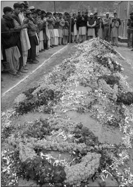
Massgrav över döda skolelever i Balakot.