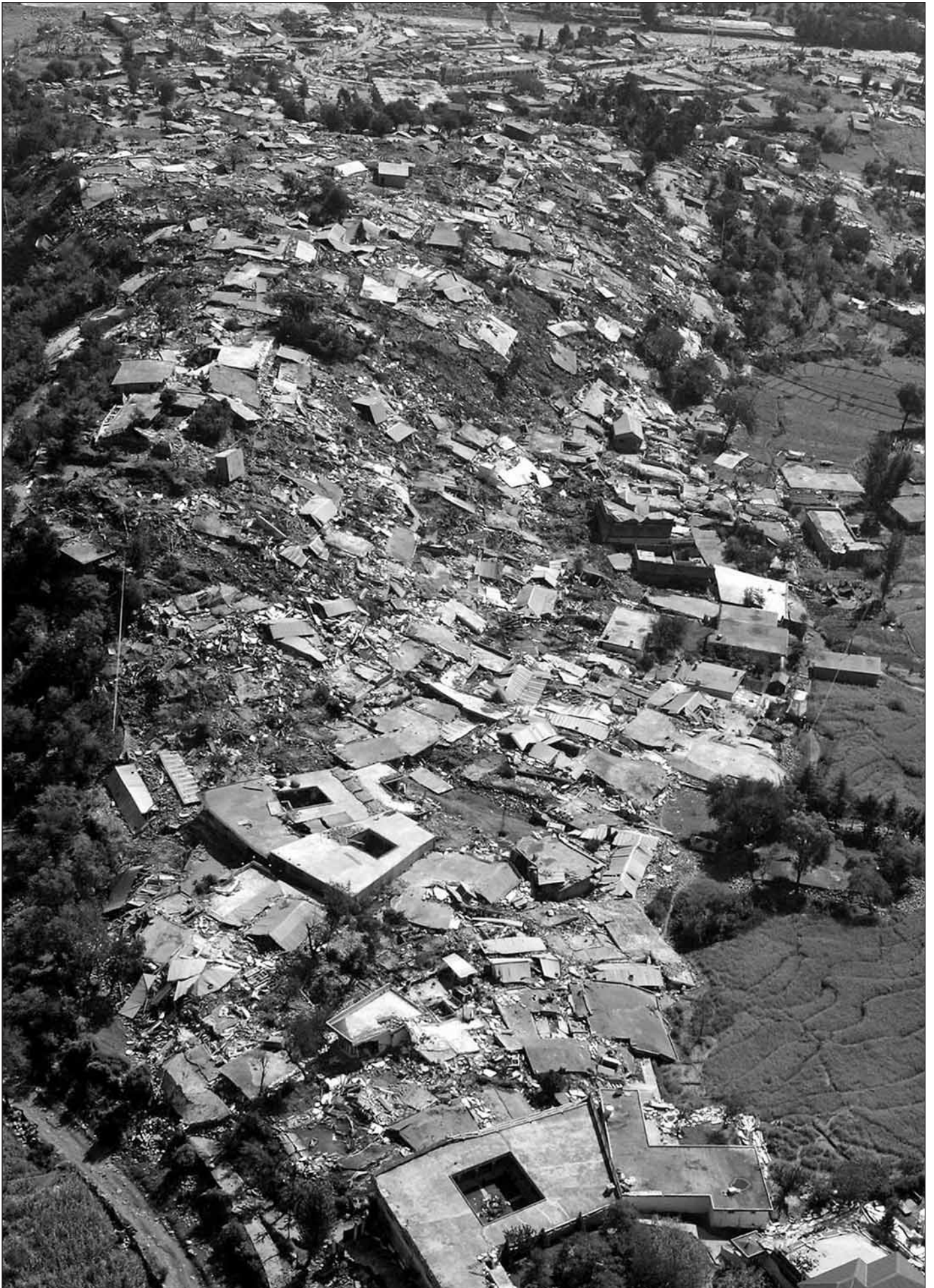
Flygbild över totalförstörda staden Balakot ett par dagar efter jordbävningen.