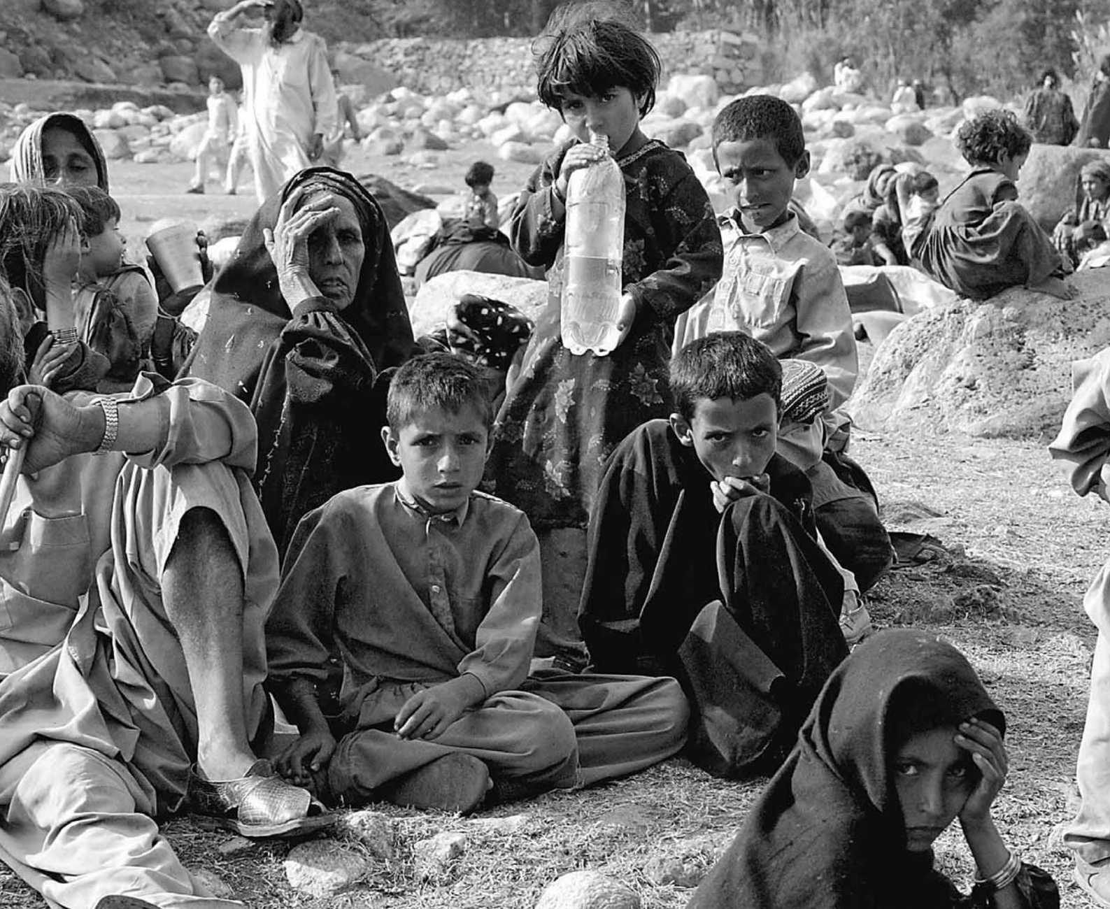
...na efter sitt ödelagda hem i Balakot.