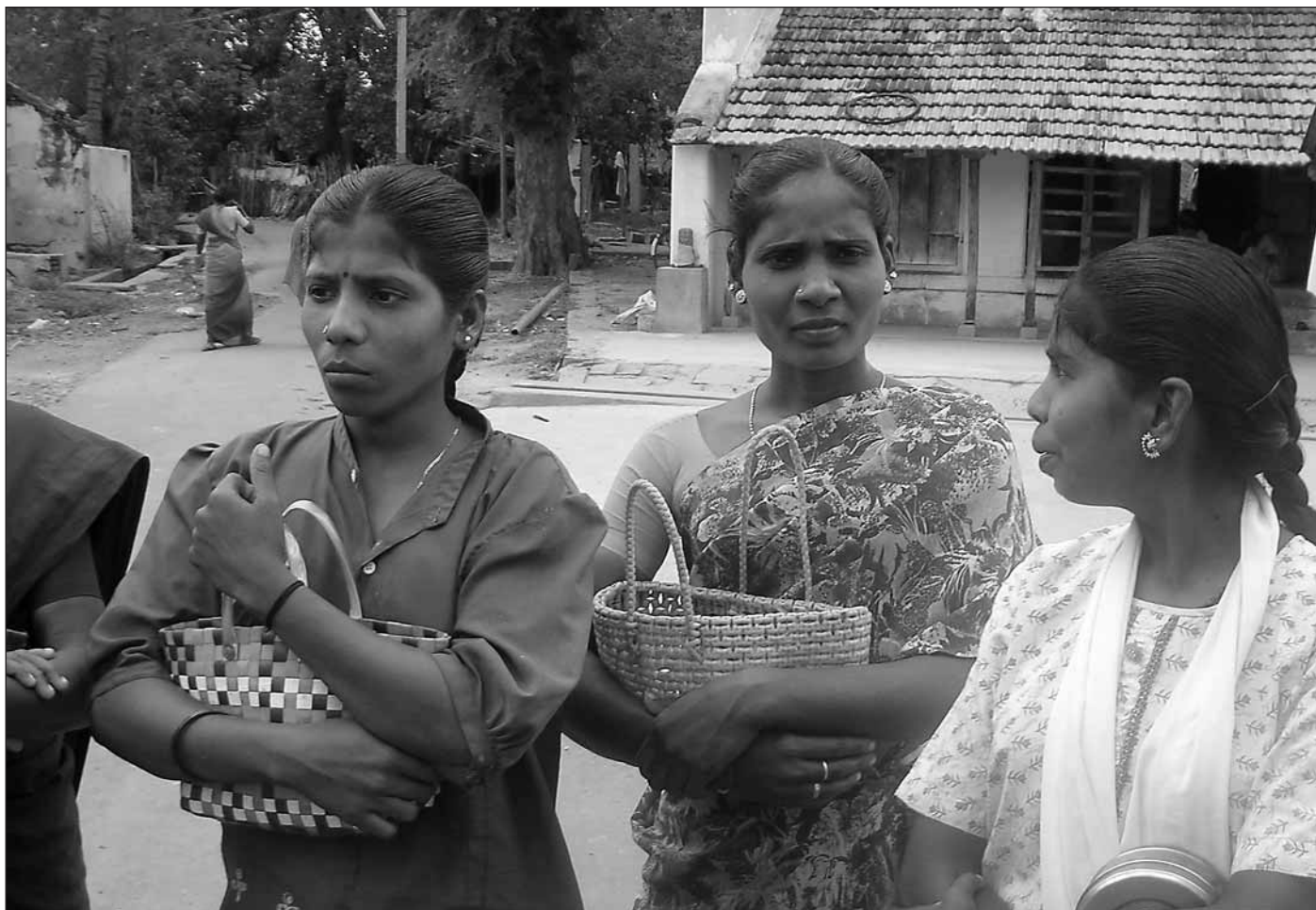
Tre unga dalitkvinnor på väg till eftermiddagsskiftet på fabriken.

blir nyfikna när vi berättar att vi kommit tillbaka efter 25 år.