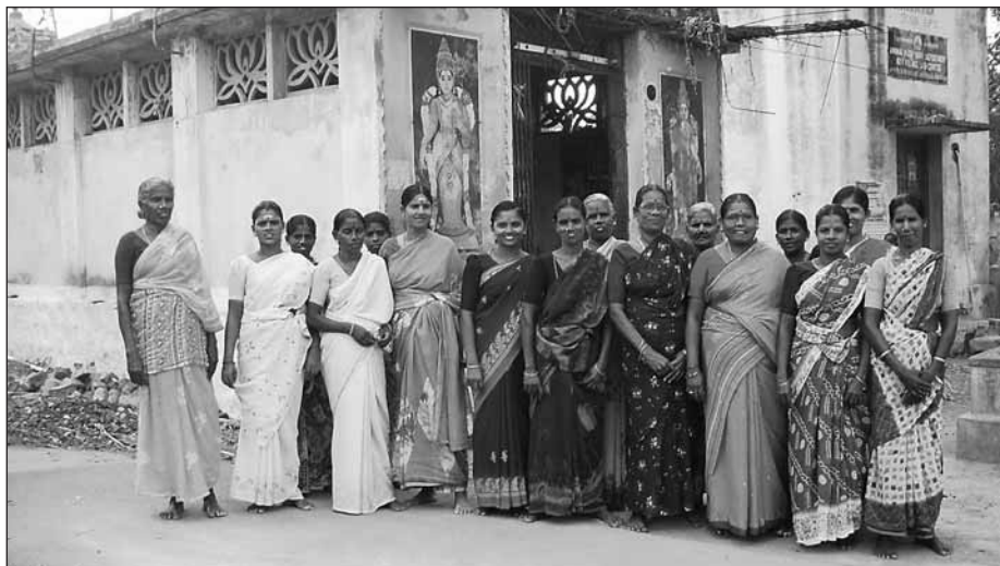
Medlemmarna i spargruppen Tamarai (Lotus) utanför Mariammatemplet i Poyyamani där de brukar ha möten.

Det var en offentligt planerad och organiserad utvecklingspolitik. I många områ-