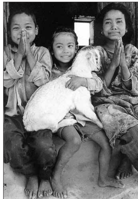
Tibetanska flyktningbarn i Nepal.