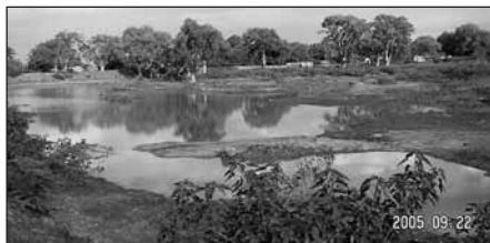
När det regnar fylls denna damm med vatten som sedan leds ut på fälten.

Det här fungerar! Det finns många spargrupper i våra byar. De lånar till mjölkkor, symaskiner, maskiner för att slipa halvådelstenar, till att starta en affär eller ett kafé. De betalar tillbaka sina lån och de lånar mer. Familjernas ekonomi förbättras.