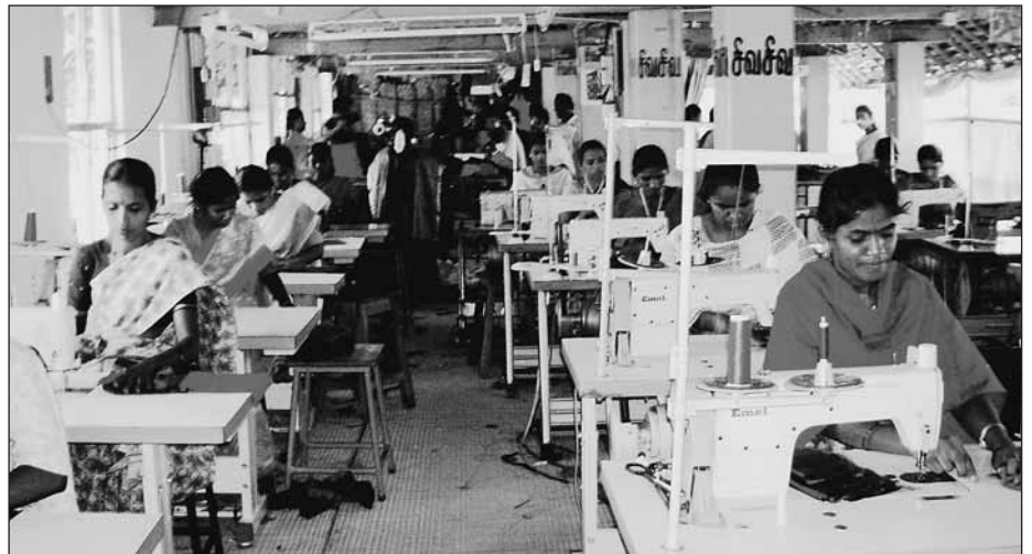
En godsägare har satt upp en syverkstad med femtio anställda i en av våra byar.