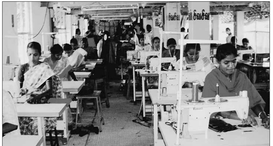
En godsägarson har satt upp en syverkstad med femtio anställda i en av våra byar.