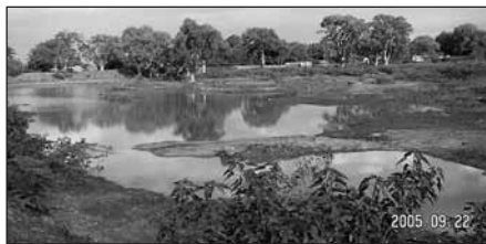
När det regnar fylls denna damm med vatten som sedan leds ut på fälten.

Det här fungerar! Det finns många spargrupper i våra byar. De lånar till mjölkkor, symaskiner, maskiner för att slipa halvådelstenar, till att starta en affär eller ett kafé. De betalar tillbaka sina lån och de lånar mer. Familjernas ekonomi förbättras.