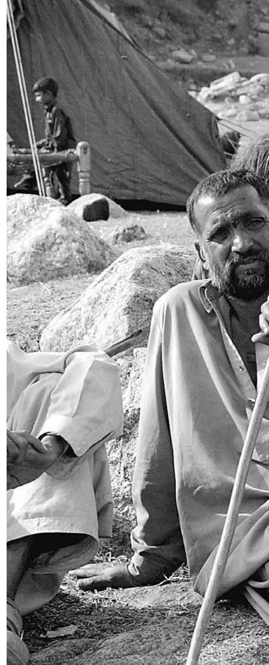
Överlevande efter jordbävningen sitter i spillror

– Vi har designen klar, nu gäller det att