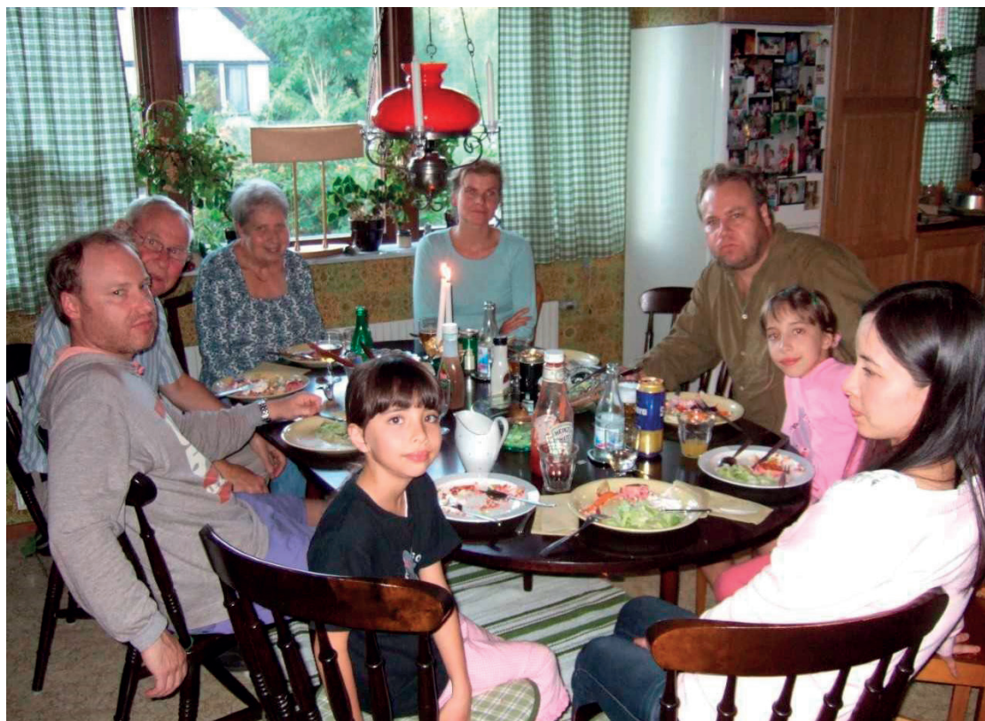
Familjemåltiden så som vi önskar att den alltid vore. Glädje och gemenskap över generationsgränser.

tillsammans med grannar här på Norrby senior. Det är ofta en känsla av ensamhet i mina morgon- och kvällsmål i bostaden” (M27445).