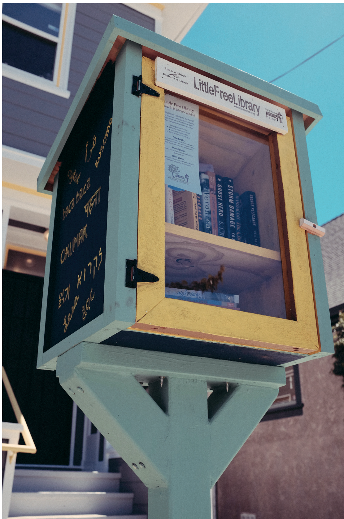
Biblioteket mitt i grannskapet.