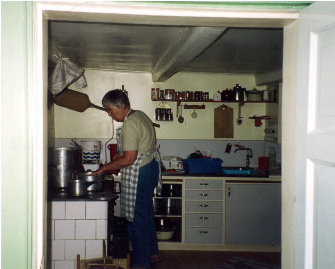
Medan måltider förväntas vara gemensamma, har matlagningen ofta varit en ensam syssla, vilket också märks i köksinredningen. Det är sällan enkelt att vara mer än en person vid spisen.

ningens mening konstaterat att ”cooks want to cook alone” (Short 2006). Även om många vill att matlagning som hushållsarbete ska delas mellan medlemmarna i hushållet, innebär det inte nödvändigtvis att flera ska laga mat tillsammans. Makarna kan ta ansvar för olika måltider, det gäller även för större barn i hushållet som kan ta ansvar för vissa måltider i veckan. Också i fall där flera faktiskt är aktiva samtidigt i förberedandet av en måltid, innebär inte detta nödvändigtvis gemensam matlagning. Det finns en tydlig distinktion mellan att ”laga mat” och att ”hjälpa till”. Att duka och diska kan förvisso avfärdas som arbete som inte innefattar direkt matlagning, men även potatisskalning och att ordna sallad hänförs regelmässigt till kategorin ”hjälpa till”. Varför har det då varit så viktigt för den som haft ansvar för hushållet att betona att det är ”min” matlagning?