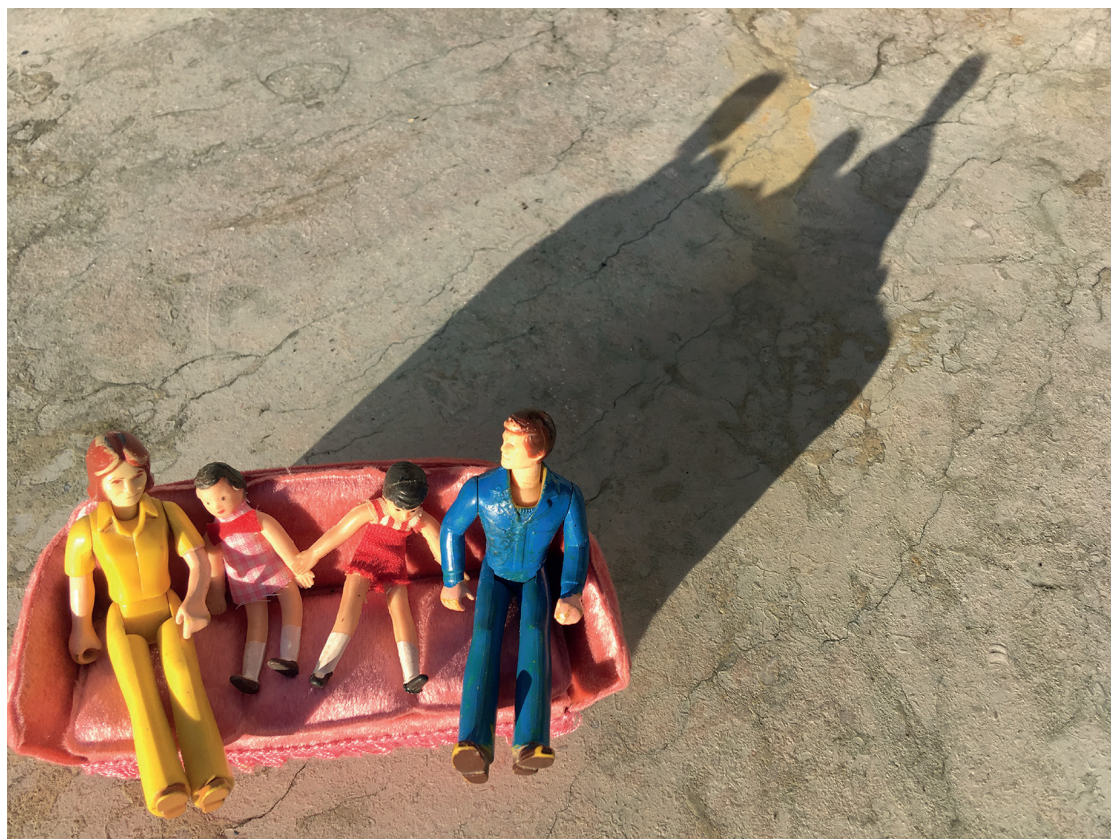
Hemmet är fyllt med verktyg för att skapa ”mitt” eller ”vårt” – soffor, skrymslen, läs, köksbord och mobiler.