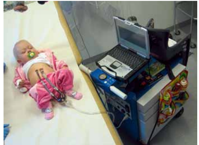
Figur 1. Den mekaniska hjärtumpen Berlin Heart EXCOR, som kan användas från spädbarnsåldern.

Under åren 1989–2009 [3] var mortaliteten i Sverige 31 procent (44 procent för barn under 1 års ålder) för barn som sattes upp på väntelista för hjärttransplantation. Drygt hälften (55 procent) av barnen hade dilaterad kardiomyopati, och 45 procent hade medfött hjärtfel. Under hösten 2006 initierades i Sverige användning av ett mer aktivt pumpprogram för barn med svår hjärtsvikt då en flicka med dilaterad kardiomyopati transporterades till Berlin och fick en pump av typen Berlin Heart EXCOR inopererad, varefter hon transplanterades.