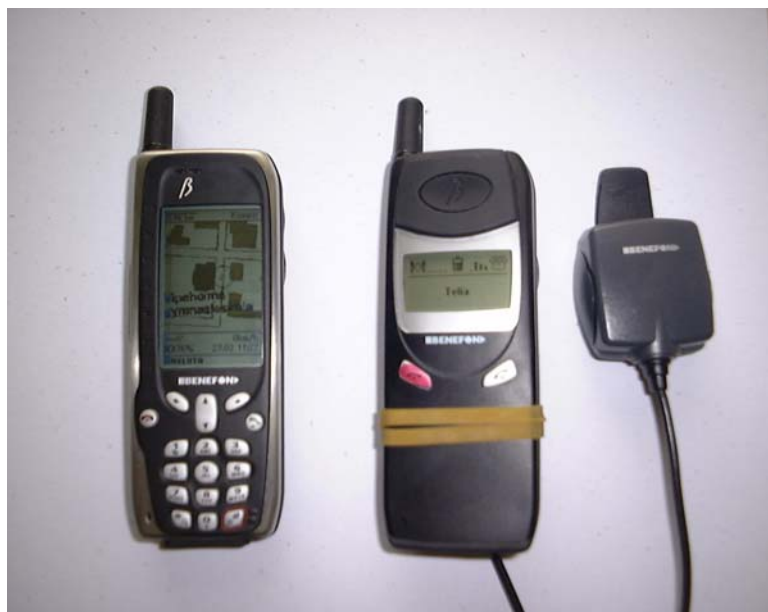
Figur 2. Den primära utrustningen för den provade navigationstjänsten. Karttelefonen, längst till vänster, den kognitivt enkla telefonen i mitten och den externa GPS antennen längst till höger.

Huvudpersonen bär den kognitivt enkla Seraph telefonen i fickan, och med den externa GPS antennen placerad vid axeln. På framsidan på rapporten demonstrerar Rolf utrustningen som han som huvudperson har använt. En närbild när navigationsknappen trycks in visas i Figur 3.