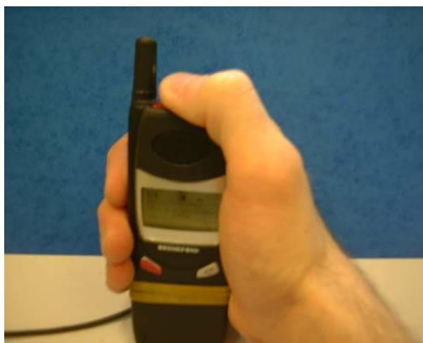
Figur 3. Bild där navigationsknappen trycks in med tummen.

Den externa GPS antennen är nödvändig, eftersom det ger för dålig mottagning av satellitsignalerna om Seraph telefonen bärs i fickan utan extern GPS antenn. Det gick då mellan 10 sekunder och två minuter från det att telefonen togs upp från fickan till positionen var uppdaterad. Det är inte rimligt att be huvudpersonen att först kontrollera om positionen är uppdaterad, och sedan trycka på navigationsknappen. I projektet har det även experimenterats med ett axelhölster för mobiltelefonen. Axelhölstret placerar telefonen på ett sådant sätt att den interna GPS antennen får god täckning, och därmed behövs inte den externa GPS antennen. Navigationsknappen flyttades då ut till ett armband. Lösningen fungerar, men är inte provad med provanvändare. Stundtals har den kognitivt enkla telefonen bytts ut mot en Benefon Track One NT. Den telefonen är inte kognitivt enkel, och därför användes istället Seraph telefonen. För de huvudpersoner som vill använda en ”vanlig” mobiltelefon med navigationsknapp är Track One en möjlig lösning.