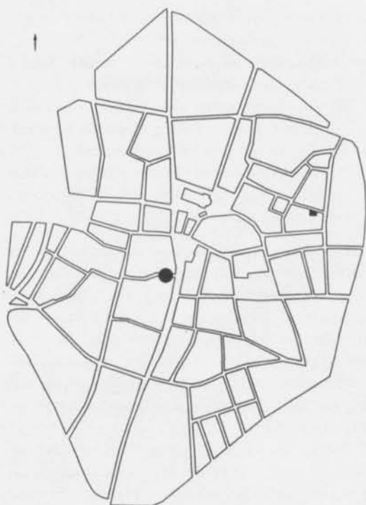
Fig. 1. Lund med gatunät omkring 1900. Utgrävningsplatsen i kvarteret Sjalabodarna 11 markerad med fylld rektangel. Fylld cirkel markerar S:t Drottens stavkyrka i Kattesund. – Lund at the end of the 19th century. The excavation marked with a black rectangle. The black circle indicates the wooden church of St. Drotten in Kattesund.

gör. Där avslöjas hur den avlidne och de anhöriga såg på sig själva eller ville att andra skulle uppfatta dem. Gruppens normer lyser klarast i hedniska gravar, medan de medeltida kristna gravarna ger ett magrare material att tolka. Nedläggningarna har som intention att avspegla likheten inför döden och det är endast i fall av avvikelser från mönstret som frågetecken uppstår. Skillnader i riktningen på den döde, annorlunda kistkonstruktioner, placeringen på kyrkogården och gravgåvor leder till diskussioner om den annars monotona bilden. Om dessutom en död hittas utanför alla normala sammanhang blir frågorna ännu mer pockande.