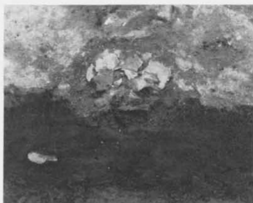
Fig. 2. Kraniet på plats under lergolvet. The skull under the clay floor.

bostadshus med lergolv, takbärande stolpar och härdar. Under golvet till detta har man någon gång under tidig medeltid placerat kroppen av ett barn, 0–3 månader gammalt (Arcini; åldersbestämningen är utförd med längden på rörbenen som utgångspunkt). Kvar var kraniet, överarmarna, en underarm och delar av bäckenet. Övriga ben förstördes vid undersökningen (fig. 3).