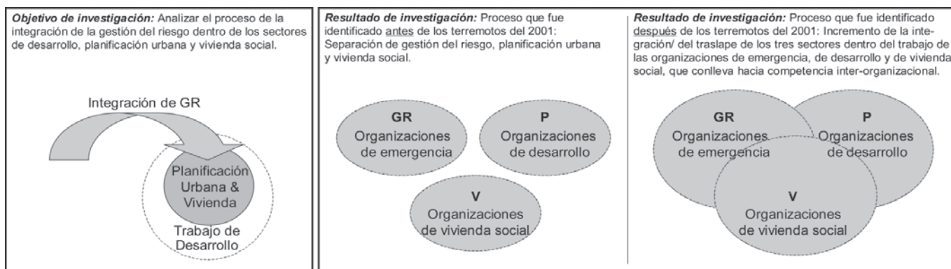
Figura 1: Proceso de la integración de la gestión del riesgo en El Salvador. GR = Gestión del Riesgo, V = Vivienda Social, P = Planificación Urbana.

La integración descrita de los sectores conllevó por un lado a proyectos mucho más integrales con diferentes puntos de entrada, pero por otro lado, también conllevó parcialmente a similares actividades y resultados finales. La tabla 1 muestra las alternativas para los diferentes puntos de entrada y la integración sucesiva de los tres sectores en cuestión. Por lo tanto, el concepto de gestión del riesgo ha sido identificado como dirigiéndose hacia, y promoviendo actividades de planificación urbana y de vivienda social. Por ejemplo, con la implementación de algunas actividades de gestión del riesgo, las comunidades tuvieron la oportunidad de legalizar su tierra, y la elaboración de los mapas de riesgo conllevó al trabajo en la