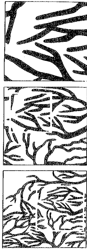
Fig. 3. Hjernens blodkar som eksempel på fraktale strukturer. Det forgrenede mønster gentager sig ved forskellige grader af forstørrelse. Tegnet efter Svenska Dagbladet 19 febr 1989.

Oversat til arkæologien betyder dette, at vi skal lede efter symmetrier i forskellige skalaer af tiden og rummet. Kan vi se ligheder mellem hændel-