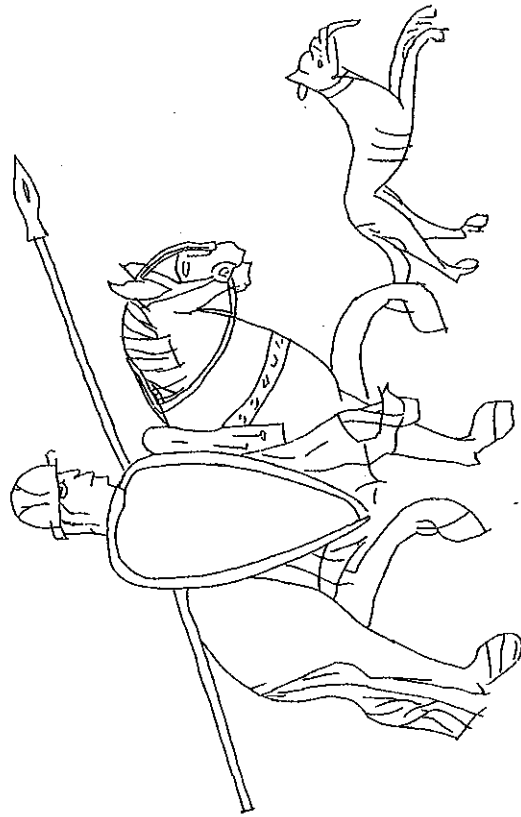
Fig 2: Væbnet rytter med stigsøjler indridset i Gol stavkirke i 1200-årene. Tegnet efter Marin Blindheim: Graffiti in Norwegian Stave Churches C 1150- C 1350 , Medieval Art in Norway, Oslo 1985.

En hændelse, der er let at overse, kan påvirke konjunkturen og endeligt den grundlæggende struktur. Det mest kunne let have været helt ander-