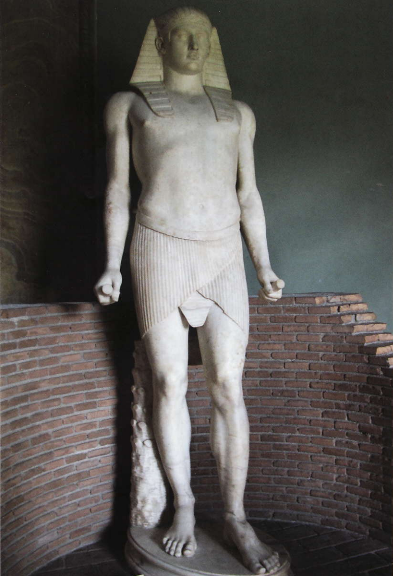
Skulptur i egyptiserad stil från Hadrianus' villa. Vatikanmuseet, Rom