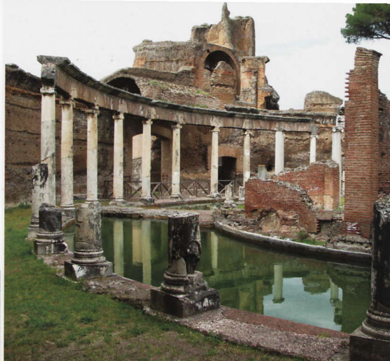
Den s.k. Maritima teatern, antagligen Hadrianus' privatbostad

T uristströmmarna är här långt mindre påträngande, trots att två världsarvslistade kulturskatter lockar: kejsar Hadrianus' villa från 100-talet e. Kr. och palats- och trädgårdsanläggningen Villa d'Este från 1500-talet.