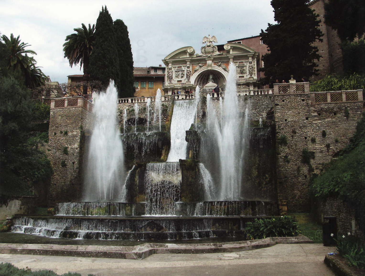
Neptunfontänen, det kanske mest imponerande vattenspelet i Villa d'Estes trädgård

Denna gestaltades som en terrasserad sluttning nedanför villan utifrån vilken en centralaxel med delvis korsformade sidovägar utgår. Trots att grundplanen är utformad utifrån strängt geometriska överväganden bjuder en promenad i anläggningen på många oförväntade detaljer bakom nästan varje hörn. Förutom åtskilliga skulpturer finns här även fler än 500, under sommaren behagligt svalkande, fontäner, kaskader och sofistikerade vattenspel, inte minst en s.k. vattenorgel. Givetvis förutsatte denna överväldigande mångfald av fontäner ett avancerat hydrauliskt system, och under marken löper ett vidsträckt och intrikat nätverk av kanaler och rörledningar. Anläggningen anses vara ett mästerverk inom italiensk trädgårdskonst och blev stilbildande för europeisk park- och trädgårdsdesign, inte minst under barocken.