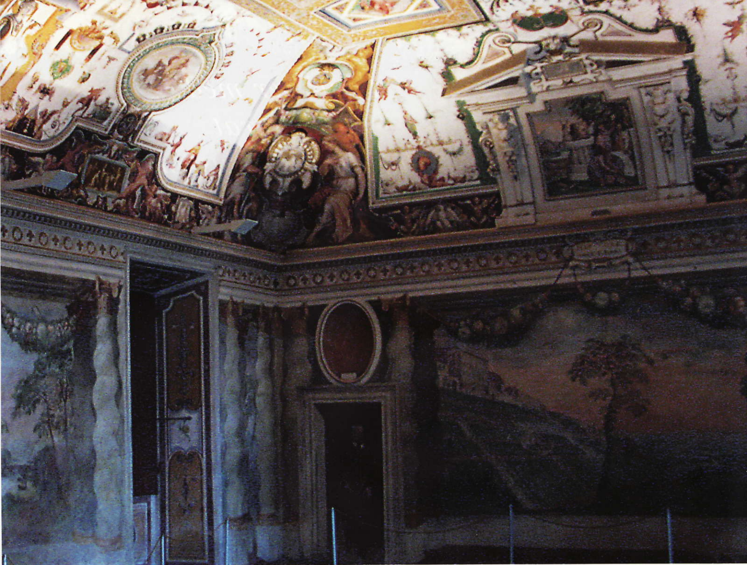
Den s.k. Fontänhallen i Villa d'Este med målad skenarkitektur. I bakgrunden verkar en man kliva in i rummet.