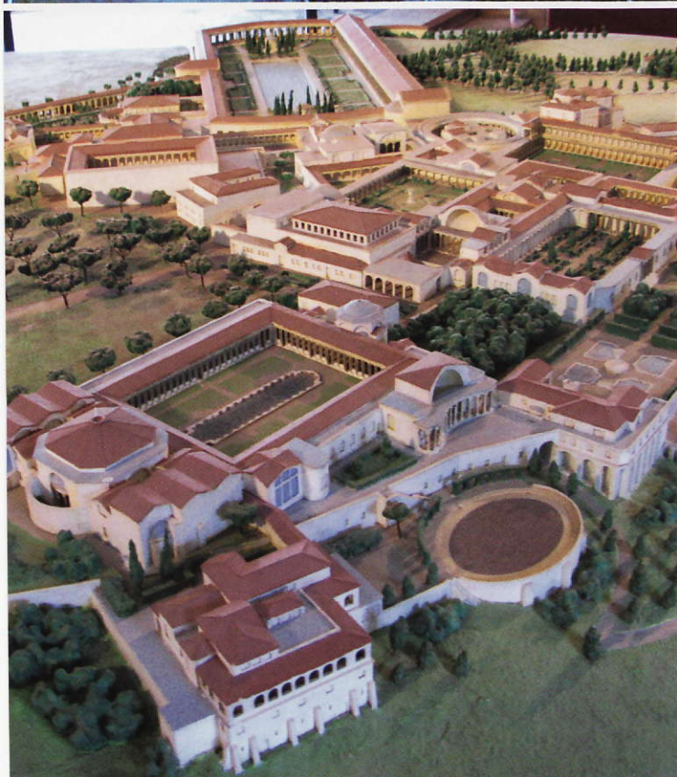
Modell över Hadrianus' storslagna villaanläggning

kelformat triclinium, dvs. en matsal, befann sig. Trots uppenbara grekiska stilinfluenser avsåg dock bassängen att symbolisera den kanal som förband den egyptiska staden Canopus med Alexandria. Nämnvärd är även den s.k. Marina teatern, en ringformad bassäng omgiven av en portik och med en miniatyrvilla som en ö i dess mitt (ca. 25 m i diameter). Villan kunde nås över två träbroar och inhyste såväl ett bibliotek, ett atrium och små badrum. Det antas att byggnaden användes av Hadrianus själv, när han ville dra sig undan från sina förpliktelser.