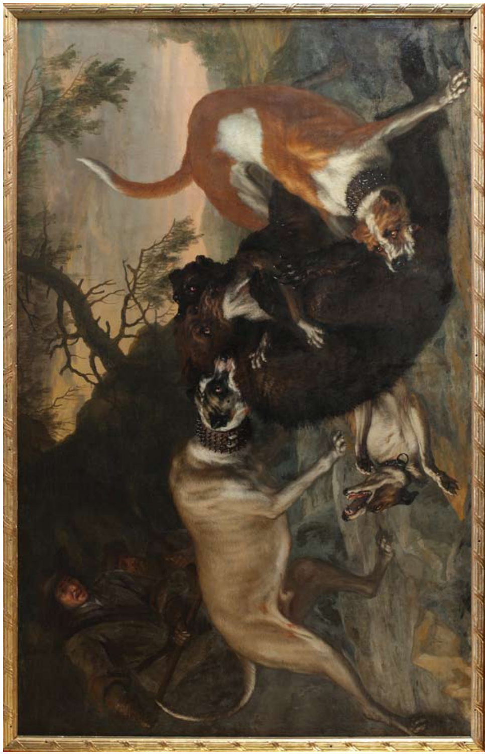
8. David Klöcker Ehrenstråhl, Björn i kamp med fyra av Karl XI:s hundar (1674).