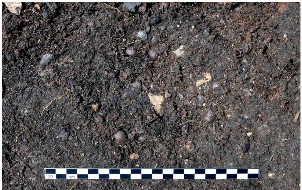
Fig. 6. Detalj av den nedre delen av det fyndförande lagret vid FP1321, med hasselnötsskal, träkol och småsten, efter det att den övre delen av lagret med tjärbloss grävts bort. Skalstockens längd: 0,2 m.