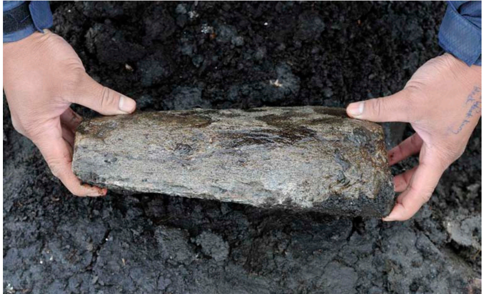
Fig. 3. Flat ankarsten av gnejs, FP1339.

Liksom tidigare år framkom de flesta i den fyndrika nordvästra delen av täkten där många flintor troligtvis härstammar från utkastlager och mindre aktivitetsytor (fig. 2). De flesta flintorna är vitpatinerade/kalcinerade, i likhet med tidigare fynd i lagren av detritusgyttja. Ett flintspån har fragmenterats av täktmaskinerna. I brottytan på det 7 mm tjocka spånet kan man se att kalcineringsprocessen har nått ca 2 mm in från ytan (fig. 4:5). På sönderkörda flintor av samma storlek har denna grad av kalcinering tidigare konstaterats i lagren av detritusgyttja.