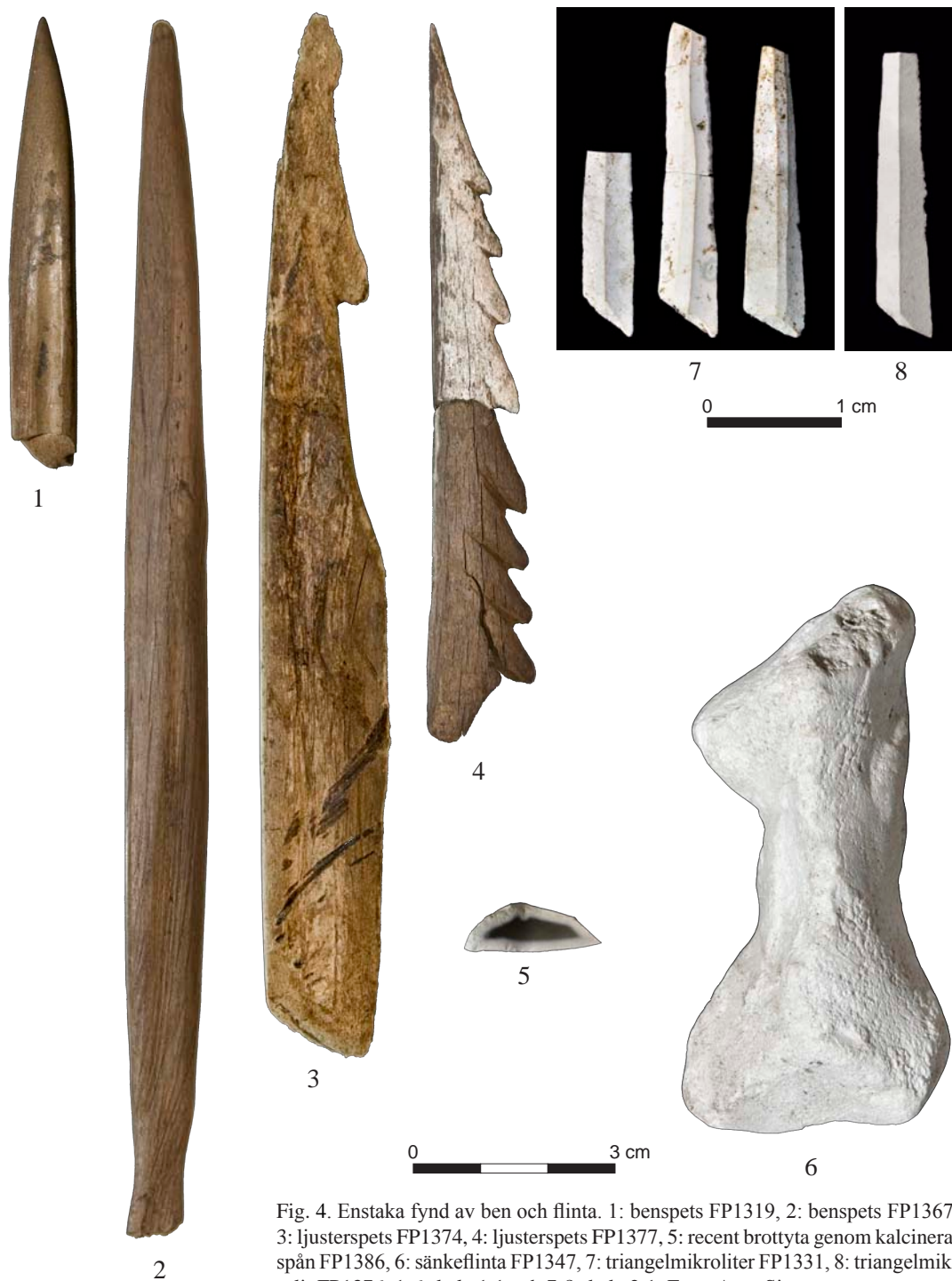
Fig. 4. Enstaka fynd av ben och flinta. 1: benspets FP1319, 2: benspets FP1367, 3: ljusterspets FP1374, 4: ljusterspets FP1377, 5: recent brottita genom kalcinerat spån FP1386, 6: sänkeflinta FP1347, 7: triangelmikroliter FP1331, 8: triangelmikrolit FP1376. 1-6 skala 1:1 och 7-8 skala 2:1.