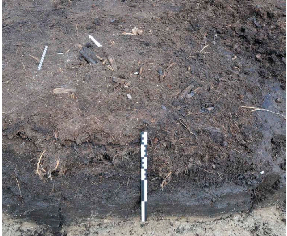
Fig. 5. Aktivitetsytan FP1321, strax efter det att den övre delen av det fyndförande lagret rensats fram. Några tjärbloss, småsten och flintor kan ses i den övre delen, som är belägen i vasstorv. Längst till höger, på lagret av findetritusgyttja, skymtar den nedre sotiga delen av lagret fram. Det gråa lagret längst ner i bild är kalkgyttja. Den närmre vertikala skalstockens längd är 0,4 m och den bortre horisontella är 0,2 m.