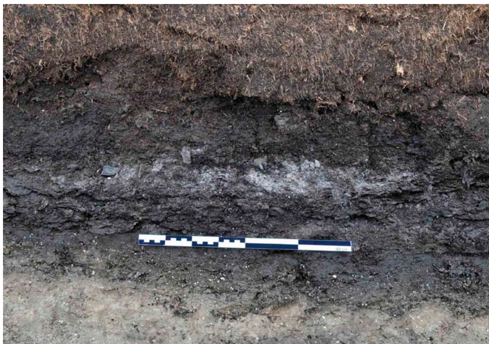
Fig. 9. Sektion genom det sandiga härdområdet FP1336, som skapats genom dikesgrävning. Det nedre ljusa lagret är kalkgyttja. Skalstockens längd: 0,4 m.

Härdområdet FP1336 framkom i den norra delen av täkten, i övergången mellan lagren av grovdetritus- och findetritusgyttja. Lämningen hade blottats genom dikesrensning och i dikeskanten kunde ett fyndförande sandigt lager konstateras (fig. 9). Vid framrensning framkom ett horisontellt beläget, halvcirkelformat, fyndförande område på 0,8x0,4 m, innehållande sand, grus, sten, tjärbloss, kol och flinta. Det