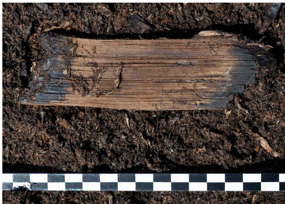
Fig. 8. Tjärbloss som bränts i båda ändar, FP1321. Skalgradering i centimeter.