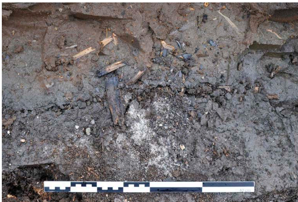
Fig. 10. Parti av härdområdet FP1336 i plan. Skalstockens längd: 0,4 m.