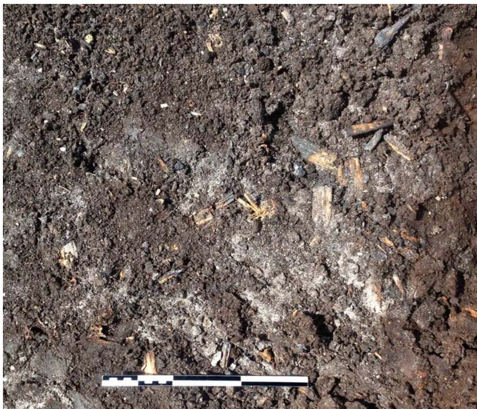
Fig. 11. Härdområdet FP1381 med ett sandigt fyndförande lager och en ansamling av tjärbloss. Skallstockens längd: 0,4 m.

brända, dock utan att ha förkolnat helt. Förutom dessa tjärbloss framkom en mängd små träflisor av tall, som är partiellt brända, oftast i ena änden. De kan delvis utgöra bitar som spaltats av från de större tjärbloss. I lagret framkom också 3 små barkbitar och 5 korta pinnfragment med och utan kvarsittande bark. Även vid denna fyndplats ser träkolet ut att härstamma från tjärbloss. Flera kolbitar är långsmala (upp till 50 mm) och vikten uppgår till 83 g (0,5 dm 2 ). Aktivitetsytan tolkas som ett härdområde som utifrån stratigrafien inte kan dateras närmare än till mellersta/sen maglemosetid.