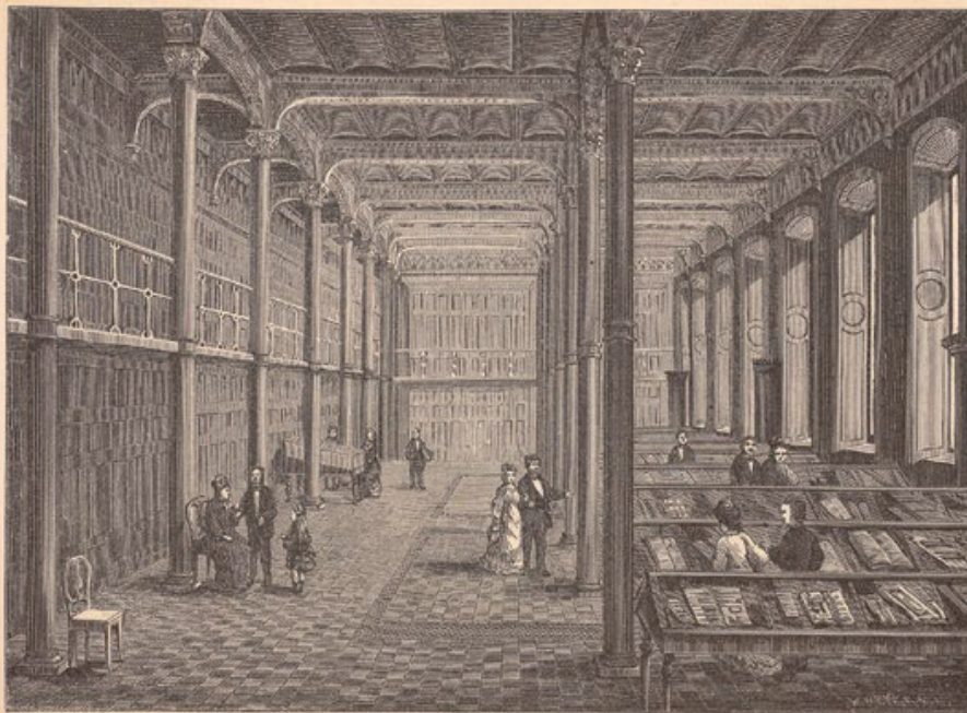
Visningsalen i Kungl. Biblioteket.

Visningsrummet hade ursprungligen samma dimensioner som den stora läsesalen. Längs den inre långväggen fanns låsbara skåp där bibliotekets handskrifter förvarades. Ur Lundstedt, Om Kungliga biblioteket i Stockholm , 1879.