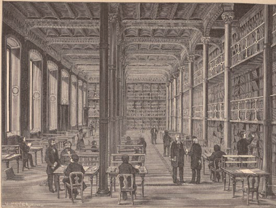
Läsesalen i Kungl. Biblioteket.