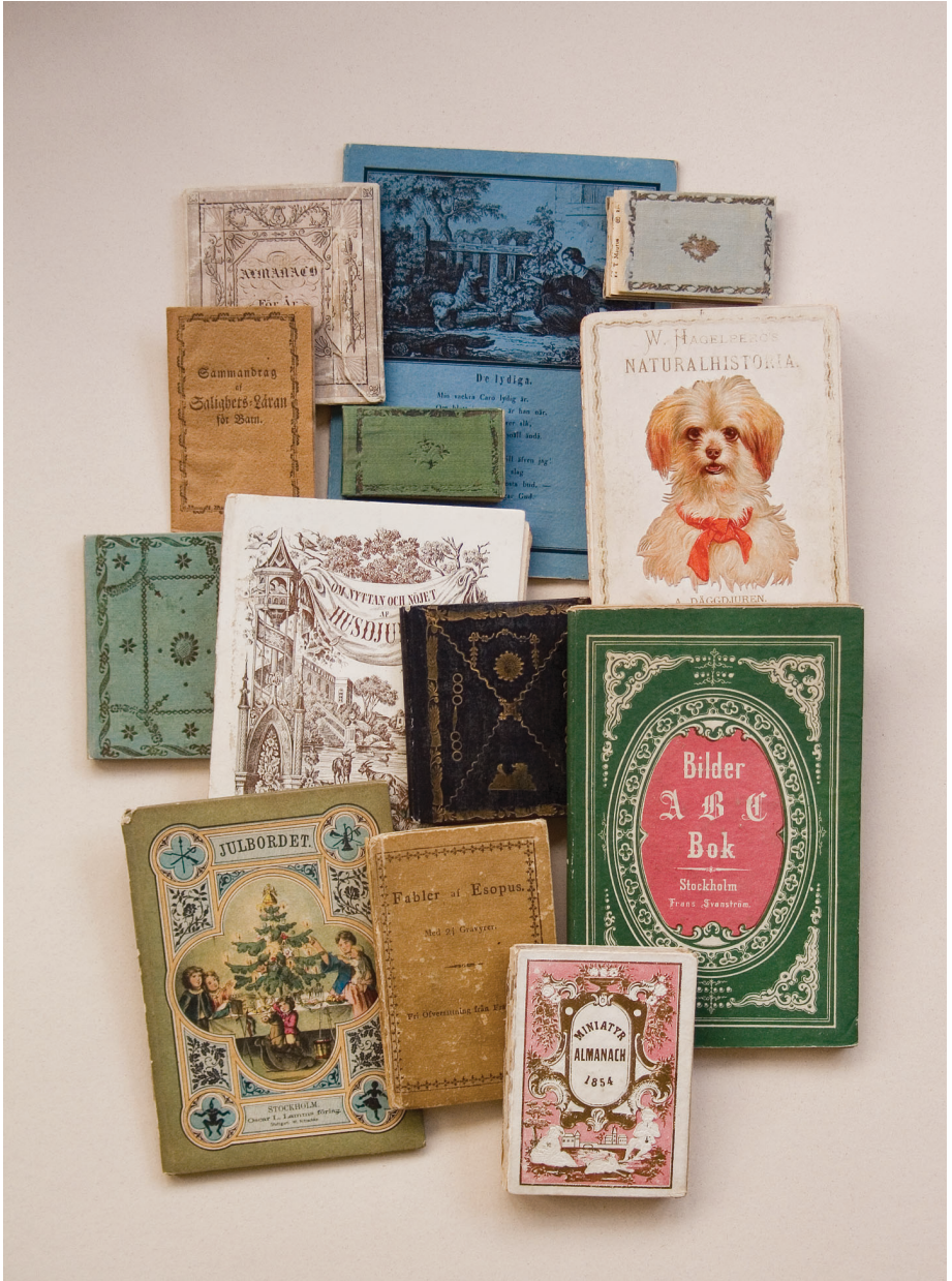
Almanackor och barbböcker i dekorerade band från förlag och bokhandel 1802–1876.