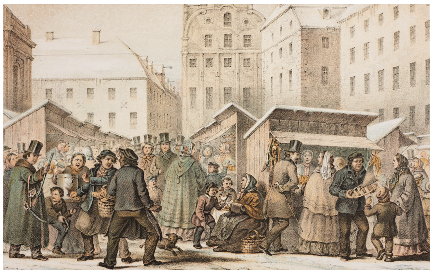
Julmarknaden på Stortorget i Stockholm, ur Litografiskt Allehanda , 1859.

läsning och läsningens dåliga respektive goda värden som pågick i samtiden. Där möttes motsatserna manligt–kvinnligt, mödosamt–lustfyllt, beständigt–flyktigt, lärande–underhållande och, sist men inte minst litterär–bildande kontra fiktion–populär. 27