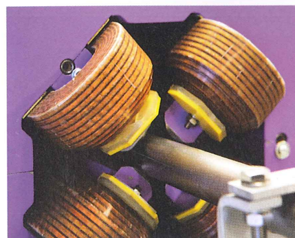
En kvadrupolmagnet längs linjäracceleratorn i MAX IV.

Ljuset skapas då elektroner passerar en magnet och "skakar" till. Detta sker på flera ställen runt maskinen men kan optimeras på olika sätt beroende på vad man vill förbättra. Vill man nå mer röntgenljus placerar man ett par starka magneter, en sk wiggler, där elektronens bana abrupt svänger fram och tillbaka. Vill man i stället öka intensiteten, briljansen, använder man många mindre svagare magneter i serie. Genom att ljuset från varje