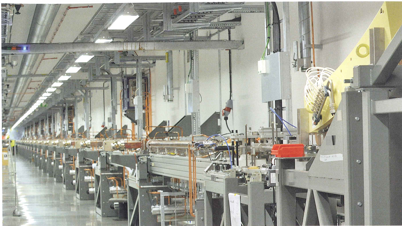
Elektronkanonen (tv) och början av linjäracceleratorn i MAX IV.

accelerera elektronerna, dipolmagneter med konstanta fält för att styra dem, kvadrupolmagneter som fungerar som magnetiska linser och speciella magneter för att styra utsändningen av ljus.