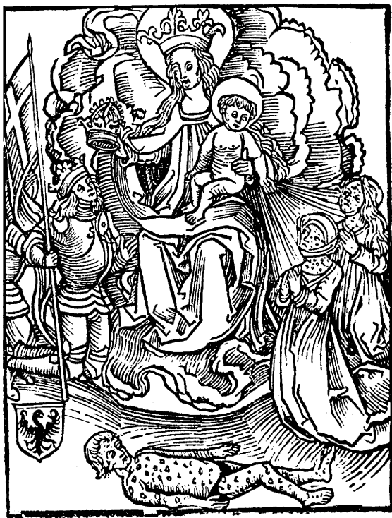
Fig. 3. Uppkomsten av syfilis i slutet av 1400-talet betraktades både av läkarkåren och kyrkan som ett gudomligt syndastraff. På titelbladet till Joseph Grünpecks Ein hübscher Tractat von dem Ursprung des Bösen Franzos från 1496 – den första medicinska skriften om den nya farsoten – låter Kristus beslä mänskligheten med syfilisbilder.

Ein hübscher Tractat von dem vrsprung des bösen fran- 308. das man nennet die wilden wartsen. Auch ein regimēt vnd ware ertzennē mit salben vnd gedranck. wie man sich regiren soll in diser zeyt.