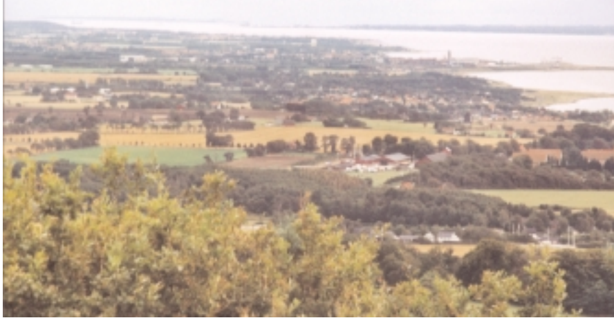
Utsikt från Håkull mot Öresund och den danska kusten.

och igenväxta betesmarker på att området brukats av byborna för inte så länge sedan. Stora delar av Kullaberg användes som betesmarker under den historiska tiden. 12 Det är möjligt att det bergiga området även brukats under tidigare århundraden, men vi känner inte några spår från den förkristna tiden inom detta centrala parti av Kullaberg.