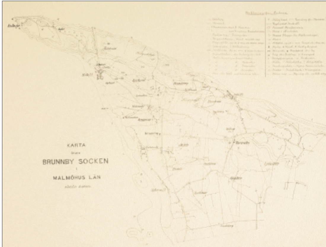
Fornlämningskarta över Brunnby socken, tryckt 1874. Krapperups Godsarkiv.