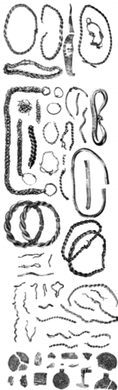
Skattfyndet Bräcke nr 11, Brunnby socken.