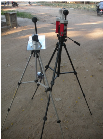
Instrument som mäter alla klimatfaktorer för beräkning av WBGT.

För att på ett bra sätt göra en riskbedömning om klimatets inverkan på den arbetande människan måste ett flertal parametrar vägas in. Den yttre miljön bedöms genom att mäta lufttemperatur, luftfuktighet, strålning och vindhastighet. Strålning kan komma från solen, men också från maskiner och ugnar på arbetsplatsen. En ekvation räknar ut ett så kallat värmeindex med hjälp av dessa parametrar. 'Wet-Bulb Globe Temperature' (WBGT) är ett vanligt sådant värmeindex. Det är också en internationell standard som sätter gränsvärden för arbete i värme.