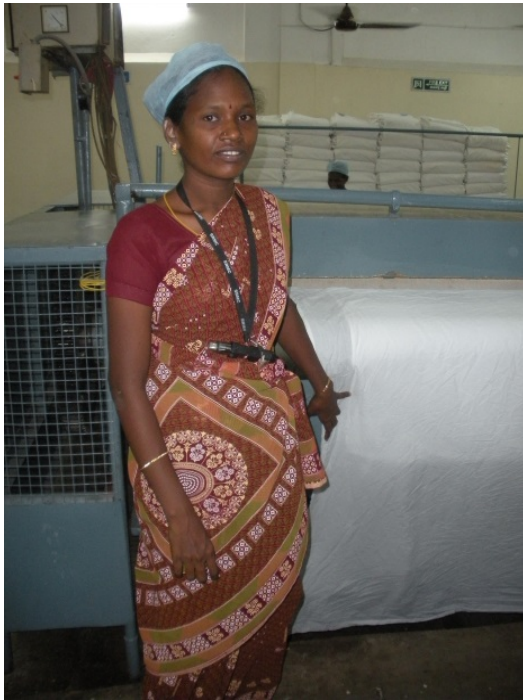
Vanlig kvinnlig arbetskläder i Chennai

En problematisk lösning på ökad hetta är luftkonditionering. Luftkonditionering har hög elektricitetskonsumtion vilket påverkar klimatförändringarna negativt eftersom elektriciteten vanligtvis kommer från kolkraftverk. Denna höga belastning på elektricitetsnätverket gör också att strömavbrott kan bli mer vanliga. Det är även kostsamt att driva ett luftkonditioneringssystem, vilket gör att mindre företag och fattiga människor inte har råd.