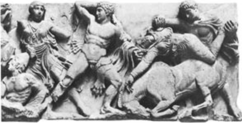
BILD 3. Grekisk fris (Apollon Epikourios-templet, Bassai, ca 410 f. Kr.)

Romerska porträttbyster från den senrepublikanska tiden visar ett ännu tydligare intresse för individen, med dess påtagliga realism beträffande de avbildade personernas fysionomiska drag (se bild 4). 31 Genren bottnade i en traditionell förfäderskult, där vaxmasker av avlidna släktingar så småningom ersattes av porträtt i mer beständigt material, i synnerhet marmor. Genealogiska släkträd utformades, och porträtt av de avlidna samt skriftliga dokument förvarades i patricierfamiljernas arkiv. Till synes implicerar denna tradition såväl en viss kontinuitet mellan individen och familjen som ett linjärt tidsperspektiv, emellertid snarare orienterat mot det förflutna och nutiden än framtiden.