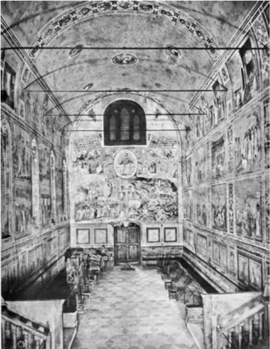
BILD 5. Giotto di Bondone (Arenakapellet med Yttersta domén i bakgrunden, Padua, ca 1306)