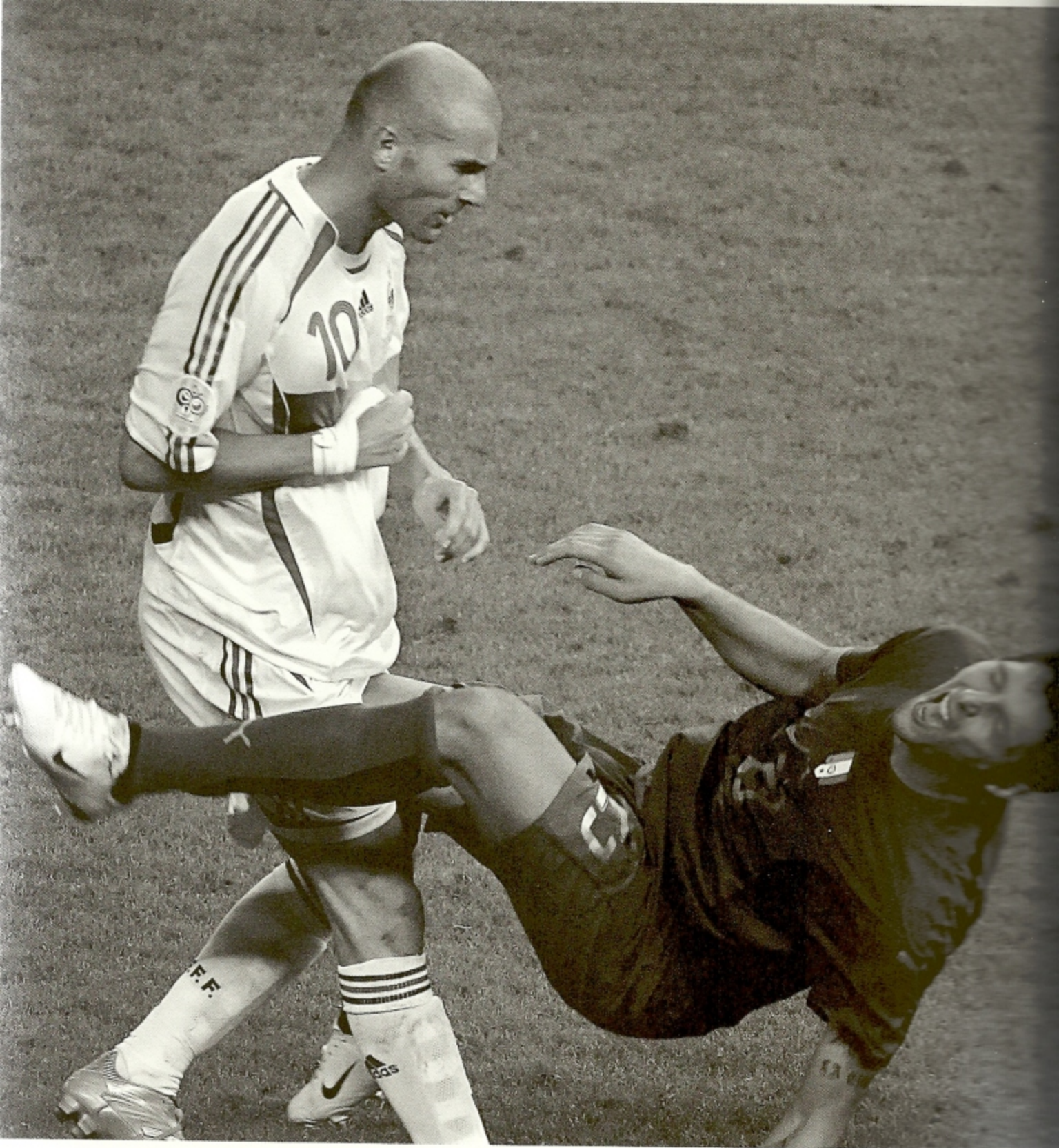
Zinedine Zidane skallar Marco Materazzi under finalen i Fotbolls-VM 2006.