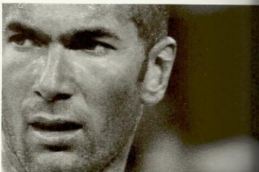
Zinedine Zidane ur Douglas Gordons och Philippe Parrenos film Zidane , ett porträtt från det tjugoförsta århundradet, 2006.