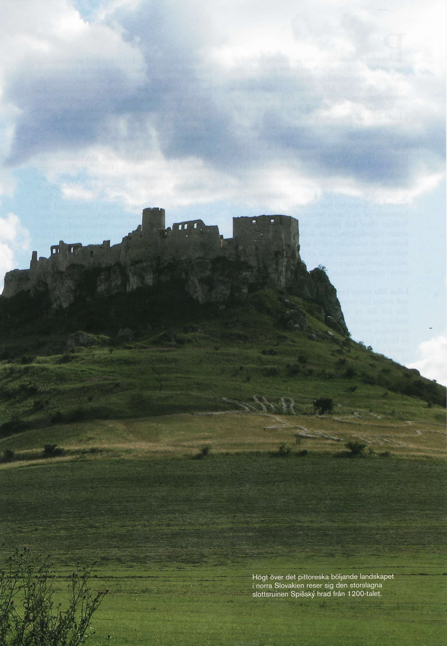
Högt över det pittoreska böljande landskapet i norra Slovakien reser sig den storslagna slottsruinen Spišský hrad från 1200-talet.