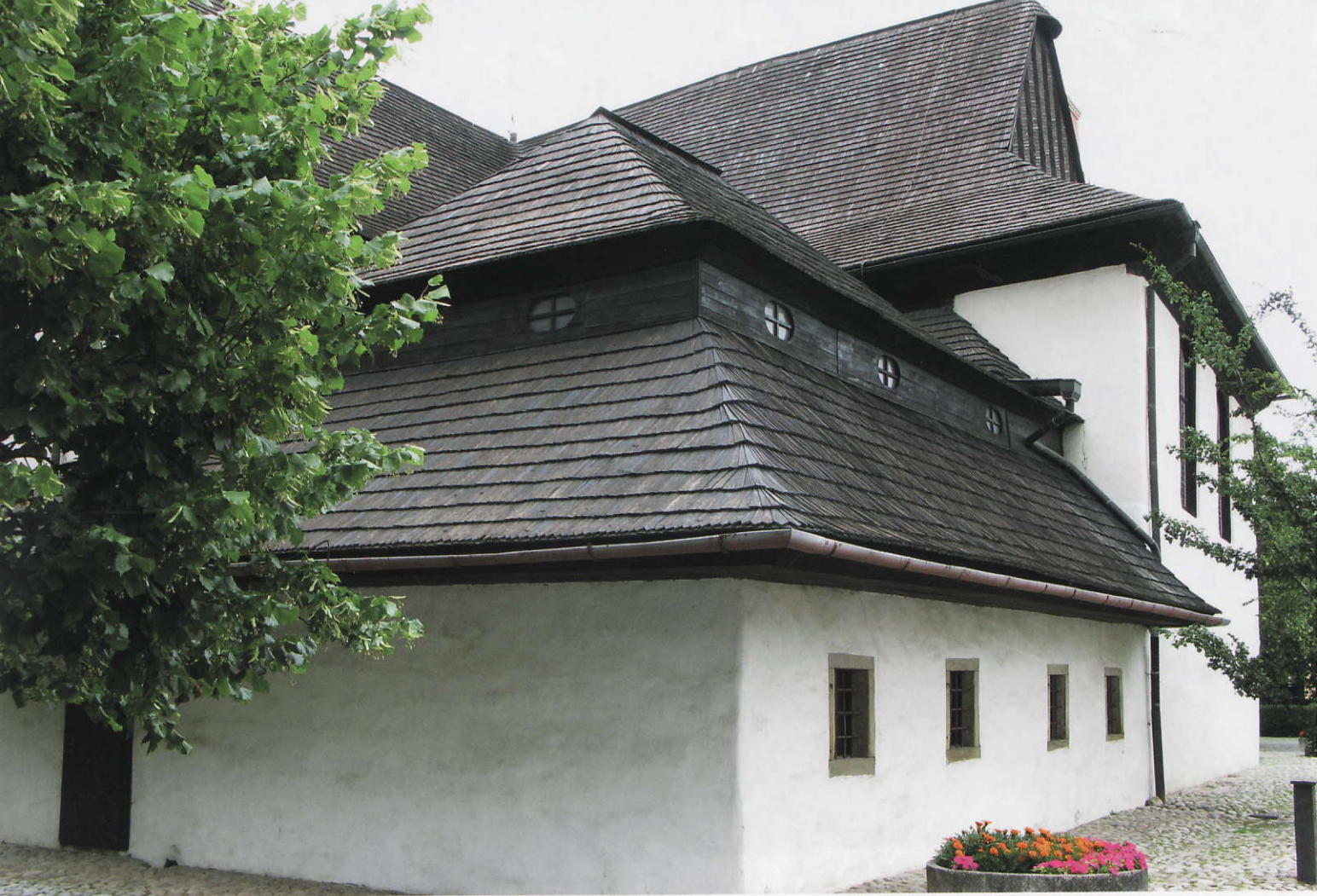
Bakom den protestantiska träkyrkans putstäckta fasad i Kežmarok döljer sig en praktfull barock interiör.