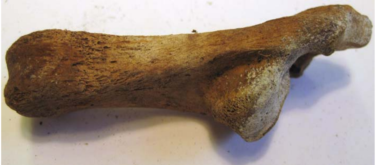
Fig. 4. Hälben från en vuxen ren.

den spridda åldersfördelningen för sammanväxning av hälbenet hos ren går detta inte att säkert avgöra.