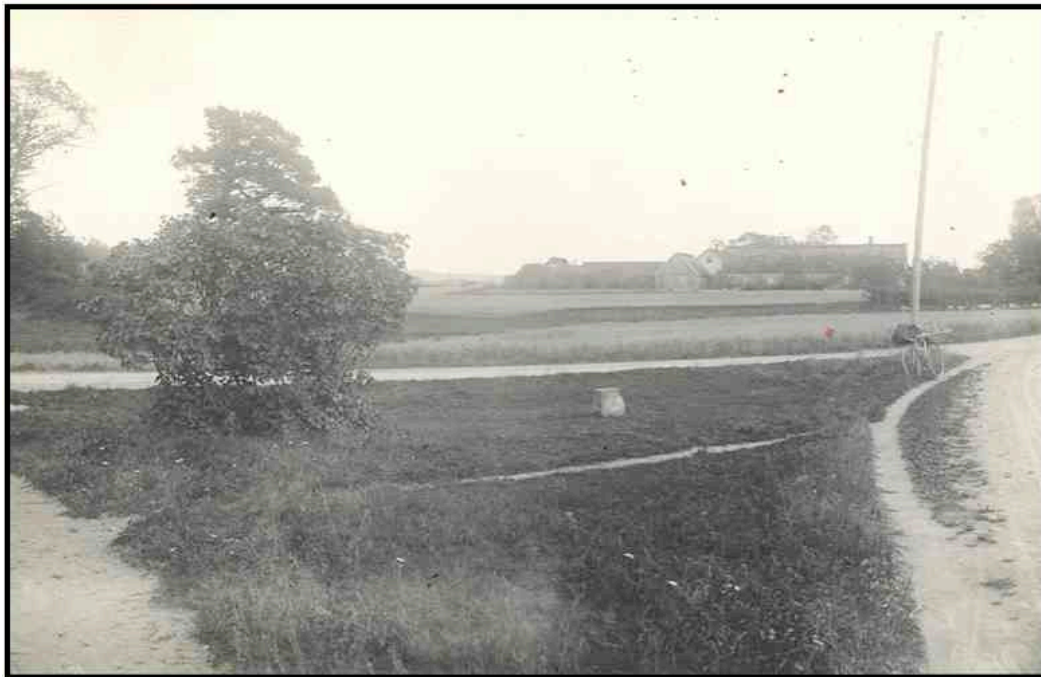
Bild 5. Byplatsen i Össjö fotograferad av Nordiska museets expedition 1920. Byplatsen hade pekats ut som en samlingsplats för byns innevånare i äldre tid. Till höger i bild syns en av det moderna samhällets symboler, en telefonstolpe. Mot den står en cykel lutad, fältarbetarnas främsta transportmedel.

Fotografiet kan bara fånga nuet. Målet för utforskningarna var att finna dåtiden, vilket blev ett skäl till att fotografering kompletteras med teckning. Det var inte så att man övergav tecknandet därför att kameratekniken fanns, det var två tekniker för avbildning som kompletterade varandra. Att teckna är att också utforska ett objekt. I teckning möjliggörs också rekonstruktion av den dåtid som kameran inte kan fånga.