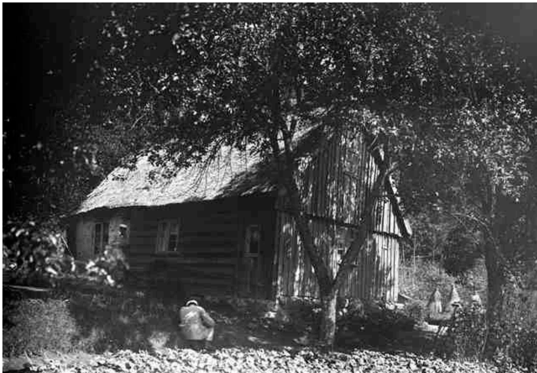
Bild 3. Uppmätning av hus 1921 i Grönadal, Östra Karups socken, på Hallandsås. Original i Helsingborgs museers arkiv.