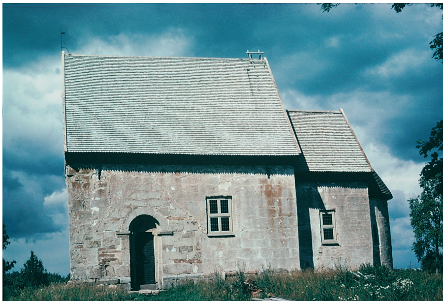
FIGUR I. bildtext...

matiska aspekter. För att idén om arkitektur som budskap i denna bemärkelse skall fungera, krävs att monumentets ”mening” reduceras i både socialt, ideologiskt och kronologiskt hänseende: socialt i det att det endast är en individ eller grupp (initiativtagarens) handlingar som framhålls, ideologiskt genom att det endast är denna grupp värderingar som beaktas, och kronologiskt i det att det endast är monumentet i dess ursprungliga gestaltning som är intressant. Problemet är dock att monument säl-lan är entydiga eller lätta att tolka. Det finns otaliga sätt på vilka en kyrkobyggnads symboliska uttryck kan kombineras och skapa mening, och monumen-tet är därmed öppet för en lång rad tolkningar. Mottagaren behöver alltså ingalunda ha uppfattat kyrkobyggnadens ”budskap” på det sätt som av-sändaren avsett. Därtill bör fogas att uppförandet av även den ringaste stenkyrka är ett projekt som löpt över flera år, och involverat en stor mängd människor i olika kapaciteter, som rimligtvis bör ha gjort sig tankar om meningen av det byggnadsverk man uppförde.