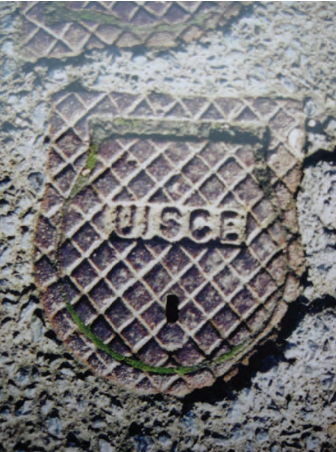
Fig.1: Galway, Irland

När man nästan aldrig hittar släta, odekorerade brunnslock i stadens gator är det antagligen därför att sådana lock skulle kunna vara farliga att beträda. Regn och snö skulle göra locken hala, inte minst skulle man lätt kunna halka när våta höstlöv fastnar på ytan. För att förhindra detta har man därför sedan länge utstyrt metallocken med olika typer av räfflingsmönster. Det kan vara i form av nerfällda linjer i metallytan som kan påminna om linjerna i grafikens djuptrycksplåtar