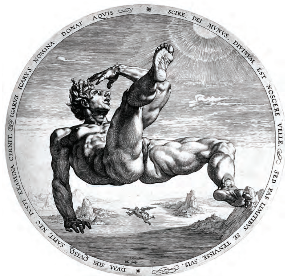
Fig. 6: Henrik Golzius, Ikaros fall (1588)

Vitruvius att människans kropp med dess symmetri och proportioner är den givna modellen för tempelbygge. Om en man ligger på rygg med armarna och benen utsträckta kan han inskrivas såväl i en cirkel som i en i cirkeln inskriven kvadrat och med naveln placerad i både cirkelns och kvadratens mittpunkt. Om templet konstrueras utifrån cirkelns och kvadratens geometriska former får byggnaden en "naturlighet" som är analog med människokroppens "naturlighet". Det var Vitruvius budskap. 5 Marcilio Ficino