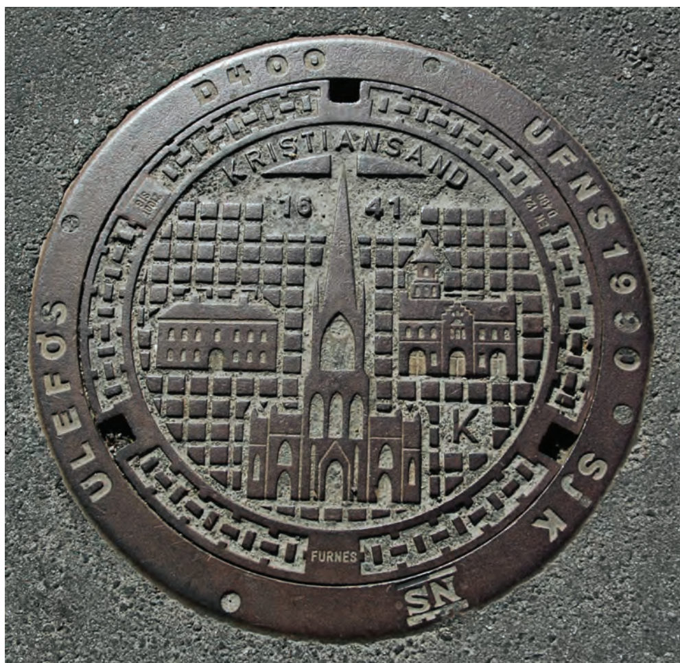
Fig 19: Kristiansand

passerandes uppmärksamhet på Manhattans rutiga gatunät där varje gata är strikt och logiskt relaterad till sina parallellgator och tvärgator. Brunnslocket interagerar således med den kringliggande staden.