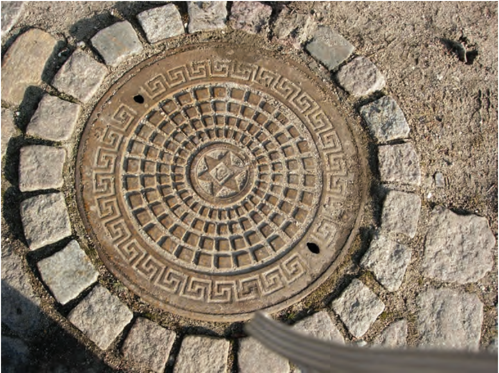
Fig 3: Köpenhamn

struktur med ett dominant och stabiliserande centrum där alla linjer möts hittar vi på ett av de vackraste brunnslocken i Paris (figur 2). Locketets mönster är uppbyggt av fyra palmetter och fyra former som refererar till den franska liljan (lys de France). Designen kan påminna om rosettfönstren i Notre-Dame de Paris eller i katedralerna i Chartres och Reims. Det är inte otänkbart att rosettfönstren inspirerat utformningen av denna gatans metallrosett i Paris. De vegetabiliska formerna lägger sig kalejdoskopiskt kring en mittpunkt. Inget element i locket