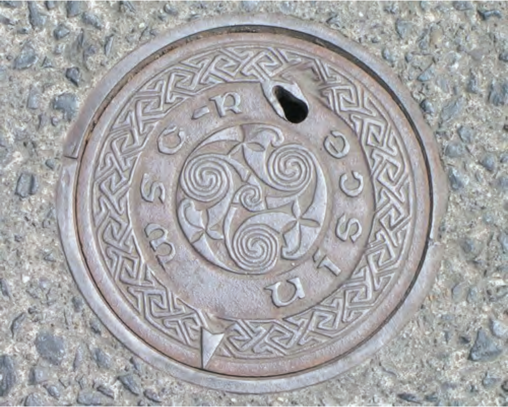
Fig. 27: Irländskt triskelebrunnslock i Galway

till megalitisk tid utformas oftast som tre sammankopplade dubbelspiraler. Dessa sträcker sig ut från sina respektive spiralformer och incirklar hela spiralgruppen. Triskelens tre spiraler ger tillsammans ett starkt uttryck för rotation. Den ursprungliga innebörden av triskeletecknet är höljd i dunkel. Man menar emellertid att den har med rörelse att göra. Under tidig medeltid knöts triskeletecknet till den kristna tron i betydelsen evigheten och människans livscykel och blev samtidigt ett tecken för treenigheten och andra triader som tro-hopp-kärlek, jord-himmel-vatten och dåtid-nutid-framtid. Triskelen är flitigt använd i iriska illuminationer, bland annat i Book of Kells . Man hittar för övrigt triskelen i många delar av världen, även på några av medeltidens bildstenar på Gotland.