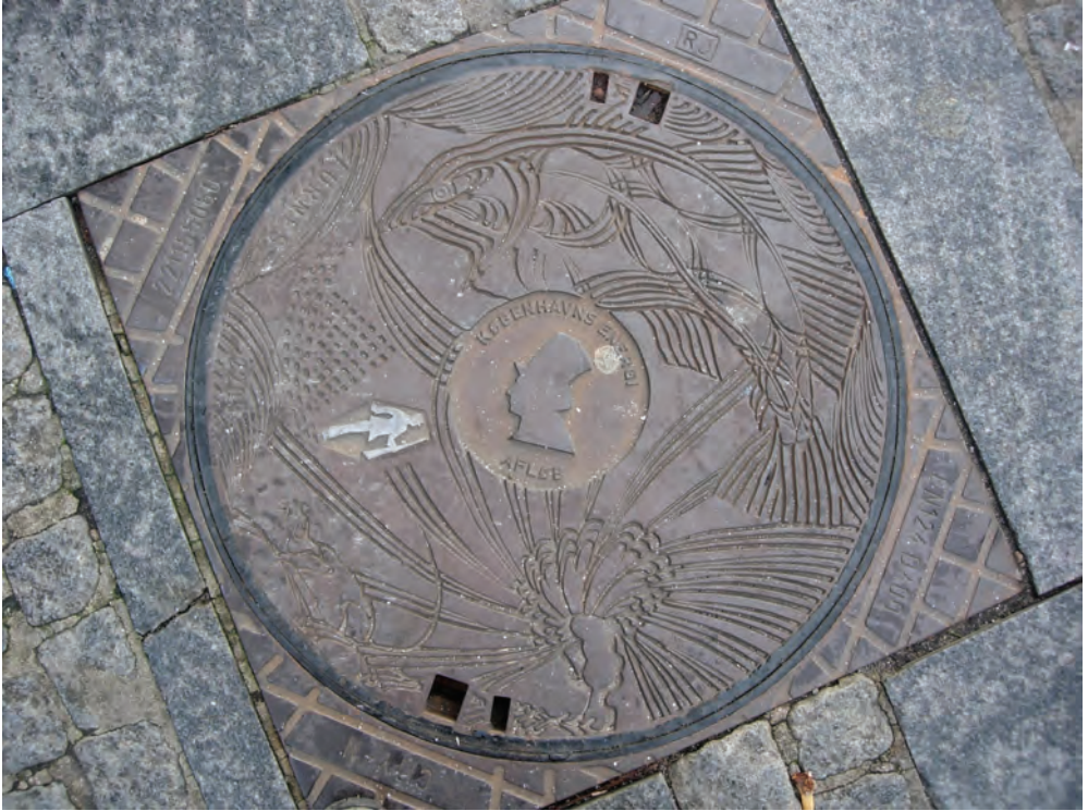
Fig. 22: H. C. Andersenlocket i Köpenhamn

rännstenarnas och brunnslockens värld. Det är detta locket på Strøget tar fasta på. Tusentals vandrande fötter trampar på det varje dag, men få uppmärksammar figurerna, liksom familjen i sagan inte uppmärksammar figurerna i kakelugnen.