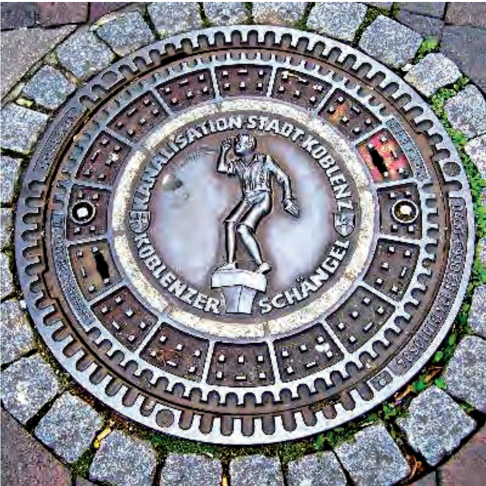
Fig 16: Koblenz

högt över betraktarens huvud. Mellan gestalterna i Mantegnas målning står vita moln på den blå himlen (figur 15). Det påträngande perspektivet gör att höjden känns hisnande. Reliefen på brunnslocket i Berlin visar en cirkel som bildar basen för en rad byggnader och monument i den tyska huvudstaden: Brandenburger Tor, riksdagsbyggnaden, Siegesseule, Fernsehturm, Olympiastadion, Gedächtniskirche samt förbundskanslerns nya byggnad, das Kanzleramt, som alla sträcker sig upp mot ”himlen”. Det vertikala perspektivet gör att byggnaderna smalnar av i höjden, vilket innebär att de på bilden riktar sig in mot lockets mitt där de radiella linjerna möts. På ”himlen”, det gemensamma tomma fältet mellan byggnaderna,