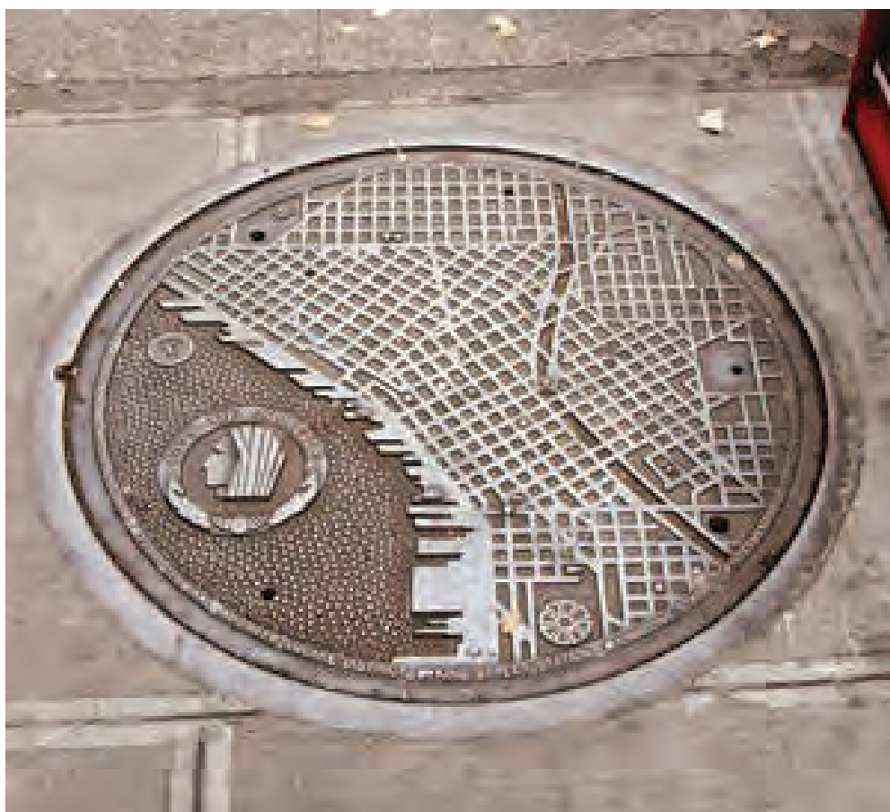
Fig. 18: Seattle

Ett fascinerande brunnslock som förenar historia och identitet hittar vi i den lilla turistorten Vossevangen i Norge (figur 17). 2005 placerade Voss kommun ut nya brunnslock i sin tätort. Man ville med de nya locken fira kommunens exceptionellt framgångsrika idrottsutövare. Under de senaste 50 åren hade nämligen Voss idrottsmän och idrottskvinnor tagit hela 87 medaljer i internationella mästerskap: OS, VM och EM. Med tanke på kommunens invånarantal var och är denna siffra enastående i världen. På locket ser vi i mitten Voss vapen och i en cirkel kring vapnet ligger gestalter i högrelief som representerar nio olika idrottsgrenar, de flesta inom vintersporten: rodd, golf, puckelpist, skidhopp, längdåkning, skärmflygning (paragliding), skidskytte, fotboll och alpin skidsport.