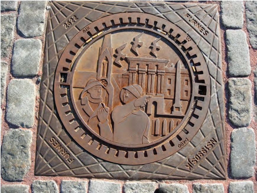
Fig 12: Haugesund