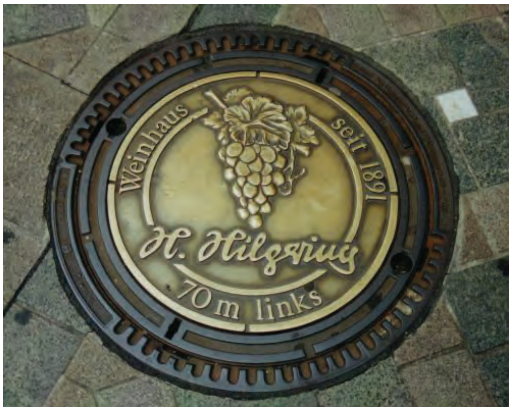
Fig. 20: Hilgering vinhus, Dortmund

återinfördes av Mussolini på 1930-talet för att i propagandasyfte anknyta till Roms storhetstid och inskräpa nationell uppslutning kring fascismen och hans egen person. Han beordrade att även brunnslocken i Den eviga staden skulle bära akronymen SPQR. Locken är daterade efter den nya fascistiska tideräkningen, era fascista , som infördes 1922. De ligger kvar fortfarande.