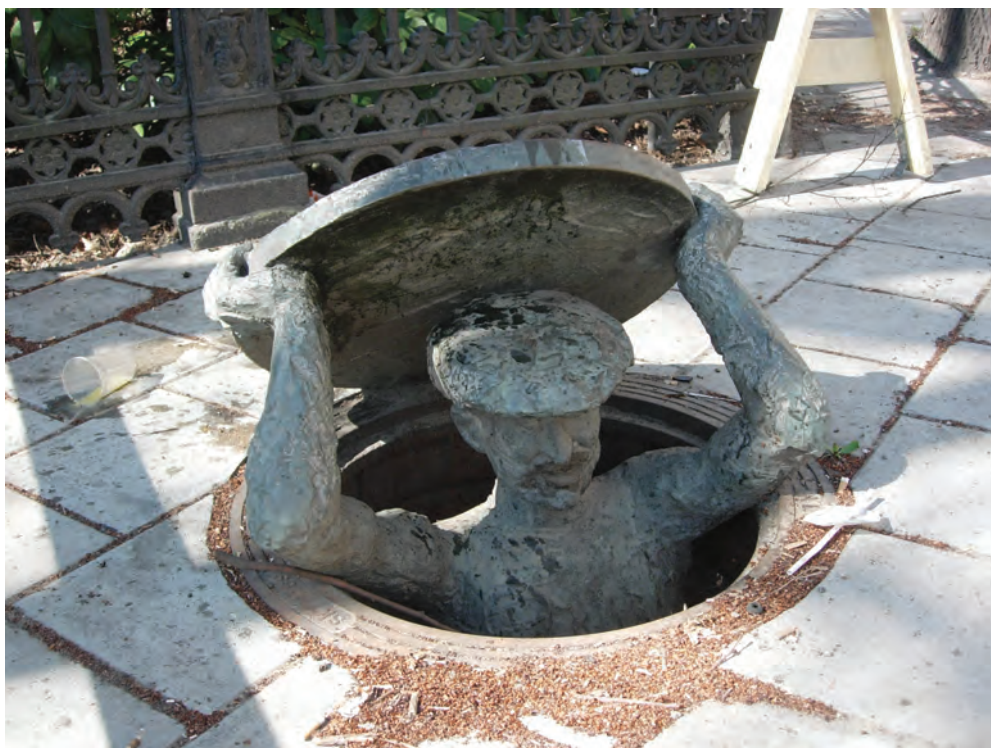
Fig. 29: K. G. Bejemark, Humor