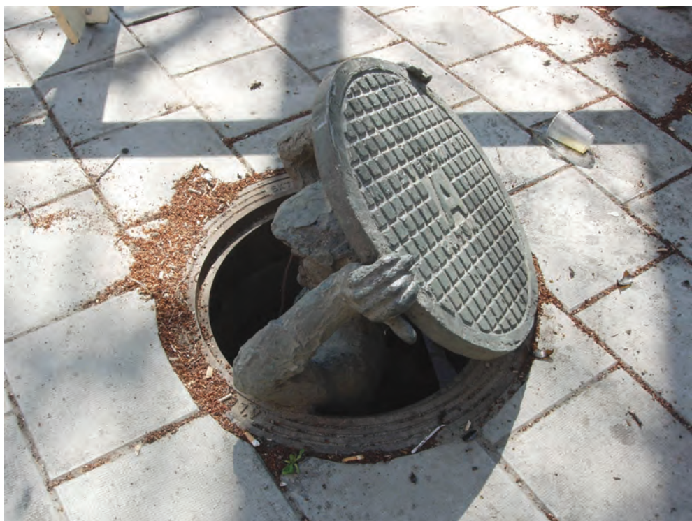
Fig. 28: K. G. Bejemark, Humor

I och med att brunnslockens funktion är att stänga till schakt i den trafikerade gatan är den eventuella skulpturala dekorationen på locken nödvändigtvis av lågreliefkaraktär. Men det finns exempel på brunnslock som lämnar brunnsfunktionen och i stället integrerar sig i friskulpturens värld. Vid Berzelii Park i Stockholm hittar vi K. G. Bejemarks bronsskulptur från 1967 med titeln Humor (figur 28 och 29). Skulpturen visar en gatuarbetare som sticker upp huvudet ur ett schakt medan han med båda händerna håller upp brunnslocket över sitt huvud. Ansiktsdragen är formade efter författaren och filmskaparen Hans Alfredsons utseende. Det lock han håller upp är ett vanligt svenskt A-lock. Liknande skämtsamma skulpturer finns i flera städer i Europa. På ett centralt torg i Bratislava står en fryntlig schaktarbetare i ett hål i gatan med axlarna ovan jord, med armarna vilande mot det stenlagda torget och med hakan vilande bekvämt mot händerna medan ögonen tittar uppåt. Han är gjord i brons. Brunnslocket ligger bak honom. I Bratislava kallas han den nyfikne betraktaren (tyska: Der Gaffer). I folkmun säger man att han tittar på förbipasserande damer underifrån.