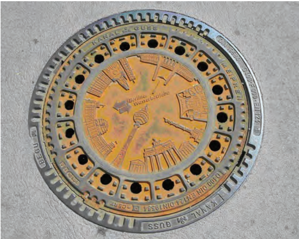
Fig. 14: Berlin

De norska brunnslocken struktureras inte ofta efter den florentinska tondomodellen. Ett undantag hittar vi i Oslos centrum (figur 13). Brunnslocket återger Oslos heraldiska tecken som inte är ett stadsvapen, utan ett runt sigill. På sigillet ser vi S:t Hallvard som enligt legenden försvarade en kvinna mot några manliga förföljare. Männen dödade Hallvard med tre pilar, band fast liket vid en kvarnsten och slängde det i Drammensfjorden. Liket flöt emellertid upp till ytan igen och fördes i land. Detta medförde att Hallvard blev helgonförklarad och senare även vald till Oslos skyddshelgon. Sigillet har en cirkulär tondoform. Iklädd kjortel och mantel sitter Hallvard i majestätställning på en lejontron med kvarnstenen i den ena handen och de tre pilarna i den andra. Vid hans fötter ligger kvinnan han försökte rädda. Hennes kropp är svängd, den följer periferin i cirkelns nederkant. Sigillet