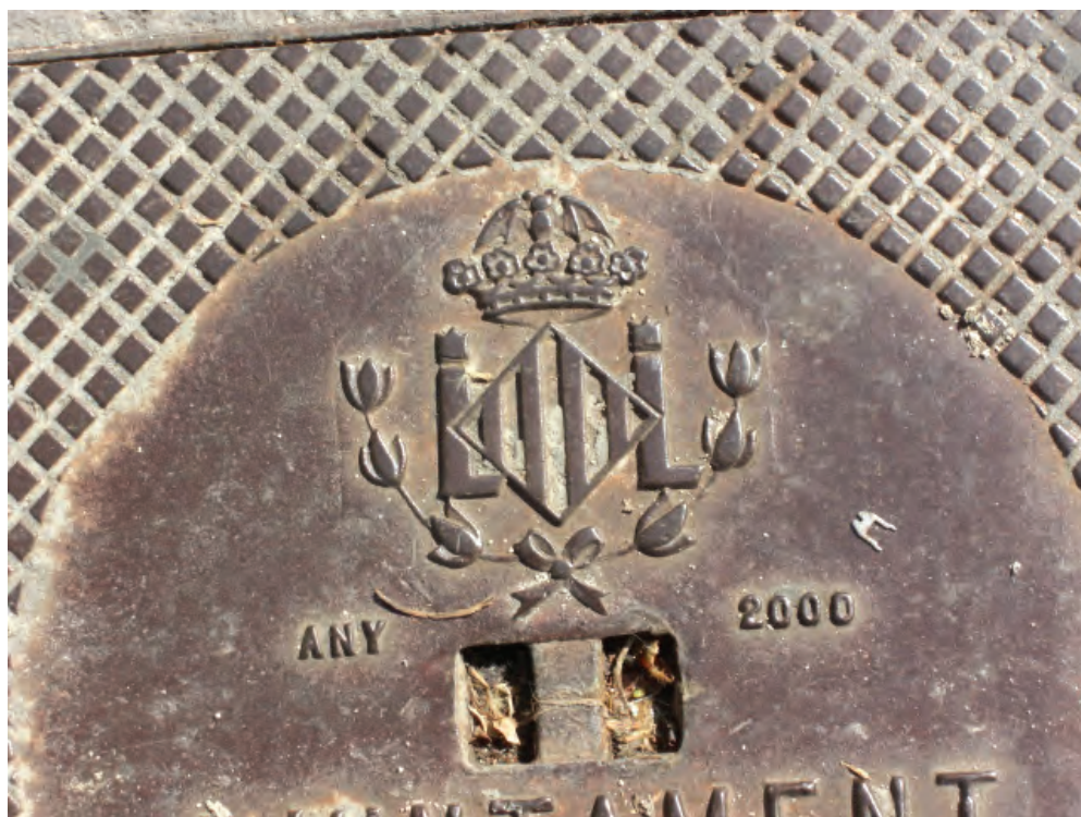
Fig. 26: Valencia

nya betydelser i bilden. I Jonathan Winters och Philip Cammaratas bok Did Anyone Bring an Opener? (1960) är boksidorna skurna horisontellt i en överliggande bilddel och en underliggande textdel. Varje del kan genombläddras separat. Bilderna, 45 till antalet, visar skilda situationer från gamla svartvita filmer, medan de 45 olika texterna återger fingerade repliker. Varje bild kan således kombineras med 45 olika repliker och varje replik kan kombineras med 45 olika bilder. Resultatet är roande samtidigt som boken på ett effektivt sätt visar hur texten styr tolkningen av bilden och hur bilden styr tolkningen av texten. Fenomenet är det samma när det gäller bokstäverna på de svenska brunnslocken. När vi läser bokstaven K på ett brunnslock formulerar vi ordet kloak i tankarna och tänker på avloppsfunktionen. När vi tolkar bokstaven som en förkortning av ordet kärlek går våra associationer i en helt annan riktning och locket blir tilltalande och attraktivt. Företaget Little Frogs har knutit an till de svenska versallocken och producerat en kärleksbrunnsmatta tillverkad av ull och med en diameter på 60 cm. Den är rund och röd, och mitt på mattan står bokstaven K. Mattan är tänkt som bröllopspresent.