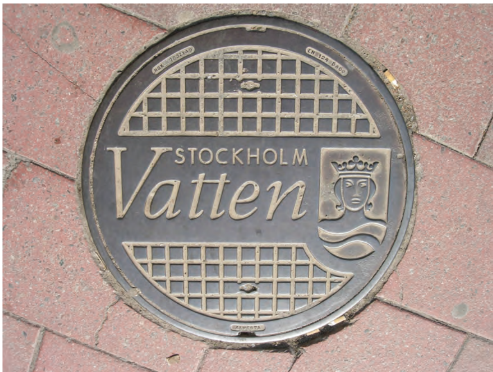
Fig. 9: Stockholm

till funktion. Sewer betyder både kloak och avlopp. I Sverige använder man diskret versalen K.