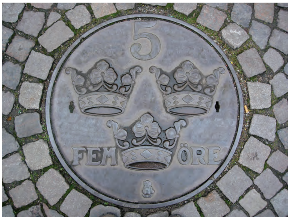
Fig. 25: Femöreslocket i Lund