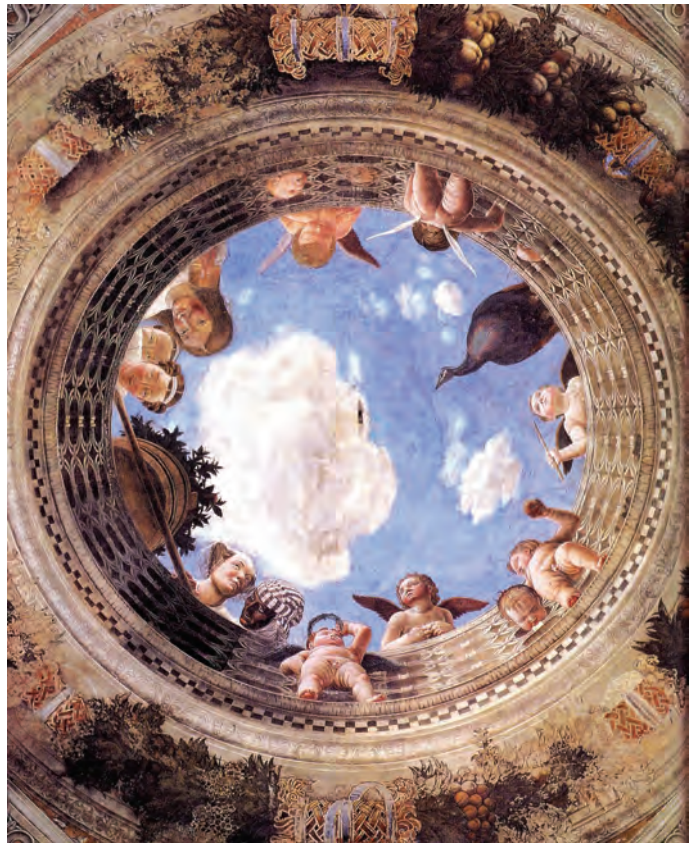
Fig. 15: Andrea Mantegna (1465–74)

Ett brunnslöck med en elegant tondoform hittar vi i Berlin (figur 14). Locket är designat av Marcus Botsch och är komponerat på liknande sätt som Mantegnas plafondmålning i La Camera degli Sposi i Gonzagas palats i Mantua, där en rad gestalter – kvinnor, putti och en påfågel – ses bakom en cirkelrund målad balustrad