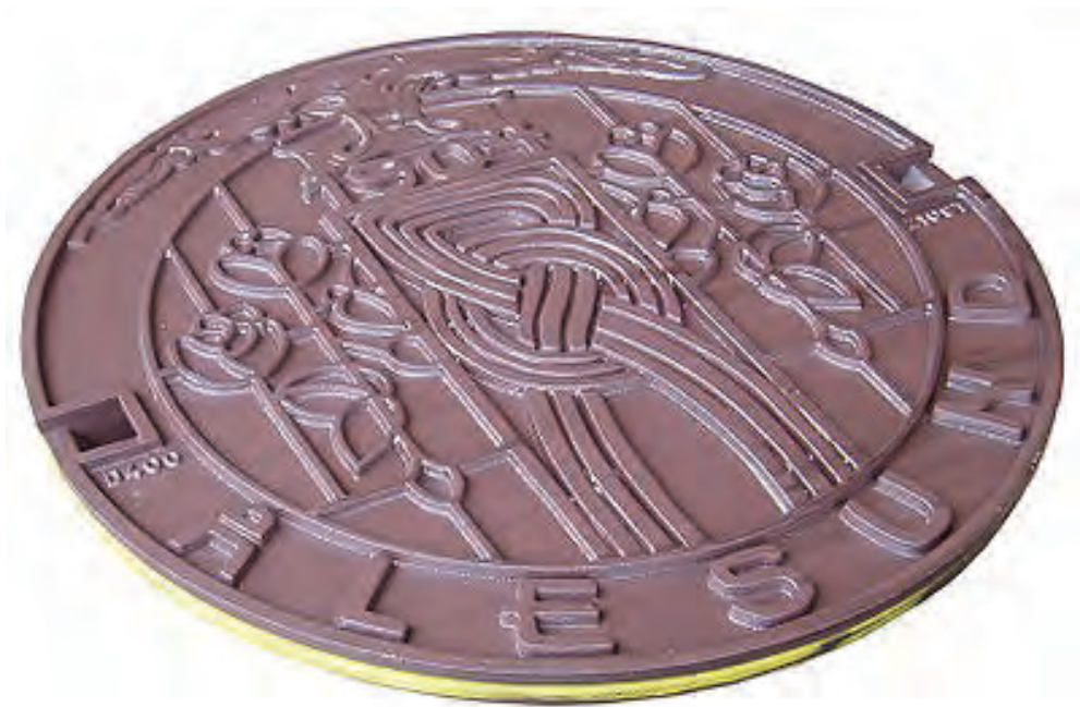
Fig. 11: Ålesund

gondolställning i cirkelbandet kring bilden. Just den seden har lång tradition även i Danmark. Under de senaste decennierna har stadsvapnet gjort sitt intåg också på vissa svenska lock. Numera hittar vi vapensköldslock i bland annat Halmstad, Hässleholm, Malmö och Stockholm.