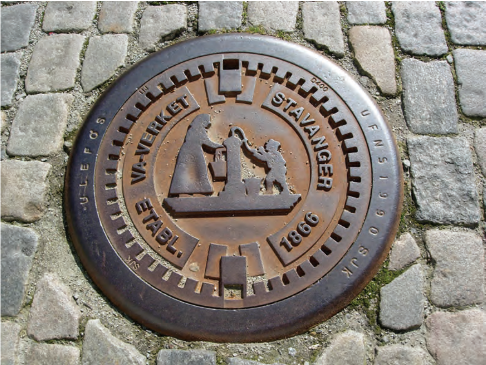
Fig. 10: Stavanger

på vattenytan. På locket står orden "The Thames Water". Ord och bild pekar på varandra. Stockholm fick för några år sedan ett nytt brunnslock som placerades ut i centrala delar av staden. Locket exponerar stadens namn, ordet vatten samt en bild av Mälardrottningen, kvinnogestalten som sedan 1870-talet symboliserar Stockholm. Den mest kända gestaltningen av Mälardrottningen är Einar Forseths mosaik i Gyllene salen i Stockholms stadshus. Där tronar hon i full gestalt. På brunnslocket ser vi enbart hennes krönta huvud så som det framställs på Stockholms stadsvapen. Men vi ser också något mer: drottningen står i vatten upp till axlarna (figur 9). Lockets design är tydligt horisontell, som vattenytan. Inget försök har gjorts att strukturera locket enligt tondons radiella karaktär.