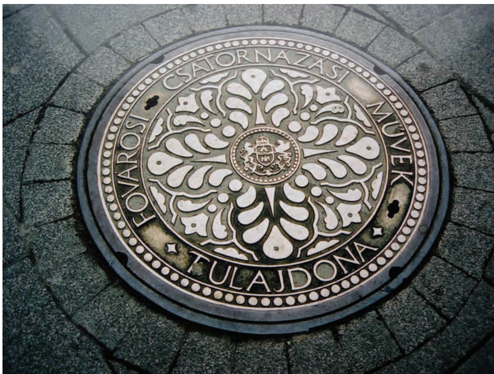
Fig. 7: Budapest

betraktaren in i en bestämd betraktarposition (figur 6). Samtidigt som radiella linjer strömmar in mot mitten av tondon fixerar horisontlinjen långt under den fallande gestalten denna gestalt i en kvadratisk ram inuti cirkeln. Cirkelns mittpunkt blir också kvadratens mittpunkt.