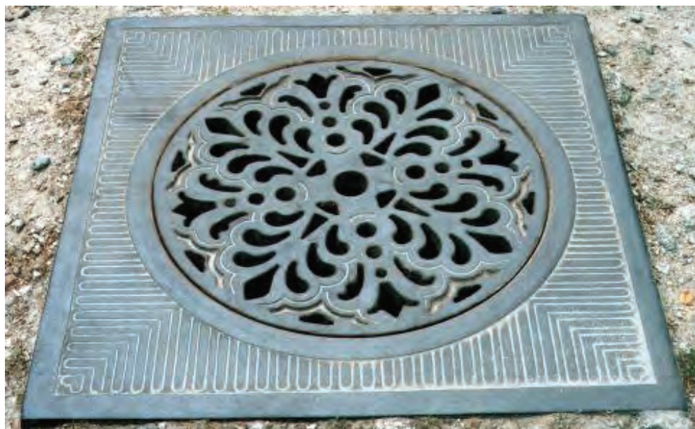
Fig. 2: Paris

antal rutor kan cirkeln indelas i ett oändligt antal sektorer eller tårtbitar. Arnheim framhåller att medan cirkeln "has infinitely many symmetrical axes, the square has only four, namely, the two paralleling the edges and the two diagonals connecting the corners". 2 Han påpekar att cirkeln kontrolleras av en struktur som är cirkelns egen, vilket innebär att den liggande cirkeln inte etablerar någon självklar position för avläsning på det gemensamma golv där cirkeln och betraktaren befinner sig. "This structural difference between the shapes of the two enclosures also affects the character of the balancing center. The center of the tondo is a stable, firmly determined spot. The center of the square is more nearly a crossing." 3 Detta kan förklara de runda brunnslockens större självständighet