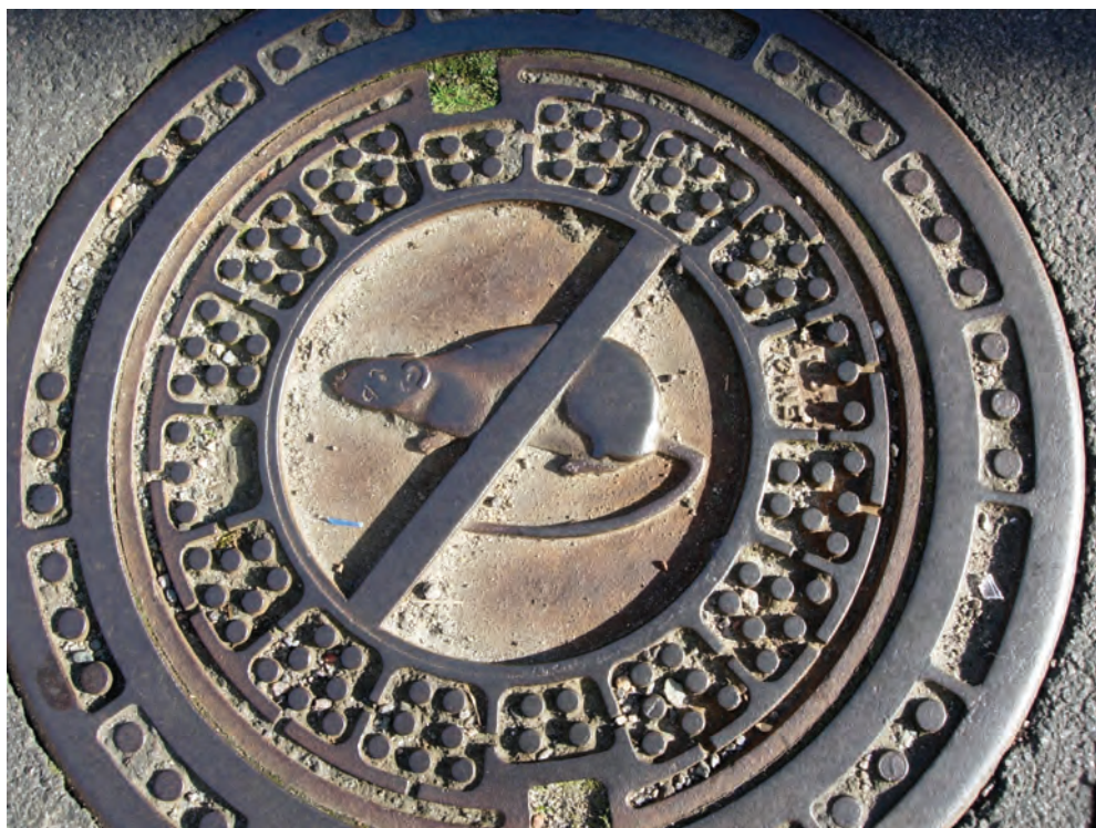
Fig. 8: Gudhjem på Bornholm

Under de senare decennierna har de vanliga konventionella brunnslocken i många länder kompletterats med lock som visar upp en helt annorlunda design. Dessa lock försvinner inte in i en anonym tillvaro i gatubeläggningen. Den föreställande bilden har givits en ökad betydelse i designen, det verbalvisuella tilltalet har fått en ny adressat, nämligen den förbipasserande allmänheten. Fortfarande är givetvis informationen om funktion viktig, men samtidigt är det skillnad på funktion och funktion. Det är sällan kloaklocken uppmärksammas med en föreställande bild som refererar till deras funktion. Ett undantag hittar vi i Gudhjem på Bornholm där det runda kloaklocket visar upp bilden av en råtta. Ett snett streck ligger över råttan i ringens diameter, vilket refererar till förbudstecknet i trafikskyltarnas värld. Råttbilden med snedstreck varnar obehöriga för att lyfta på locket. Därunder pulserar råttornas värld (figur 8). Det är heller inte vanligt att se ordet kloak på brunnslock, i varje fall inte i Europa. I Tyskland kan man hitta ordet Abwasser eller Schmutzwasser på vissa lock, i USA ordet sewer, men utan interaktion med någon bild som refererar