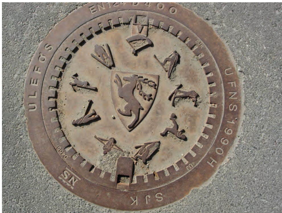
Fig 17: Vossevangen

Men även senare tiders historia kan markeras på gatans brunnslock. På Alter Markt i Dortmund ligger sedan 1993 ett lock som visar en bild på stadens gamla rådhus samt texten "Histor. Rathaus zerstört 1944" (det historiska rådhuset, förstört 1944). Locket gör den förbipasserande uppmärksam på att Dortmunds gamla rådhus låg på detta torg och att byggnaden blev totalförstörd under andra världskrigets slutskede. För tyska städer som förstördes under åren 1944–1945 är det viktigt att markera sin gamla historia. Men även händelser i samtiden är något som relateras på brunnslocken. Med förkortningen och siffran "Expo '98" markerar Lissabon en för staden viktig samtids-händelse, nämligen världsutställningen 1998. På locket ser man även utställningens logo. Lillehammer markerade vinterolympiaden 1994 med ett minneslock, detsamma gjorde Salt Lake City 2002 när vinterolympiaden arrangerades där. I Valencia lade man 2005 ner ett brunnslock i hamnområdet för att fira att staden det året arrangerade den traditionsrika havskappseglingen America's Cup. På locket ser vi avbildad den prestigefyllda 160 år gamla vandringsbucklan, den så kallade Amerikapokalen, som har fått sitt namn efter sin första erövare, den amerikanska skonaren America 1851 .