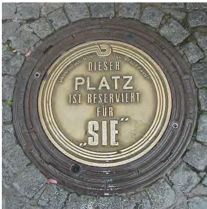
Fig. 21: "Denna plats är reserverad för dig"

gammal stad). På Alter Platz i Klagenfurt i Österrike ligger en affär för herrmode och på ett brunnslock på samma torg kan man läsa affärens namn: "Lord Herrenmoden Armin Oberordner". I Dortmund kan man stanna vid ett vackert lock som visar reliefen av en hängande druvklase. Under druvklasen läser vi "H. Hilgering" i skrivstil. Över druvklasen står skrivet i paraplyställning "Weinhaus seit 1891" och i gondolställning under firmanamnet "70 m links" (H. Hilgering. Vinhus sedan 1891. 70 meter till vänster; figur 20). Man får anta att locket bara kan läggas ned i den runda öppningen på ett enda sätt så den törstige leds i rätt riktning.