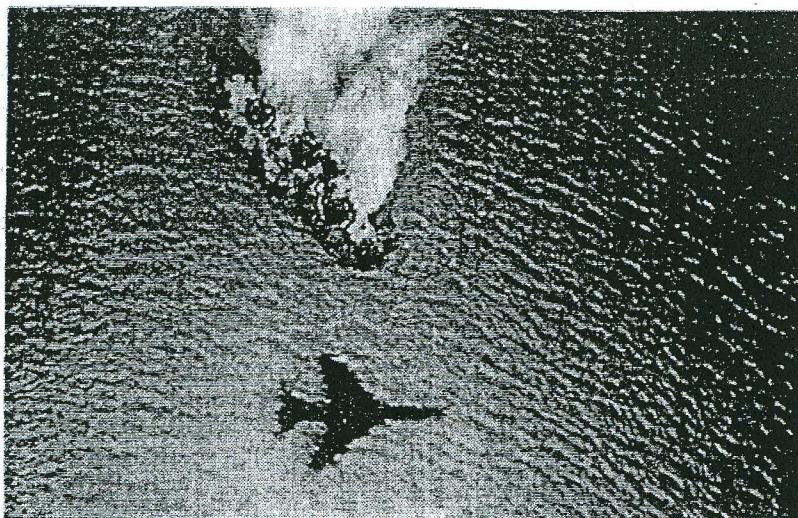
Perspektivet uppifrån. Amerikansk bombplan sänker nordvietnamesiskt krigsfartyg 1972.

Den dagen i Hai Phong stod alltså Lien – överväldigad av sin smärta och bitterhet över de amerikanska bombningarna – tillsammans med den upprivne krigsveteranen, som hade deltagit i bomb-