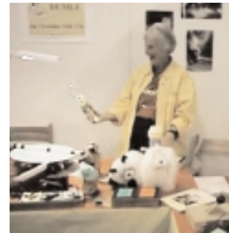
Att minnas namnet på en person.